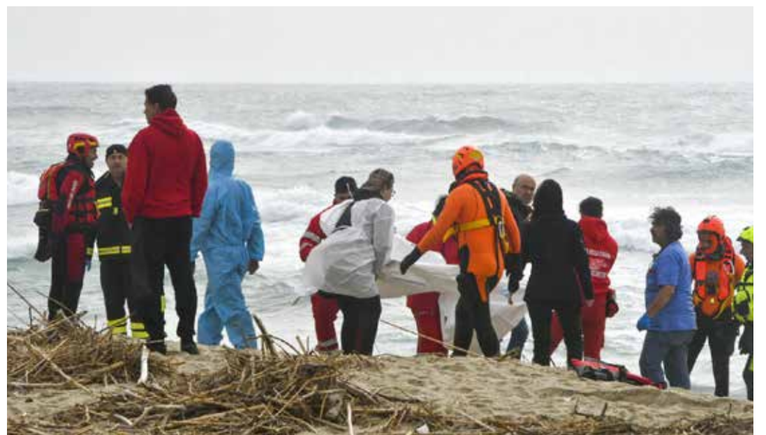
Due immagini della strage di Cutro. Il recupero dal mare dei migranti annegati e la lunga fila di bare delle vittime della strage sia adulti che bambini (in primo piano le loro bare bianche)