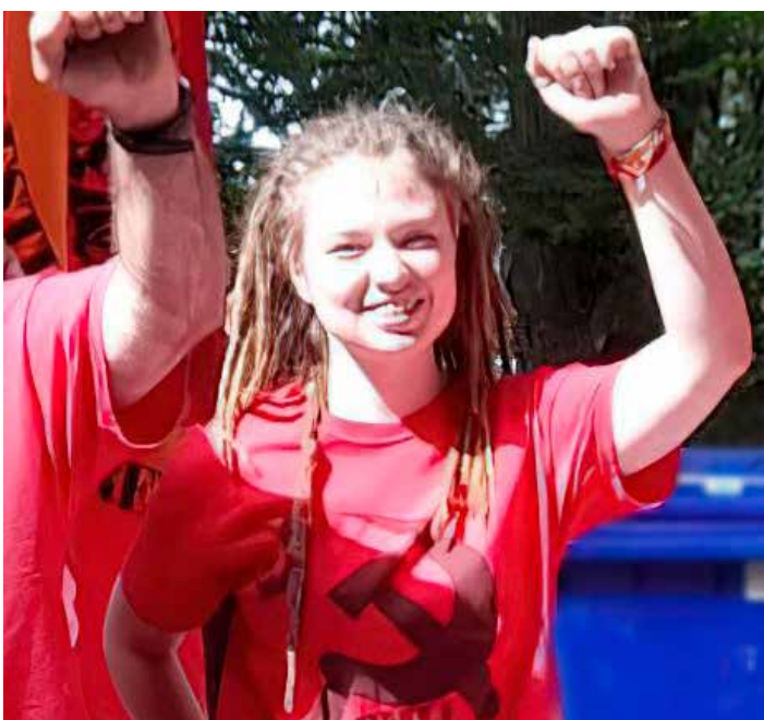
Margherita alla Marcia partigiana al Monte Giovi l'11 luglio 2022

È estremamente essenziale l'exkursus storico che contestualizza la giornata e ricostruisce parzialmente, ma efficacemente, lo sviluppo del movimento femminista. Punto evidenziato giustamente mol-