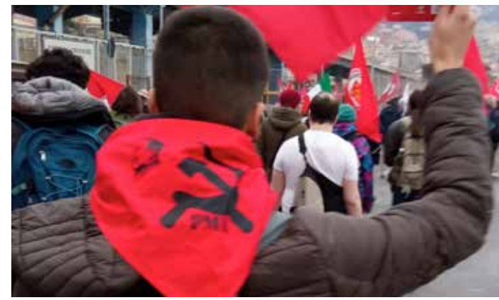
Gioe durante la manifestazione per la pace a Genova il 25 febbraio scorso

La lotta delle donne deve necessariamente essere congiunta alla lotta delle masse oppresse, sulla scia del-