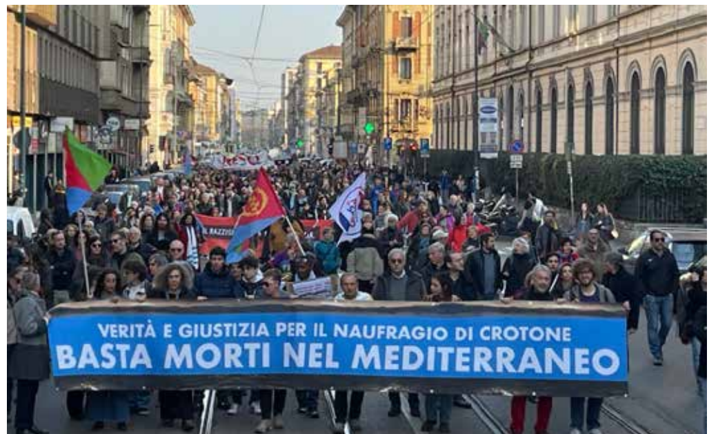
Milano, 4 marzo 2023. Migliaia di persone sono scese in piazza per manifestare contro il governo Meloni e rivendicare la verità e la giustizia per la strage di migranti annegati il 26 febbraio scorso vicino alle coste di Cutro sulla costa calabrese e dove hanno perso la vita più di 70 persone molte delle quali bambini. Molte le associazioni e le organizzazioni per l'accoglienza presenti, mentre non sono mancati cartelli e striscioni contro il governo, Piantedosi e contro l'imperialismo come causa di guerre e delle stragi dei migranti.