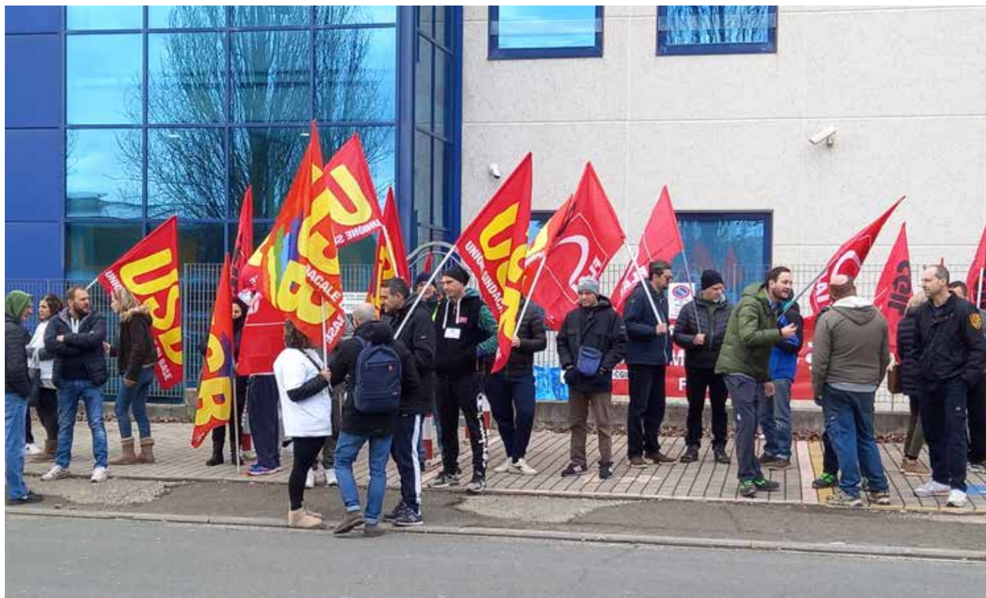
Scarperia e San Piero (Firenze) 3 febbraio 2023. Presidio ai cancelli della fabbrica delle lavoratrici e dei lavoratori della "Drogheria e Alimentari" contro i licenziamenti

Il comunicato è stato pubblicato lo stesso 3 marzo integralmente dai giornali on-line "Mondonuovo news" e "OK!Mugello", quest'ultimo anche sulla sua pagina Facebook col titolo redazionale "Il Partito marxista-leninista italiano esprime solidarietà ai lavoratori della 'Drogheria e Alimentari'".