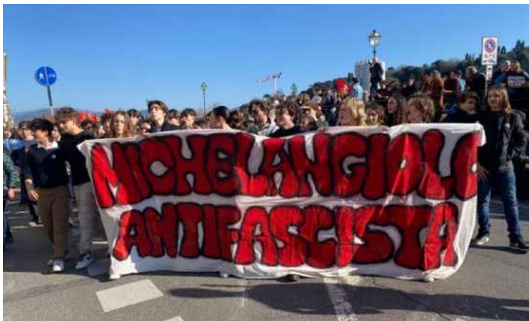
Gli studenti del liceo Michelangelo in corteo verso piazza Santa Croce