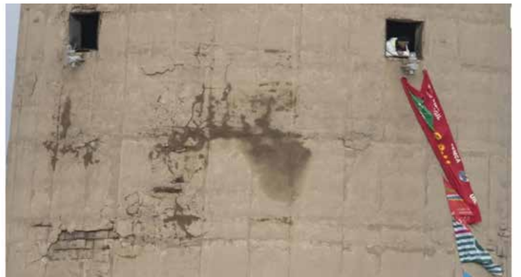
Un particolare della alta ciminiera in cui si sono asserragliati a 100 metri di altezza alcuni lavoratori per protestare contro la perdita del posto di lavoro

Adesso si parla di un futuro di estrazione del prezioso litio per le batterie da quelle usate, anche in questo caso una prospettiva tutta da verificare e