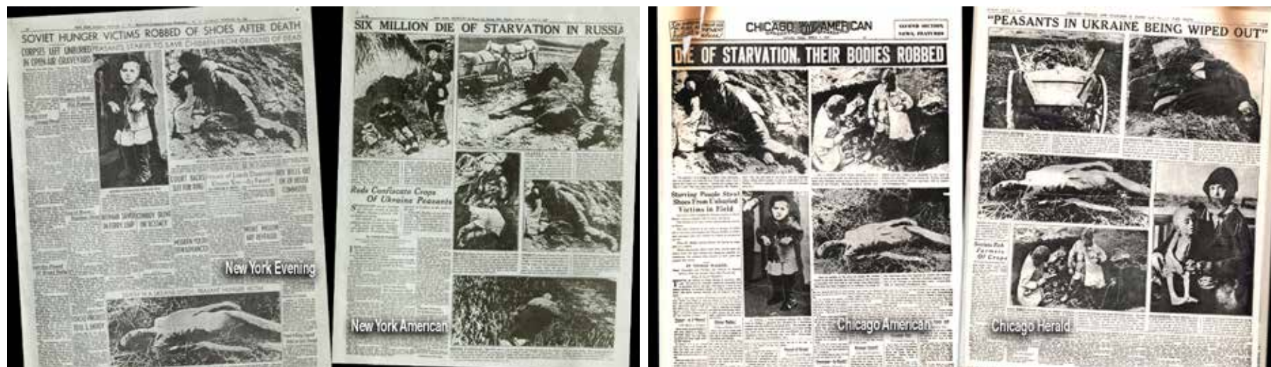
Le riproduzioni di quattro quotidiani dell'editore anticomunista Hearst, pubblicati nello stesso periodo, con gli articoli dello stesso falso "giornalista" con titoli catastrofici e fotografie che vorrebbero dimostrare e addossare la colpa della carestia al governo sovietico. In realtà, anche quelle foto furono un falso clamoroso e sbugiardato giacché erano relative alla carestia e ai morti causati dalla guerra civile in Russia a cavallo degli anni Venti (vedi il Bolscevico n. 12 del 31 marzo 2022 per una descrizione completa)

È provato storicamente che colui che viene indicato, dai fautori della tesi del cosiddetto "Holodomor", come l'artefice della carestia ucraina, ossia Stalin, si adoperò al contrario personalmente, nonostante all'epoca dei fatti non ricoprì alcuna carica governativa né nell'Unione Sovietica né nella Repubblica Socialista Sovietica Ucraina, affinché a tutti i territori sovietici colpiti dal flagello dell'epidemia e della carestia fosse fornito il massimo aiuto, l'articolo di Furr si conclude osservando infatti che: "fin dal 25 febbraio 1933 il Consi-