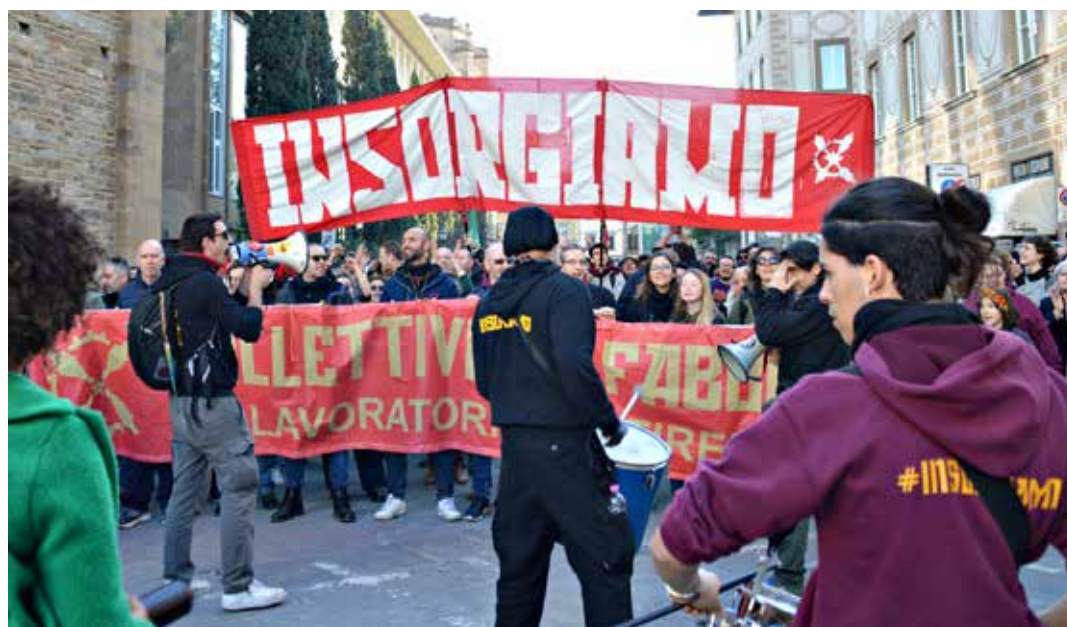
Firenze, 4 marzo 2023. L'arrivo in piazza Santa Croce dei lavoratori in lotta della ex GKN e delle/dei giovani uniti sotto lo slogan "Insorgiamo con i lavoratori GKN"