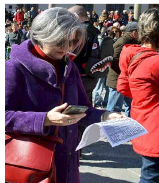
Firenze, 4 marzo 2023. Momenti della diffusione del volantino del PMLI di solidarietà agli studenti aggrediti e per lo scioglimento dei gruppi nazifascisti

parlando, ed infatti sia negli interventi che in alcuni striscioni il riferimento all'abolizione della "scuola classista, così come "dell'alternanza scuola lavoro", era ben presente. Allo stesso tempo è vivo e vegeto qual principio per cui essa stessa, così come la nostra società in generale, debba basarsi innanzitutto sull'antifascismo fattivo. Anche per questo la scuola dovrebbe essere governata dalle studentesse e dagli studenti.