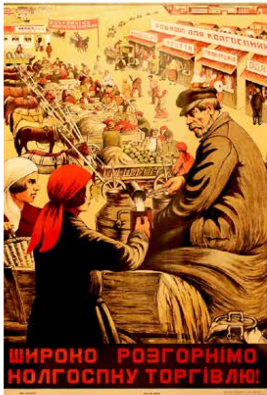
Due manifesti ucraini: “Espandiamo ancora di più il commercio delle fattorie collettive!” del 1932. “12 dicembre 1937- Lavoratori! Tutti alle elezioni del Soviet supremo dell'URSS!” del 1937

Che gli autentici fautori del socialismo - donne, uomini, Lgbtqi+ - capiscano che il loro dovere rivoluzionario è di dare tutta la propria forza intellettuale, morale, politica, organizzativa e fisica al PMLI per il trionfo del socialismo in Italia.”