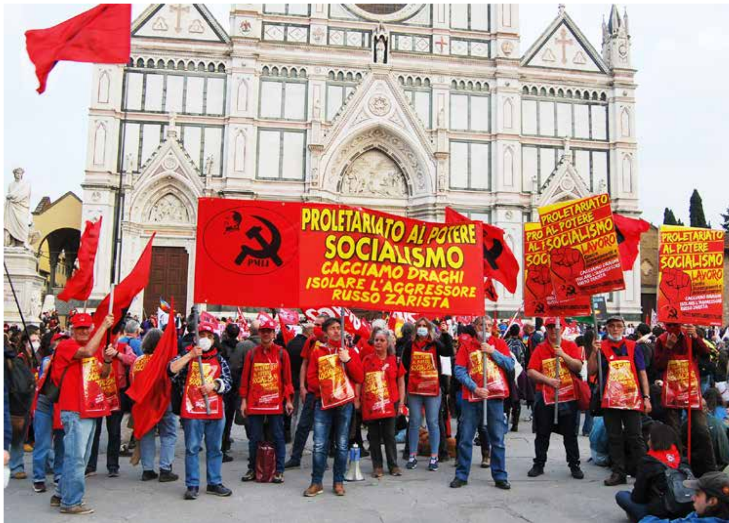
Firenze, 26 marzo 2022. Il PMLI partecipa alla combattiva manifestazione nazionale in appoggio alla lotta dei lavoratori della GKN lanciando con forza la parola d'ordine "Proletariato al potere, socialismo". Qui in piazza S.Croce punto di arrivo del lungo corteo

Ma non è finita qui: "la ricchezza del 5% più ricco degli italiani (titolare del 41,7% della ricchezza nazionale netta) - prosegue il rapporto a pagina 14 - era superiore, a fine 2021, allo stock di ricchezza detenuta dall'80% più povero dei nostri connazionali (31,4%). La posizione patrimoniale netta dell'1% più ricco (che deteneva a fine 2021 il 23,3% della ricchezza nazionale) valeva oltre 40 volte la ricchezza detenuta complessivamente dal 20% più povero della popolazione italiana".