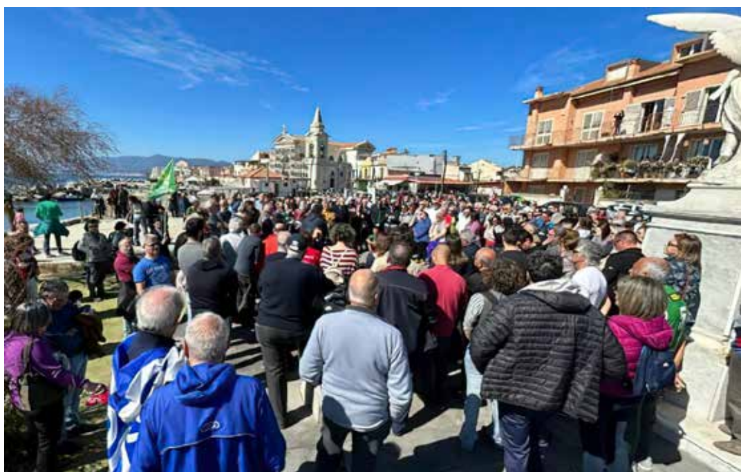
26 marzo 2023. Manifestazione a Torre Faro (Messina) contro il varo del "nuovo" decreto per la costruzione del Ponte di Messina

Che gli autentici fautori del socialismo - donne, uomini, Lgbtqi+ - capiscano che il loro dovere rivoluzionario è di dare tutta la propria forza intellettuale, morale, politica, organizzativa e fisica al PMLI per il trionfo del socialismo in Italia."