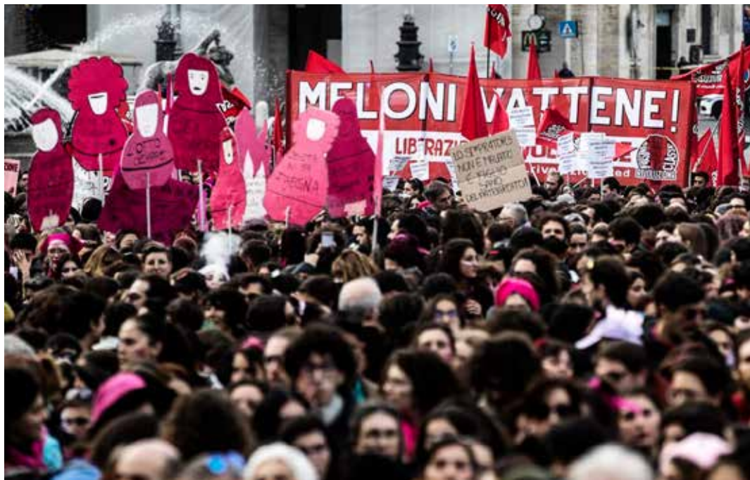
Roma, 27 novembre 2022. Manifestazione nazionale contro la violenza sulle donne

Per noi marxisti-leninisti italiani, è un diritto che va riconosciuto sia alle coppie eterosessuali sterili che a quelle omosessuali, cioè a chi è biologicamente impossibilitato a generare figli, purché basata sulla libera scelta da parte delle donne e mai a scopo di lucro. Come nel caso dell'aborto e della fecondazione assistita, le donne devono avere il diritto di decidere da sole, accettando o meno di prestarsi alla gestazione per altri. Si nega tale diritto non per difendere le donne e la loro dignità, ma perché si vuole continuare a tenere la nascita, come la morte, vincolate al "mistero" e alle leggi divine e impedire che vengano poste sotto il controllo