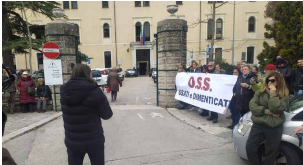
14 marzo 2023. Il presidio di protesta sotto la sede dell'ASREM a Campobasso dei precari OSS

Comunicato stampa del Comitato provinciale di Firenze del PMLI, condiviso successivamente dalla Confederazione delle Sinistre Italiane