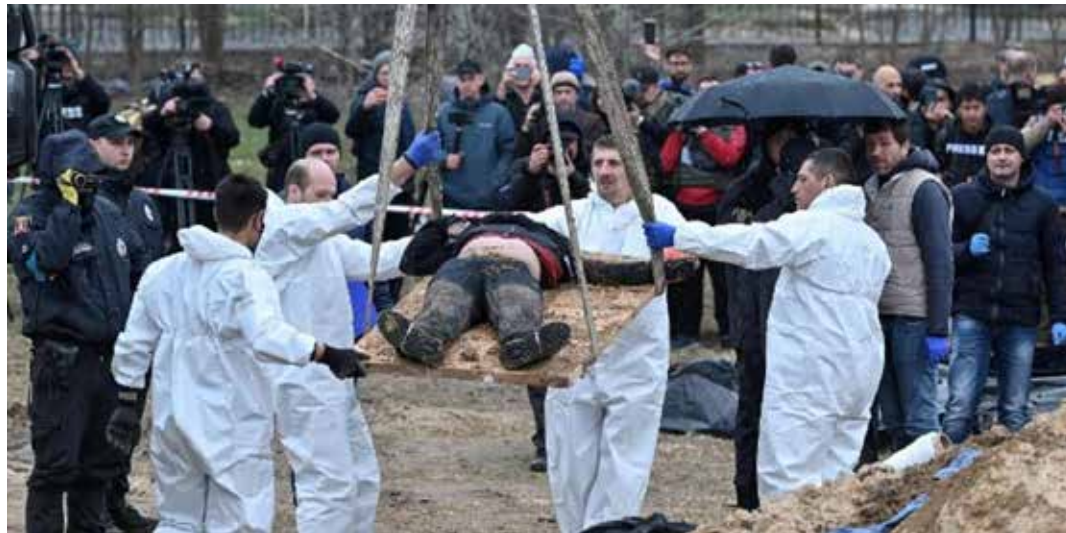
Uno dei recuperi dei corpi delle vittime nelle fosse comuni lasciate dai russi nelle zone occupate nell'inchiesta delle commissioni forensi europee e ucraine sui crimini di guerra

Se, quindi, da un punto di vista giuridico la decisione è poco più che un atto formale privo di conseguenze, da un punto di vista politico essa, per usare le parole di Zelens'kyj, è "una decisione storica", perché condanna l'imperialismo del nuovo zar Putin e le peggiori conseguenze di esso, che pregiudicano la popolazione ucraina più indifesa.