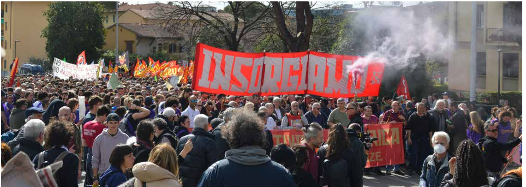
Il corteo in movimento dalla sede della ex-Fiat di Novoli. Nella prima fila, in apertura al centro, si nota un operaio della GKN che indossa il corpetto con il manifesto del PMLI a sostegno della vertenza GKN