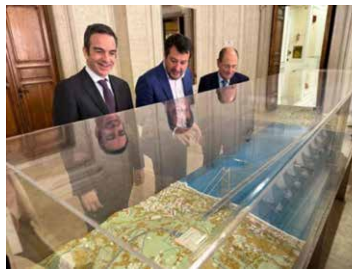
Salvini, ministro delle Infrastrutture, con Occhiuto (a sinistra) presidente della regione Calabria e Schifani presidente della regione Sicilia, si pavoneggiano davanti al modello del ponte

Il Ponte sullo Stretto è una spaventosa opera di devastazione ambientale, sociale e culturale, priva di effettiva e durevole utilità pratica. Dal punto di vista ambientale non viene assolutamente considerato il grave impatto dell'opera sull'ambiente marino dello Stretto, le cui peculiarità uniche rendono imprescindibile la salvaguardia di molte specie animali - alcune anche a rischio di estinzione e particolarmente protette da direttive comunitarie e da convenzioni internazionali - e vegetali che qui hanno crea-