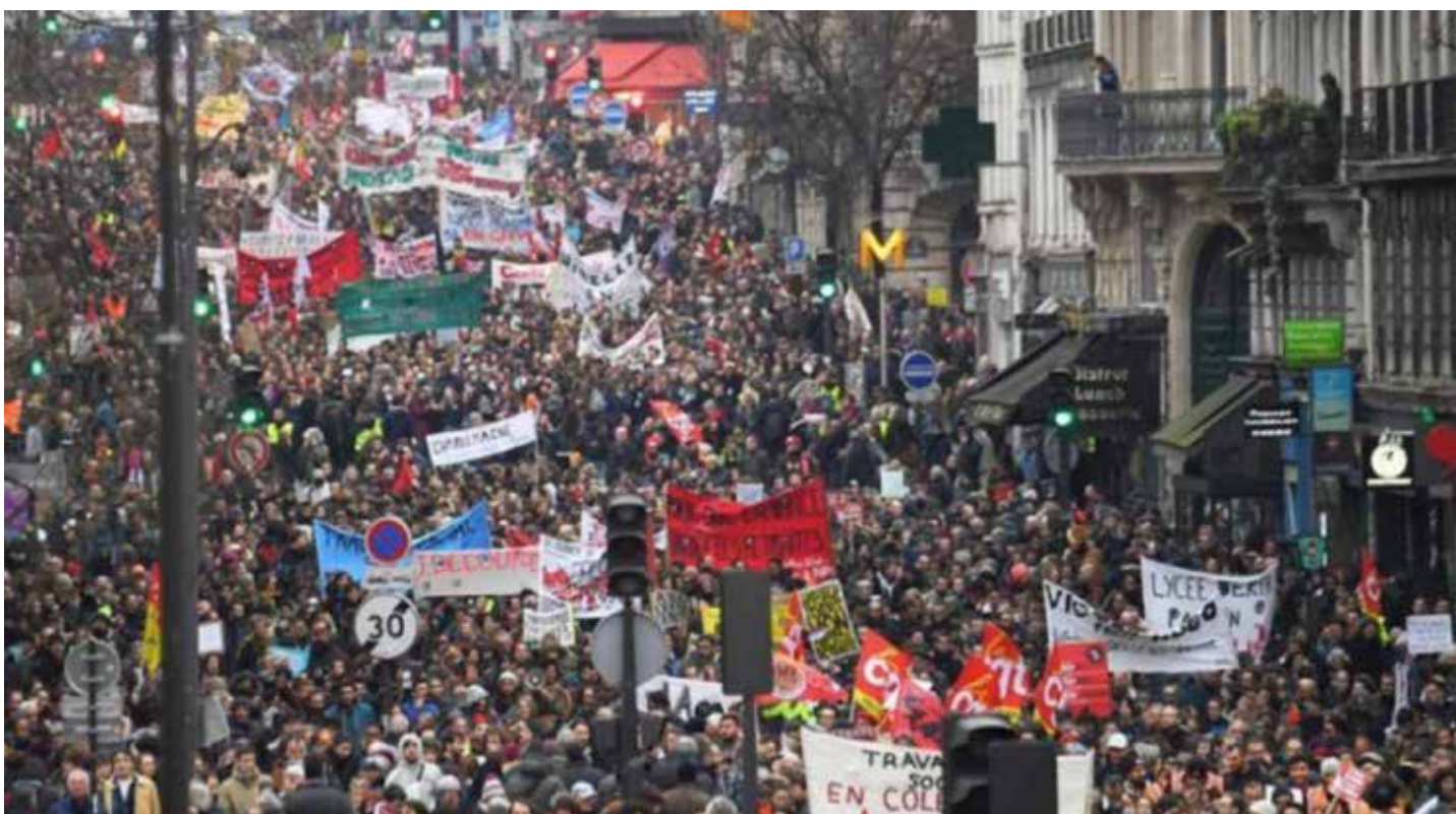
Parigi. Manifestazione contro la riforma delle pensioni del 23 marzo 2023

PER TUTTI ed è finanziato da STIPENDI. Spetta quindi ai lavoratori. Il suo finanziamento è assicurato da un sistema di SALARI DIFFERITI. Quindi cosa ricevono i pensionati quando i più giovani lavorano? Contrariamente a quanto sostiene il governo, i fondi pensione sono in attivo almeno fino al 2030. Ad ogni modo, la presunta cifra mancante sarebbe di 12 miliardi quando aumenta felicemente il bilancio dell'esercito da 250 a 400 miliardi.