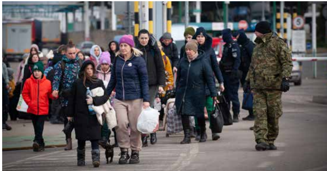
Una delle immagini della guerra di aggressione russa all'Ucraina: minori e adulti costretti a viaggiare lontano per sfuggire alla guerra

DECISO DAL VERTICE DI SAN DIEGO FRA BIDEN, SUNAK E ALBANESE