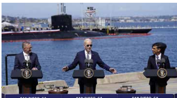
14 marzo 2023, San Diego. Il presidente americano Biden presenta la dotazione all'Australia di 3 sottomarini nucleari nell'ambito dell'accordo Aukus (Australia, United Kingdom and United States). A sinistra il premier australiano Albanese. Accanto a Biden a destra il primo ministro inglese Sunak

(RAN) avrà mezzi propri ma con tempi molto lunghi, si indica il 2032 come data possibile di acquisto di 3, forse 5 sottomarini d'attacco a propulsione nucleare americani della classe Virginia. Che per non far scivolare ancora più in là le date di consegna potrebbero essere unità