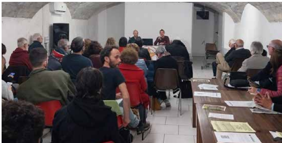
Roma, 26 marzo 2023. Assemblea nazionale per l'ambiente e il clima presso la Casa del popolo di Centocelle (foto Il Bolscevico)

Ovviamente quando si parla di popolazione mondiale non si possono intendere allo stesso modo tutti gli esseri umani: c'è chi subisce il peso di tali crisi fino a rimanerne schiacciato (e sono soprattutto persone che vivono in determinate aree geografiche, quelle a più basso reddito, sono le donne, sono le giovani generazioni...) e chi invece continua a trarre profitto, ad accumulare ricchezza dallo sfruttamento di esseri umani e risorse naturali per appagare il proprio egoismo. Se individuamo concordemente quindi il capitale come avversario ad un equo utilizzo dei beni del globo terracqueo a vantaggio di tutte e tutti occorre ovviamente comportarsi di conseguenza e presentare alla pubblica opinione le condizioni attuali con parole e con azioni coerenti che devono diventare patrimonio non soltanto di gruppi di sinistra o ambientalisti definiti come estremisti, in quanto occorre far maturare nell'immaginario collettivo un livello di consapevolezza che i gruppi detentori del potere economico-politico non vogliono invece che si diffonda. Se vogliamo che le cose cambino davvero, l'impegno a favore della giustizia sociale ed ambientale deve guadagnare il consenso della maggioranza delle persone; non a caso il compianto Mark Fisher ha definito la cultura neoliberale come un insieme di