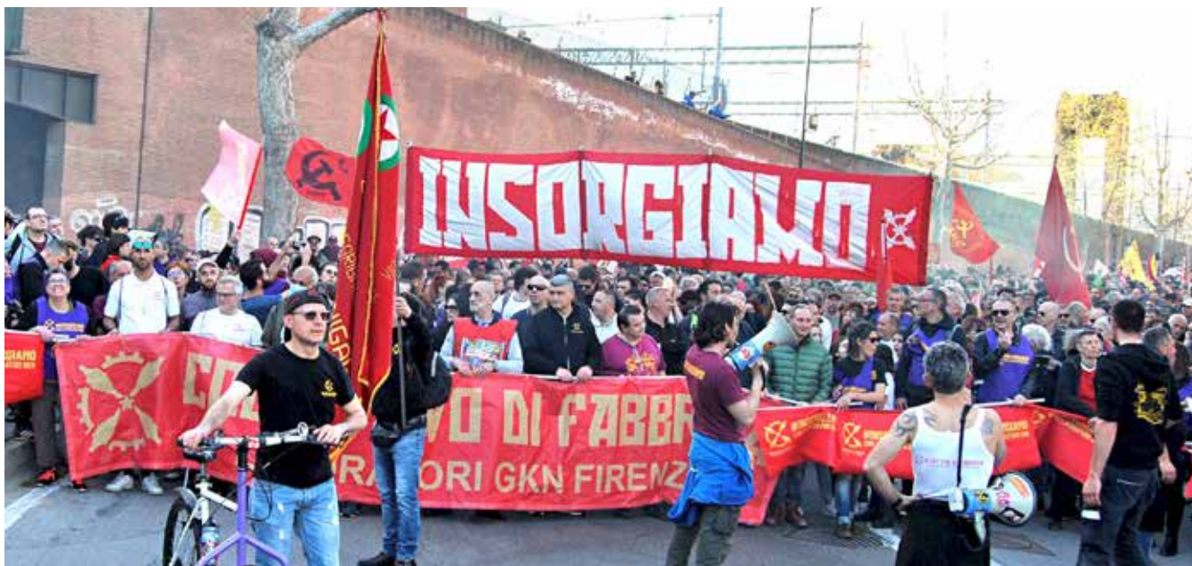
Firenze, 25 marzo 2023. Una bella immagine del Collettivo di fabbrica della GKN che ha guidato la manifestazione.

SPEZZONE DEI "COMUNISTI UNITI NELLE LOTTE OPERAIE" TRA CUI IL PMLI