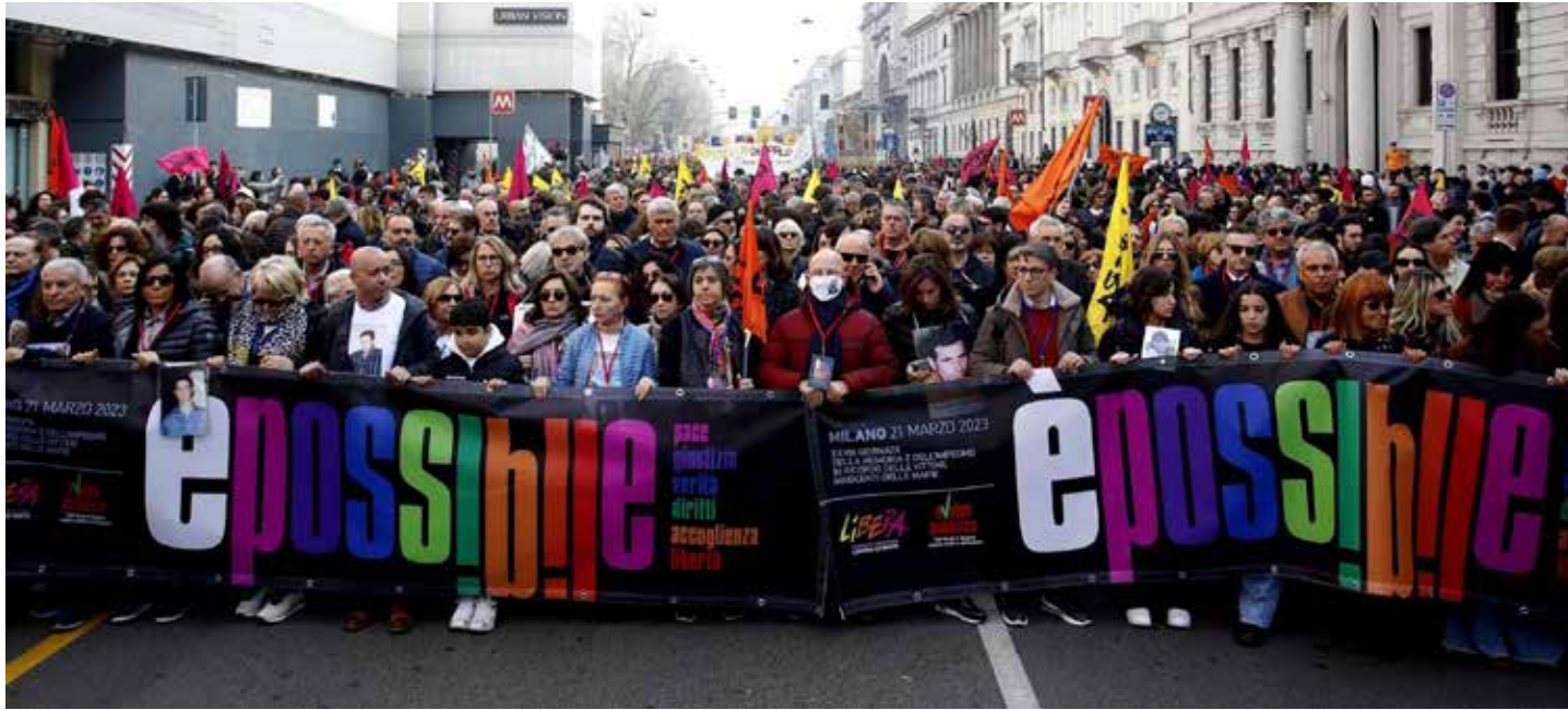
Milano, 21 marzo 2023. L'apertura del corteo della grande manifestazione contro le mafie

Nel suo discorso tenuto in una piazza Duomo gremita il presidente dell'associazione Libera, don Luigi Ciotti, ha peraltro detto: "Finché non ci sarà una presa di coscienza collettiva sulle ricadute della peste mafiosa, non si riuscirà a estirpare il male alla radice, una radice che è culturale,