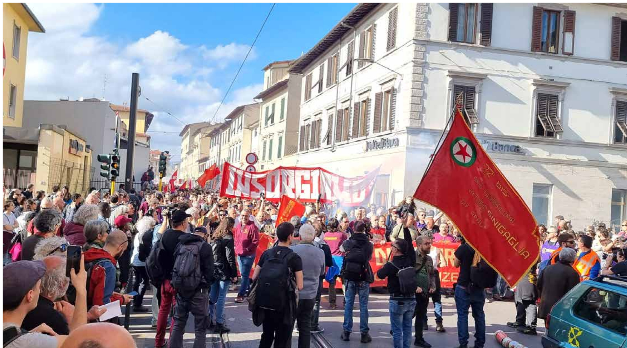
Firenze, 25 marzo 2023. Un momento del combattivo corteo dalle lavoratrici e dei lavoratori del Collettivo di fabbrica della GKN. Subito dietro, lo striscione "Insorgiamo", simbolo storico di questa importante e altrettanto storica lotta. Sulla destra la rossa bandiera della Brigata partigiana "Sinigaglia" che combatté per la Liberazione di Firenze dai nazifascisti. Nelle pagine dedicate vari aspetti della manifestazione

SPEZZONE DEI "COMUNISTI UNITI NELLE LOTTE OPERAIE" TRA CUI IL PMLI