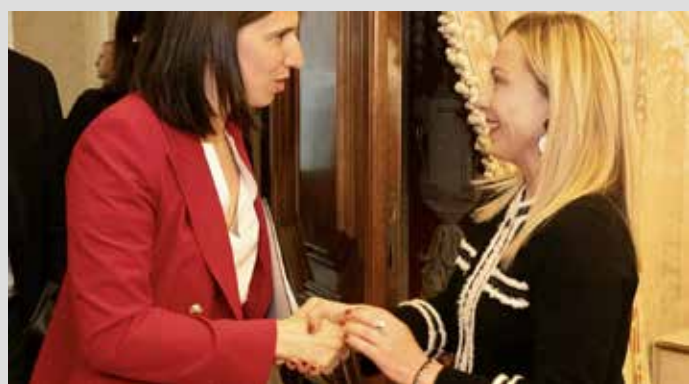
Roma, 9 maggio 2023. La cordiale stretta di mano a fine incontro tra la segretaria del PD Elly Schlein e la premier neofascista Meloni

Ma il punto non è semplicemente il gusto nel vestire, ma l'ottica esclusivamente borghese di una leader abituata al lusso tanto da potersi permettere di pagare qualcuno per suggerirle cosa comprare e quali colori abbinare. A Repubblica infatti la stessa Chicchio, armocromista e "personal shopper", ha dichiarato che le sue prestazioni vengono retribuite dai 140 ai 300 euro all'ora (ma per l'intero guardaroba dipende...), anche se per amicizia