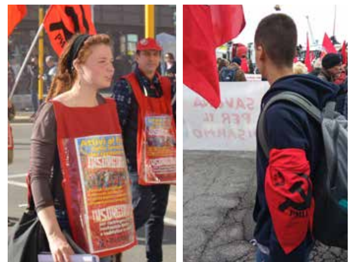
Firenze, 25 marzo 2023

(Mao, "In memoria di Norman Bethune", 21 dicembre 1939, Opere scelte, vol. 2, pp. 351-352)