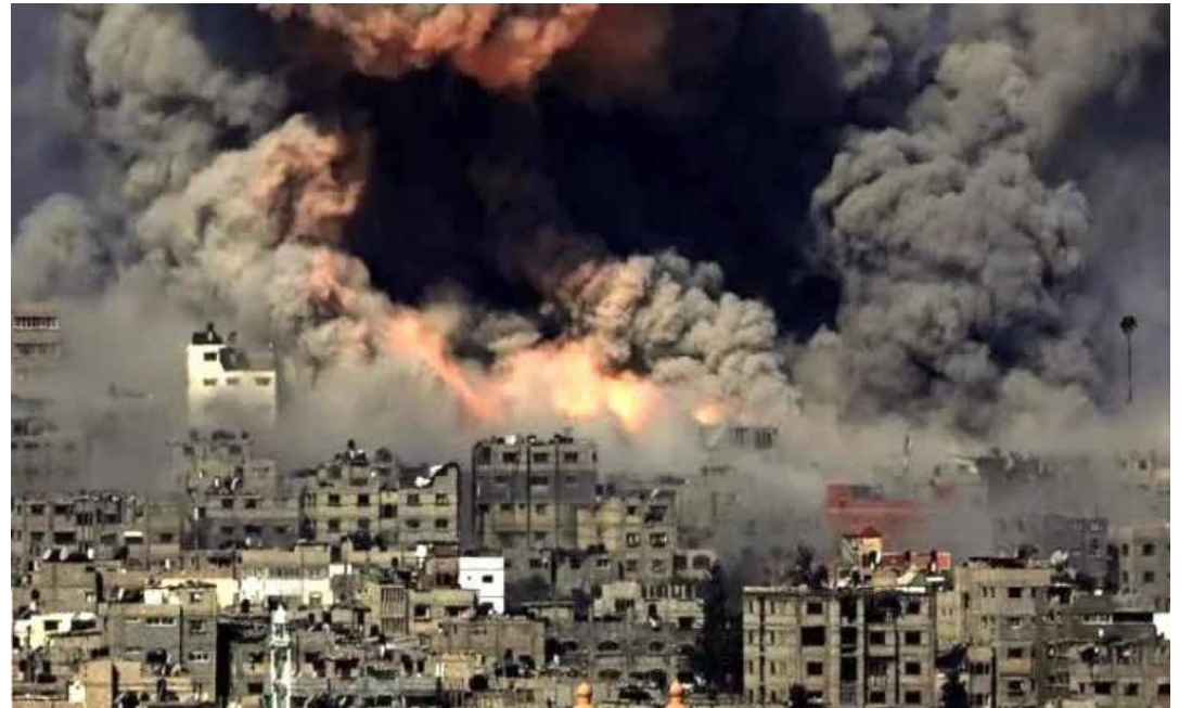
Il pesante bombardamento ad opera dell'esercito sionista su Gaza il 9 maggio scorso

Il 10 maggio, nell'anniversario della battaglia del 2021 di Saif al-Quds (Spada di Gerusalemme), scatenata dall'aggressione delle forze di occupazione israeliane e dei coloni contro il popolo palestinese nella zona occupata di Sheikh Jarrah e nella Moschea di Al-Aqsa durata ben 11 giorni, il Movimento di resistenza islamica palestinese Hamas ha dichiarato: "Primo: Salutiamo gli eroici martiri palestinesi, auguriamo ai feriti una pronta guarigione e salutiamo i detenuti nelle carceri dell'occupazione israeliana. Secondo: il popolo palestinese rimarrà unito