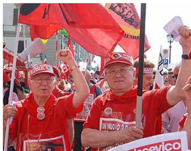
Firenze, 2 luglio 2010

(Mao, "Il ruolo del Partito comunista nella guerra nazionale" - Ottobre 1938 - Opere scelte, vol. II, pag. 207)