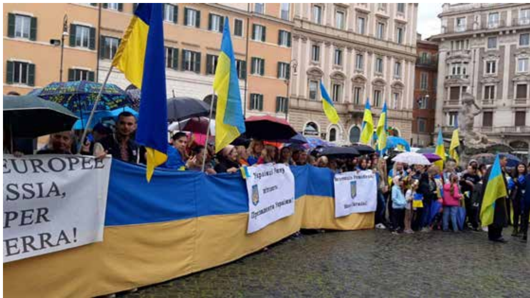
Roma, piazza Barberini, 13 maggio 2023. Ucraini residenti in Italia hanno accolto l'arrivo del presidente Zelensky con una manifestazione di sostegno alla lotta contro l'aggressore russo

I temi poi del colloquio tra il Papa e Zelensky, durato circa quaranta minuti, sono stati "riferibili alla situazione umanitaria e politica dell'Ucraina pro-