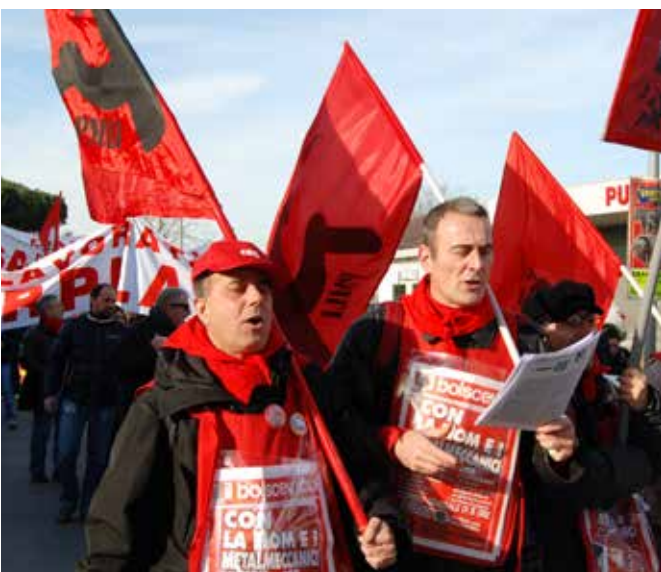
Massa, 28 gennaio 2011

(Mao, "La situazione nell'estate 1957", luglio 1957, in Rivoluzione e costruzione, Einaudi Editore, pag. 656)