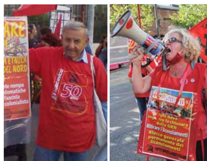
Siracusa, 26 ottobre 2019