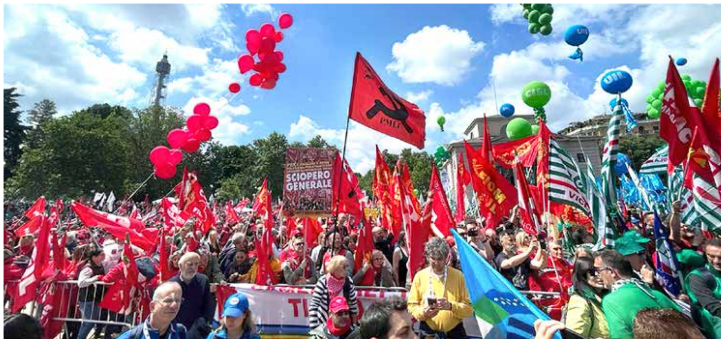
In piazza all'Arco della Pace, durante i comizi conclusivi, portato fin sotto il palco dal PMLI, unico partito presente, il manifesto per lo sciopero generale

Sulla stessa linea anche il segretario della CGIL Landini