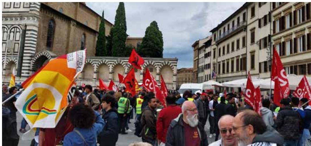
Firenze, piazza S.M. Novella, 13 maggio 2023. La manifestazione di solidarietà con il sindacato Si Cobas per la libertà sindacale e il diritto di sciopero alla quale ha portato il suo sostegno anche il PMLI

Tutte motivazioni che hanno contribuito al successo del corteo, che è stato per tutto il tragitto combattivo e colorato, composto da circa un migliaio di manifestanti. Lo aprivano i lavoratori immigrati iscritti al Si Cobas che intonavano gli ormai storici "Sciopero! Sciopero!" e "Tocca uno Tocca tutti!". Il corteo è partito da piazza S. M. Novella ed è terminato in Piazza dell'Unità d'Italia. Tra i parte-