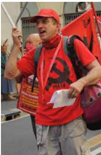
Firenze, 18 settembre 2021