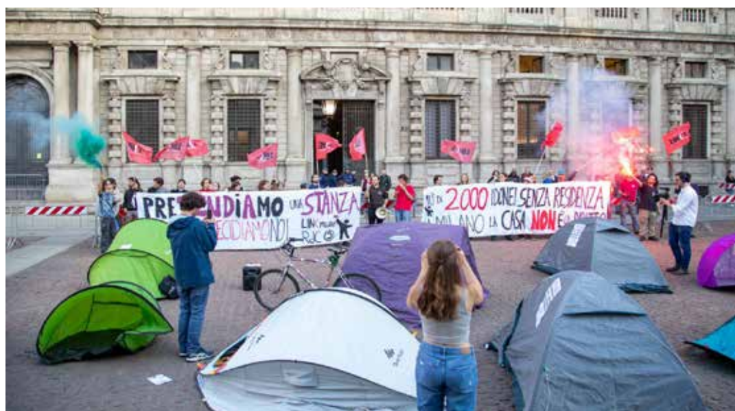
Milano, piazza della Scala, 11 maggio 2023. Protesta contro il caro affitti, con le tende, degli studenti fuori sede a cui si sono aggiunti anche lavoratori minacciati di sfratto

Al secondo punto gli studenti chiedono "il ripristino dell'equo canone per gli affitti e un massiccio piano di investimenti pubblici per l'ampliamento e la costruzione di nuovi studentati capaci di soddisfare tutta