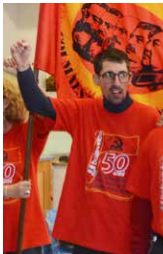
Firenze, 15 dicembre 2019