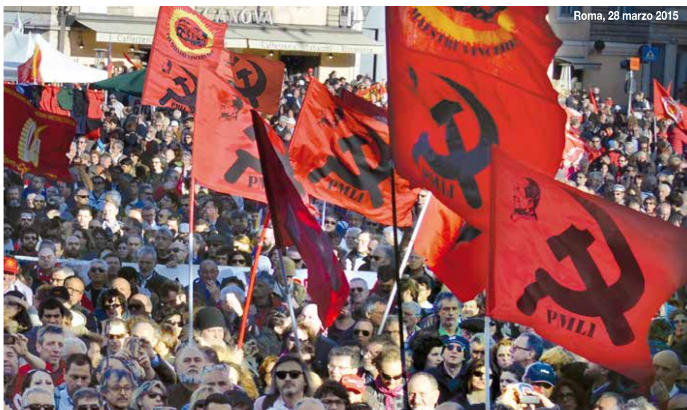
Roma, 28 marzo 2015