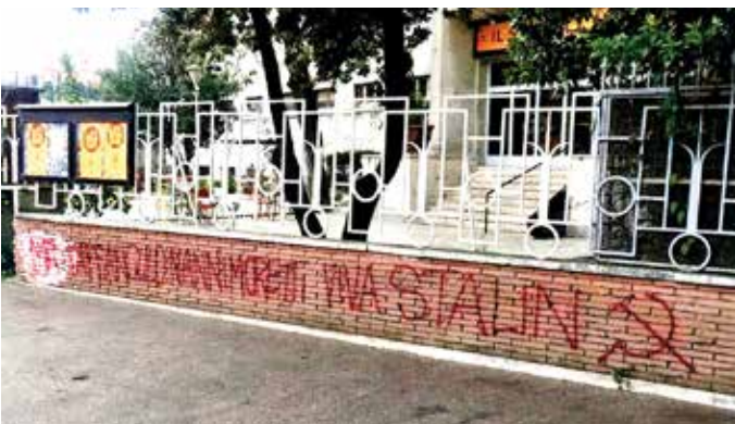
Roma. "Ma vaffanculo Nanni Moretti viva Stalin" e accanto il disegno di una falce e martello. Questa la scritta comparsa il 30 aprile sul muretto esterno al cinema Nuovo Sacher dove si sta proiettando il film "Il sol dell'avvenire" che attacca Stalin e, alla fine, esalta Trozky. L'autore della scritta invece ha ben chiari e a cuore i meriti storici e politici di Stalin contro la squallida kermesse trozkista di Moretti