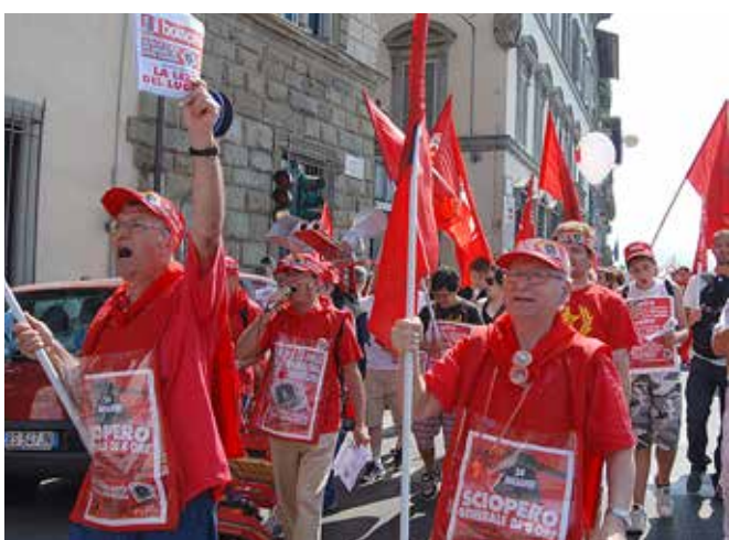
Firenze, 2 luglio 2010