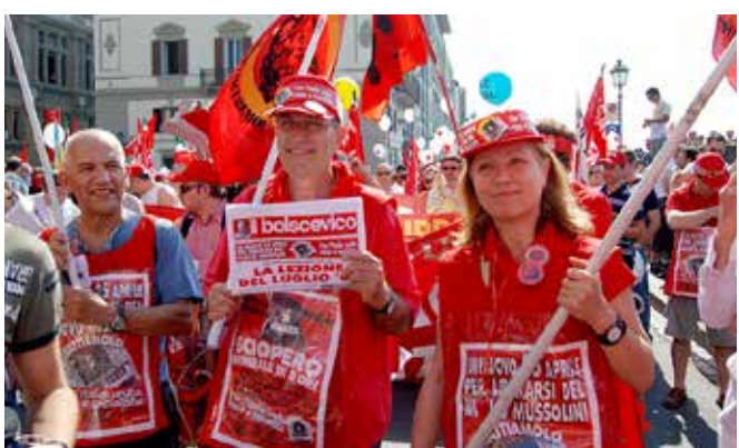
Firenze, 2 luglio 2010

(Mao, "Sui negoziati di Chungking" - 17 ottobre 1945 - Opere scelte, vol. IV, pag. 55)