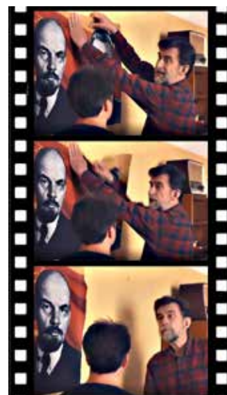
Sequenza di tre fotogrammi, tratti da una anticipazione del film "Il sol dell'avvenire", in cui Nanni Moretti strappa il ritratto di Stalin dal muro separandolo da quello di Lenin

Attraverso il personaggio di Giovanni (un regista che decide di realizzare un film sul PCI revisionista ambientato al Quarticciolo nel 1956 dove il direttore dell'Unità nei giorni della controrivoluzione ungherese decide di invitare a Roma il circo di Budapest a esibirsi nel suo quartiere per provare a "fare la storia con i se") Moretti torna sui fatti d'Ungheria del '56 e immagina di riscrivere la storia a proprio uso e consumo e si schiera apertamente a favore della controrivoluzione fondata dall'imperialismo e dalla reazione del traditore Imre Nagy per sovvertire il regime socialista in Ungheria e portarla nella sfera occidentale e della Nato, contro il movimento comunista internazionale e la scelta del PCI revisionista di Togliatti che secondo Moretti sbagliò a sostenere l'Urss e il campo socialista. Quel Nagy che come Orban oggi nel nome di un viscerale anticomunismo si battono per un sistema sociale e di valori