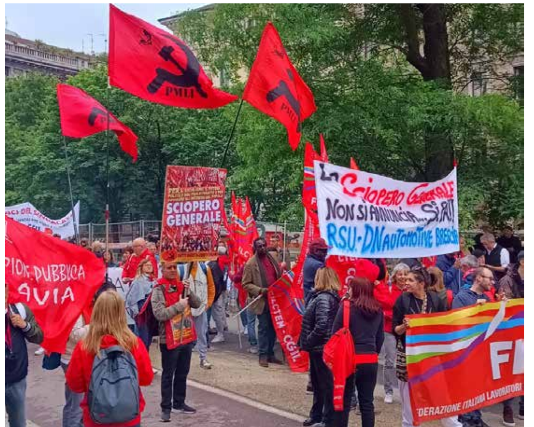
Milano, 13 maggio 2023. Nel corteo, come il PMLI, anche operaie e operai della RSU della DNautomotive di Brescia hanno tenuto alto uno striscione per lo sciopero generale subito

tori e alle masse popolari. Cosa aspettano Cgil-Cisl-Uil a mobilitarsi e a organizzarsi, a indire lo sciopero generale e a incalzare il governo neofascista Meloni affinché sia costretto a mettere in campo misure concrete ed efficaci, e non spot propagandistici?