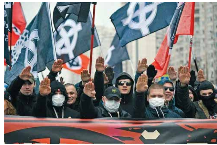
Una manifestazione nel centro di Mosca di uno dei gruppi neonazisti presenti in Russia

L'estrema destra russa, oltre che nel nazismo tedesco, trova le proprie radici nei reazionari antibolscevichi emigrati dopo la rivoluzione del 1917, all'interno dei cui ambienti sono nate correnti esplicitamente fasciste. E' il caso per esempio di Ivan Ilyin, teorico del fascismo russo esplicitamente apprezzato da Putin, che ha fatto riesumare la sua salma sepolta in Svizzera per risepellirla in Russia, dove poi il presidente russo ha reso pubblicamente omaggio alla sua tomba. Il movimento neonazista russo "di strada" si è invece sviluppato in modo autonomo dopo il crollo dell'Unione Sovietica. Tra i tanti gruppi di questa vasta galassia, vanno citati in particolare Ruskoje Natsionalnoe Edinstvo (RNE, ovvero Unità Nazionale Russa), Russky Obraz (Immagine Russa) con la sua