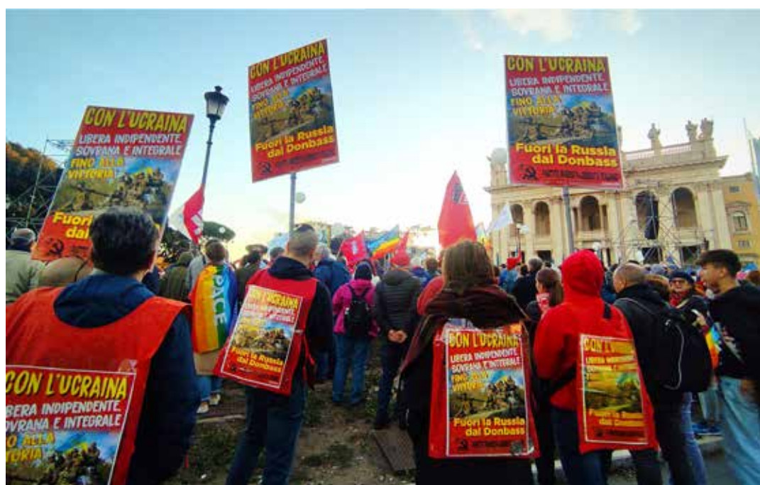
Roma, 5 novembre 2022. Il PMLI tiene alti i manifesti a sostegno della vittoria dell'Ucraina durante la manifestazione nazionale per la pace

Questo importante documento antimperialista e internazionalista proletario dell'Ufficio politico del PMLI è stato approvato dal Comitato centrale del Partito.