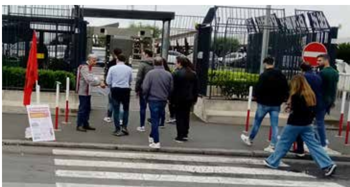
Catania, 6 giugno 2023. La diffusione da parte dei compagni della Cellula "Stalin" della provincia di Catania del PMLI del volantino con l'analisi del voto alle comunali catanesi alla STMicroelectronics. Sulla sinistra si nota il Bolscevico n. 23 grandezza manifesto

ricchi e agiati a discapito degli strati poveri sempre più poveri.