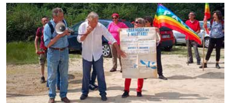
Un momento degli interventi a conclusione dell'iniziativa. Sulla destra il manifesto che già nel 1984 invitava a protestare contro la servitù militare

È stata notevole la presenza di ragazze e ragazzi sensibili alle tematiche ecologiste, che sono intervenuti per sostenere la preservazione e la valorizzazione degli spazi naturali. Gli eco-