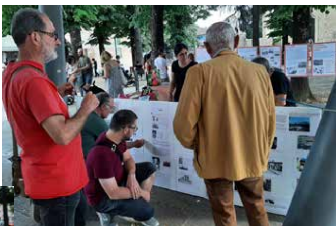
Firenze, 10 giugno 2023. Momenti della bella giornata antifascista che si è svolta nella storica piazza dell'Isolotto