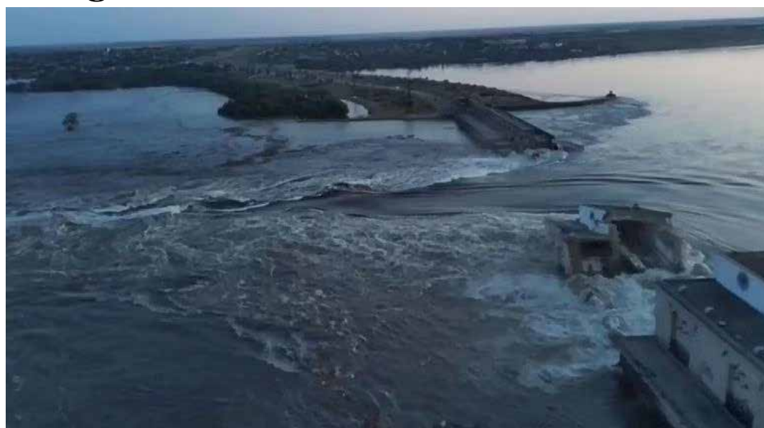
Una immagine del grande disastro causato dalla distruzione da parte dei russi della diga della centrale elettrica di Kakhovskaya

Per Zelensky "La distruzione della diga della centrale idroelettrica di Kakhovka è opera dei terroristi russi e conferma al mondo intero che devono essere espulsi da ogni angolo del territorio ucraino. A loro non dovrebbe essere lasciato un solo metro, perché usano ogni metro per il terrore. Solo la vittoria dell'Ucraina restituirà la sicurezza. E questa vittoria arriverà. I terroristi non potranno fermare l'Ucraina con acqua, missili o altro". Per il ministro degli Esteri ucraino Kuleba "La Russia ha distrutto la diga di Kakhovka infliggendo probabilmente il più grande disastro tecnologico europeo degli ultimi decenni e mettendo a rischio migliaia di civili. Questo è un atroce crimine di guerra. L'unico modo per fermare la Russia, il più grande terrorista del 21° secolo, è cacciarla dall'Ucraina". Men-