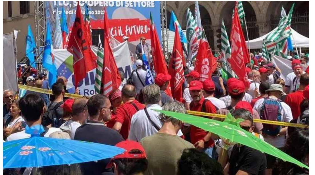
Roma, 6 giugno 2023. Comizi al termine della manifestazione per lo sciopero delle telecomunicazioni

Quasi tutte registrano delle perdite, che puntualmente le aziende cercano di recuperare sulle spalle dei lavoratori,