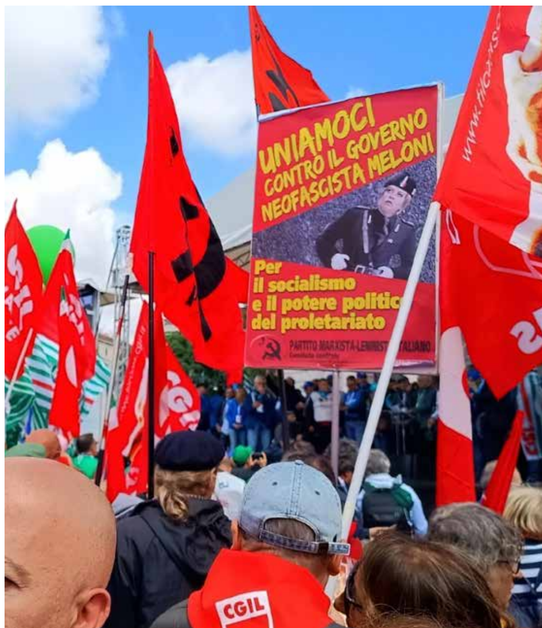
Milano, 13 maggio 2023. Manifestazione sindacale contro la macelleria sociale. Il PMLI tiene alto il manifesto con la parola d'ordine contro il governo neofascista Meloni

Ecco la fine che fanno i rinnegati dello stampo di Violante: dalla riabilitazione degli assassini e torturatori repubblicani alla corte della neofascista Meloni, che con nuove forme e sotto nuove insegne ha riportato il fascismo mussoliniano al potere a 80 anni dalla sua caduta.