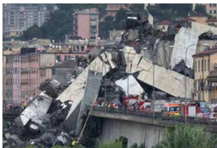
Genova. Una impressionante immagine del tragico crollo della pila 9 del ponte Morandi avvenuta il 14 agosto 2018 che ha provocato 43 morti

Nel suo intervento, Mion ha ricostruito anche i rapporti tra Autostrade per l'Italia (in