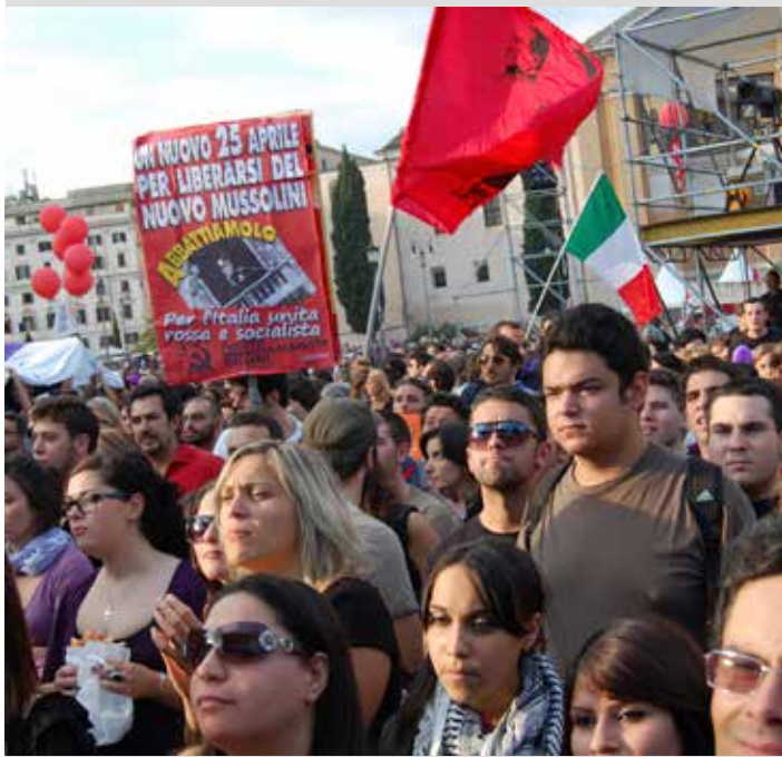
Roma, 2 ottobre 2010. No B Day, manifestazione nazionale per cacciare il governo Berlusconi

L'Ufficio stampa del PMLI Firenze, 13 giugno 2023