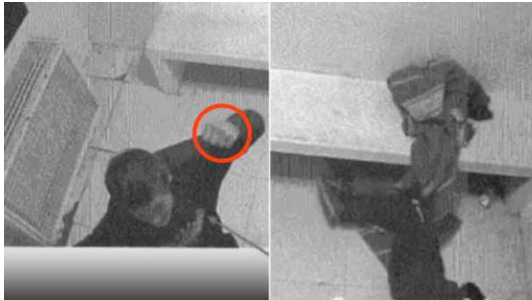
Fotogrammi tratti dalle riprese fatte con le telecamere interne sul trattamento violento fatto ai migranti fermati dai poliziotti inquisiti. Si vede un poliziotto intento a colpire con un pugno e uno dei fermati disteso in terra. Le riprese video sono varie e testimoniano vari atti di violenza e tortura

Nelle 169 pagine dell'ordinanza del Giudice per le indagini preliminari del Tribunale di Verona che ha disposto le mi-