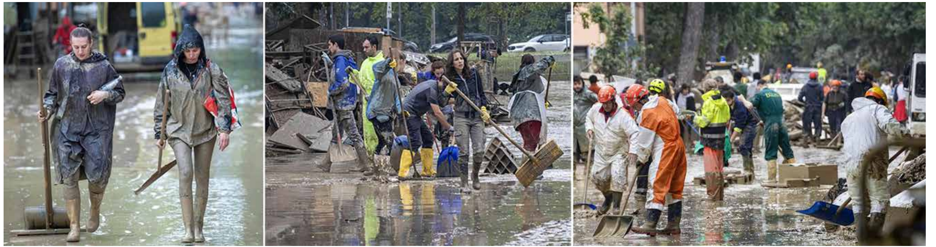
Alluvione in Emilia-Romagna. Immagini dei giovani e dei volontari al lavoro per spalare il fango e aiutare le persone e le famiglie colpite dall'esonazione dei fiumi

Per questo il governo ha momentaneamente istituito un "tavolo operativo permanente" per gestire l'emergenza coordinato dal ministro per la Protezione civile Nello Musumeci (camerata della premier), decisione che sarebbe stata presa dall'aspirante duce Meloni e mal digerita anche all'interno della nera maggioranza, in particolare dal vicepremier e ministro delle Infrastrutture e dei trasporti Salvini, come raccontato da "Repubblica" in un report su un incontro