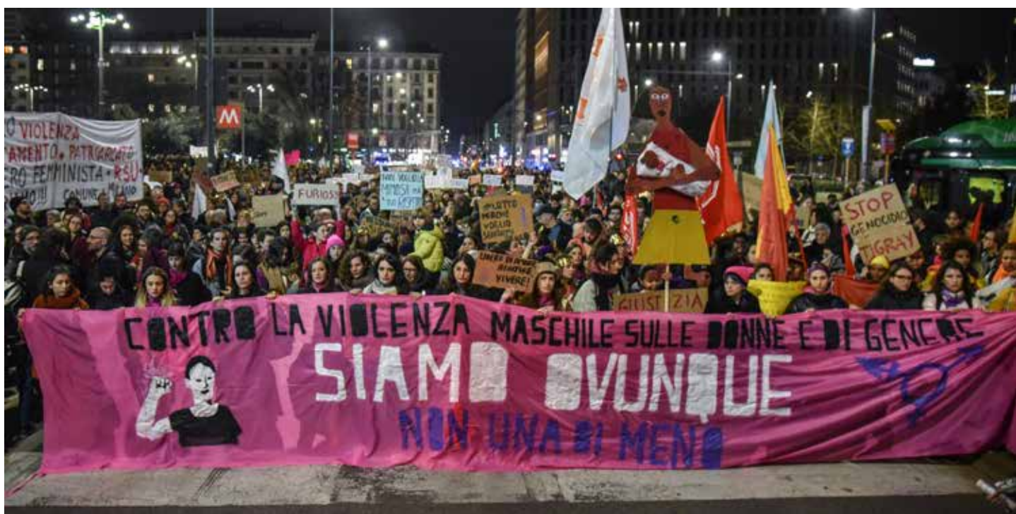
Milano, 8 Marzo 2023. Manifestazione per la giornata internazionale delle donne

11. Provvisoria a titolo di ristoro anticipato a favore delle vittime. Le vittime di violenza, o i loro eredi in caso di morte, riceveranno un risarcimento 'anticipato' in caso di delitti gravi commessi da coniugi o da persone legate da una relazione affettiva. Questa misura è pensata per coloro che si trovano in stato di bisogno a causa del reato, superando l'attuale limite dell'ac-