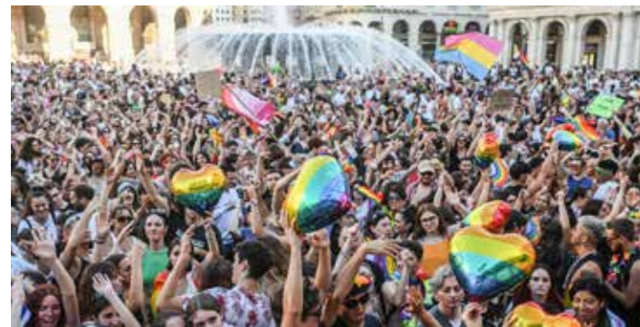
Genova, 10 giugno 2023. Il Liguria Pride 2023 in piazza de Ferrari