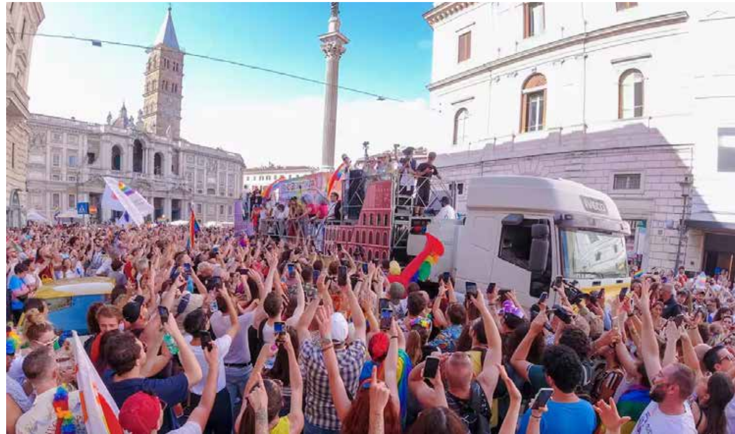
Roma, 10 giugno. Il Pride 2023

Primo Pride romano dall'avvento del governo neofascista Meloni e dall'elezione a governatore della Regione Lazio di Francesco Rocca, voluto dalla Meloni e sostenuto da tutta la coalizione di destra in quella che è stata la tornata elettorale