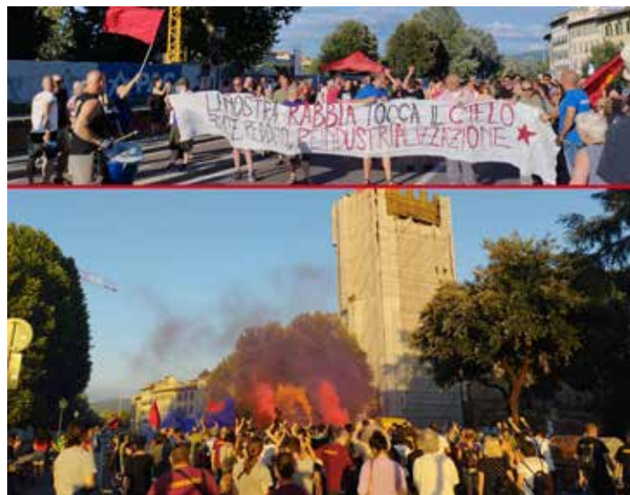
Firenze, 2 luglio 2023. Il corteo degli operai GKN verso la torre di San Niccolò poi la manifestazione raccolta sotto la torre a sostegno degli operai che l'hanno occupata

Il 2 luglio centinaia di lavoratori e solidali si sono riuniti in assemblea in piazza Poggi, sotto la torre, per sostenere la protesta e denunciare: "Non ci arrivano soldi della cassa integrazione che era stata approvata il 15 maggio. I flussi di cassa che l'azienda dovrebbe mandare all'Inps non sono stati forniti, tranne che per novembre e dicembre. Il nuovo padrone di Qf Francesco Borgomeo continua a mettere sotto ricatto i lavoratori per costringerli a licenziarsi.