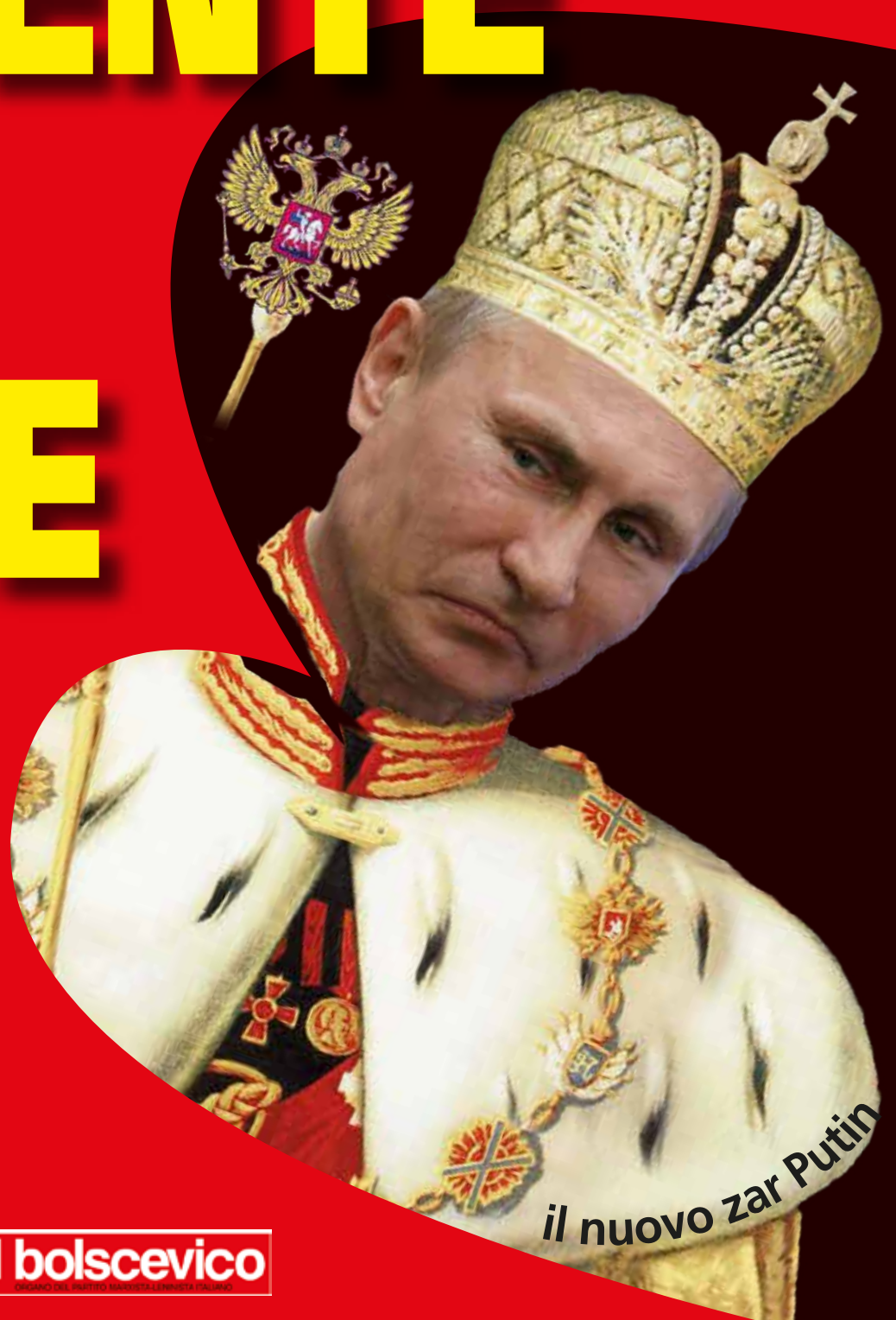
il nuovo zar Putin

Sede centrale: Via Antonio del Pollaiuolo, 172a 50142 FIRENZE Tel. e fax 055.5123164 e-mail: commissioni@pml.i.it • www.pml.i.it • www.facebook.com/PartitoMarxistaLeninistaItalianoPMLI