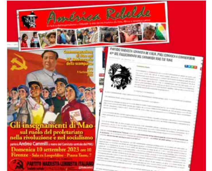
Dal sito di "America Rebelde" l'articolo redatto da Erne Guidi per presentare la commemorazione di Mao nel 47° anniversario della morte

Mao ha imparato tanto bene la lezione presa dai grandi maestri del proletariato internazionale Marx, Engels, Lenin e Stalin che, attraverso una straordinaria, lunga e complessa esperienza rivo-