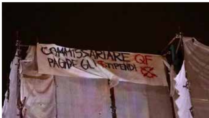
Firenze. Lo striscione con le rivendicazioni della GKN attaccato in cima alla Torre di San Niccolò

Il Comitato provinciale di Firenze del Partito marxista-leninista italiano esprime il proprio appoggio militante all'occupazione di Torre San Niccolò a Firenze da parte degli operai ex-GKN. Questo è l'ennesimo atto di una mobilitazione che ha già segnato la storia del movimento operaio del nostro Paese per l'audacia, la convinzione, la compattezza e l'alto spessore politico del suo Collettivo di Fabbrica.