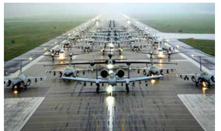
AIR Defender 2023. Lo schieramento di presentazione dei mezzi della più grande e recente esercitazione congiunta Nato in Europa avvenuta il 23 giugno scorso

Non è bastata invece ai leader dei Ventisette la lunga discussione che si è protratta fino all'1 e 15 circa della notte del 30 giugno, ben al di là del previsto, per adottare il paragrafo delle conclusioni dedicato all'immigrazione. Nonostante la richiesta del presidente del Consiglio