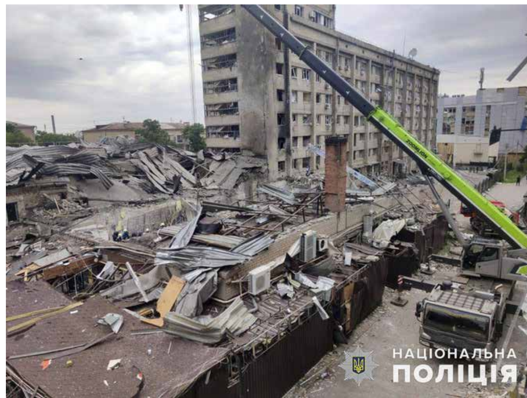
Le macerie del Ria ristorante di Kramatorsk distrutto da un missile russo il 28 giugno 2023

"La nostra posizione è chiara e l'abbiamo espressa in modo molto aperto: non abbiamo bisogno di alcuna mediazione, e questo perché abbiamo avuto cattive esperienze. Non ci fidiamo della Russia". Lo ha detto invece il 27 giugno il capo dell'ufficio del presidente ucraino, Andriy Yermak, a proposito dell'annunciata visita a Mosca dell'inviato di pace del papa, cardinale Matteo Zuppi, aggiungendo tuttavia che se dovesse ottenere risultati sui problemi dei bambini deportati in Russia e sulla scambio dei prigionieri, questi risultati sarebbero benvenuti.