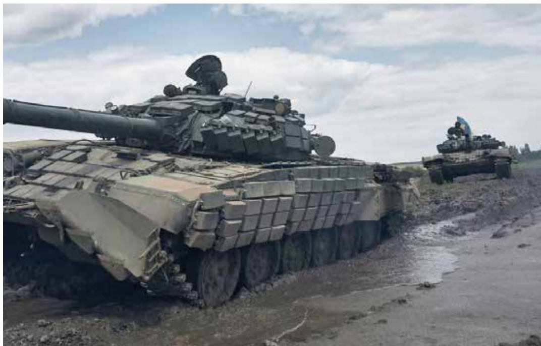
Carri armati ucraini durante la controffensiva vicino Bakhmut

"Il Vaticano - ha affermato il capo della Chiesa greco-cattolica in Ucraina, Arcivescovo maggiore di Kyiv-Halyč e arcieparca metropolitana di Kiev, - non si schiera mai da una, o dall'altra parte del conflitto, cercando di starne al di sopra. Questo serve per non perdere l'occasione di dialogare con entrambe le parti. Certo, questo fatto a noi è sembrato un po' strano, magari ci faceva male. Avremmo voluto che il papa si schierasse inequivocabilmente dalla parte dell'Ucraina, anche a livello diplomatico e politico, condannando per nome i rappresentanti dell'aggressore. Avremmo voluto che dicesse chiaramente chi era l'aggressore e chi la vittima. In condizioni di guerra è molto importante chiamare tutto con il proprio nome. Cioè, l'aggressore è aggressore, il criminale è criminale, la vittima è vittima. Per noi oggi è evidente che i russi vengono in Ucraina per uccidere o essere uccisi. Dunque, chi sono? Sono dei criminali. Davanti ai nostri occhi avvengono gravissimi crimini di guerra contro la popolazione civile. Abbiamo accennato all'inaccettabile crimine di guerra contro l'ambiente, l'ecocidio. Quindi, questo tipo di azioni dell'apparato statale russo rientra in tutti i criteri usati per i criminali di guerra. E siamo molto soddisfatti che la comunità internazionale abbia già istituito un tribunale ad hoc per esaminare i crimini di guerra commessi dalla Russia. Pertanto, la giustizia deve trionfare".