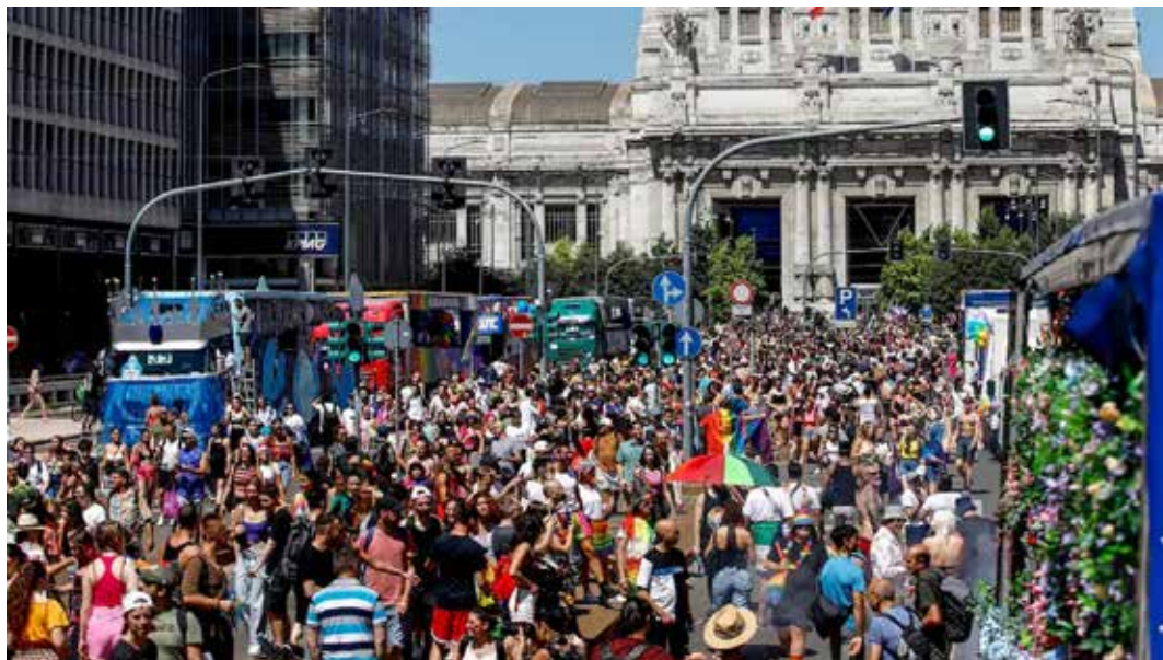
Milano, 24 giugno 2023. Il Corteo per il Gay Pride 2023

I marxisti-leninisti incoraggiano il movimento LGBTQIA+* a continuare la sua battaglia fino in fondo, cioè fino a quando tutte le sue rivendicazioni non saranno state realizzate e alle coppie omosessuali saranno riconosciuti gli stessi diritti delle coppie eterosessuali, non uno di meno. La fine delle discriminazioni e la parità di diritti si inserisce nella lotta generale e strategica contro il capitalismo, per il socialismo.