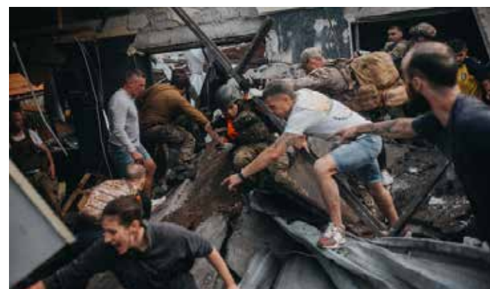
Kramatorsk. Volontari cercano di portare in salvo le vittime dell'attacco russo sul ristorante

Il 29 giugno il ministro degli Esteri ucraino Kuleba intervenendo a Otto e mezzo su La7 ha dichiarato: "Senza la Wagner sarà più facile per il nostro esercito. Putin si è indebolito a seguito dell'ammutinamento di Prigozhin. Ma l'aspetto principale del golpe fallito è che il mito e la leggenda del Putin forte e invincibile è finito. Ha trovato un accordo con Prigozhin, non lo ha eliminato, è giunto a un compromesso. In questo momento Putin si sente vulnerabile e molti russi se ne sono resi conto. Questa vicenda non è la fine della guerra ma apre una nuova fase del conflitto". E vogliamo ricordare che il gopista capo della Wagner Prigozhin aveva smascherato platealmente con queste parole Putin e le sue menzogne che costui continua a ripetere per giustificare l'aggressione e l'invasione della Ucraina: "Il ministero della Difesa sta cercando di ingannare l'opinione pubblica e il presidente e di far girare la storia secondo cui ci sarebbero stati livelli folli di aggressione da parte ucraina e che ci avrebbero attaccato insieme all'intero blocco NATO. Pertanto, la cosiddetta operazione speciale del 24 febbraio è stata avviata per altri motivi. La guerra è stata necessaria a un gruppo di bastardi per trionfare e promuoversi, dimostrando quanto fosse forte l'esercito tanto che Shoigu (il ministro della Difesa russo, ndr) ha ricevuto il grado