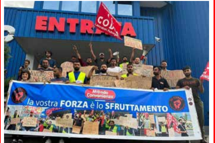
Campi Bisenzio (Firenze). I lavoratori della logistica di Mondo Convenienza durante le lotte dei giorni scorsi

Il PMLI e la Cellula "G. Stalin" di Prato sono attivamente schierati al fianco dei lavoratori in lotta nel chiedere la fine immediata della repressione poliziesca e quotidiana contro i lavoratori in presidio permanente davanti ai cancelli del magazzino di Mondo Convenienza in Via Gattinella, l'immediata riapertura del tavolo di trattative in Regione e l'accettazione da parte di Mondo Convenienza di tutte le rivendicazioni dei lavoratori.