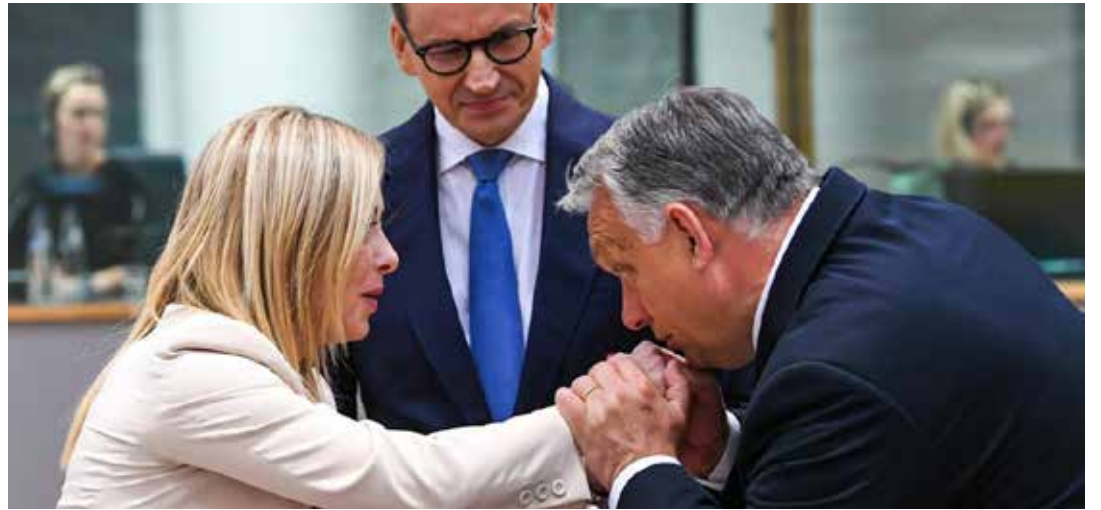
Bruxelles, 29 giugno 2023. La premier neofascista Meloni omaggiata dal primo ministro ungherese Orban e, appena dietro, da Mateusz Morawiecki, suo omologo polacco

lavorando), l'Europa ha un problema di energia, di fonti, l'Africa è forse un grande produttore di energia. Possiamo mettere insieme le cose, possiamo cercare di aiutarli con investimenti, producendo energia per loro stessi ma anche per aiutarci, e legarci a vicenda". Parlando con i giornalisti, la premier neofascista ha detto che "l'Italia ha avuto un ruolo da protagonista" nel vertice di Bruxelles.