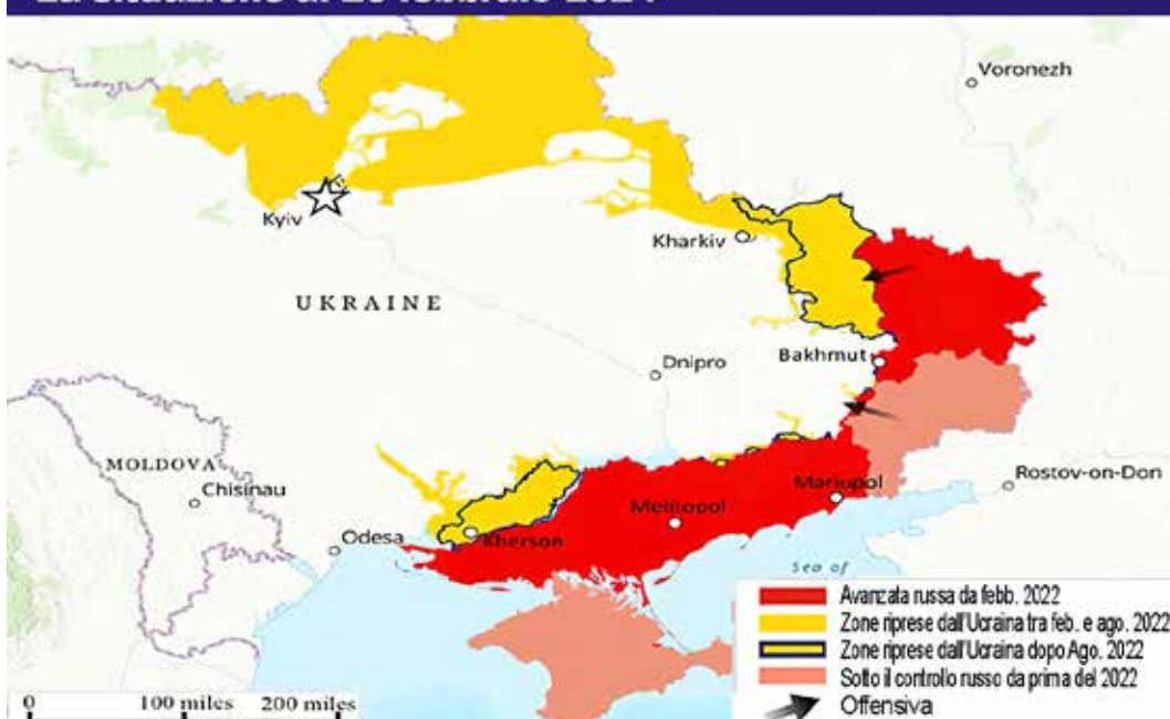
La situazione al 20 febbraio 2024

fu proprio il socialismo, quello vero, a portare anche l'Ucraina, nell'ambito dell'Urss di Lenin e Stalin, dall'aratro alla bomba atomica, facendola diventare, insieme alle Repubbliche unite nell'Urss (il cui scioglimento nel 1991 fu illegale) una grande potenza economica, politica e militare, nonostante l'isolamento internazionale ed enormi difficoltà di ogni ordine e grado.