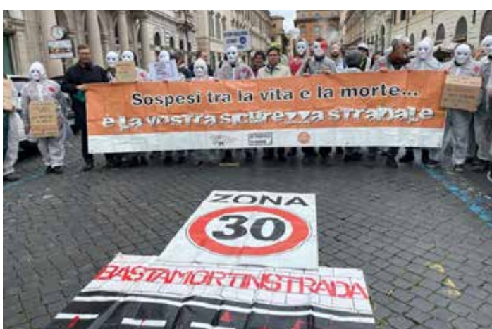
Roma, 10 marzo 2024. Manifestazione di protesta contro il nuovo codice della strada contro l'obbligo dei 30 km orari

In particolare, la riforma renderebbe i controlli più difficili per velocità, sosta abusiva e guida distratta, limiterebbe la possibilità per i comuni di installare e usare gli autovelox fissi, mobili e in movimento per far rispettare i limiti di velocità, ed eliminerebbe la possibilità di controllare e sanzionare con telecamere e senza contestazione immediata le infrazioni in materia di sosta e di segnale-