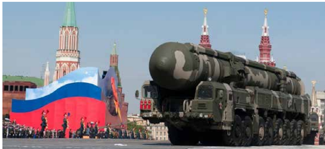
Mosca. Un missile nucleare russo fotografato durante una parata militare sulla Piazza Rossa

Nella stessa giornata Mosca ha usato toni decisamente più accondiscendenti rivolgendosi a Papa Francesco, al quale Putin ha inviato un messaggio di auguri per l'undicesimo anniversario dell'elezione al soglio pontificio. Nel renderlo noto, l'ambasciata presso la Santa Sede ha definito "un vero e onesto difensore della pace" il Pontefice, che in un'intervista alla televisione svizzera aveva invitato Kiev alla resa incondizionata all'aggressore russo, ad avere "il coraggio della bandiera bianca" per avviare negoziati. Il Papa, ha aggiunto la sede diplomatica russa, è "uno dei pochi leader con una visione strategica onesta dei problemi mondiali".