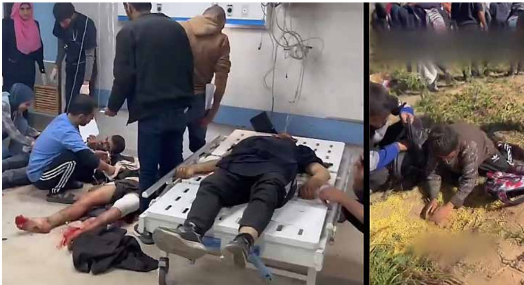
Fotogrammi da un filmato pubblicato dall'emittente al Jazeera. Alcune persone ricoverate colpite dai nazionisti mentre cercavano del cibo e dei bambini cercano di recuperare del cibo da terra

In merito ai rapporti con le organizzazioni umanitarie che assistevano i palestinesi possiamo registrare lo zelo dell'imperialismo italiano che col ministro degli Esteri Antonio Tajani si è immediatamente allineato agli ordini di Tel Aviv, avallata dalla neofascista Meloni, di tagliare ogni sussidio alla popolazione dopo l'attacco della Resistenza palestinese del 7 ottobre scorso e ha bloccato i fondi già stanziati alle agenzie umanitarie, persino a quelle sotto il controllo della Farnesina. Non ha tagliato invece la fornitura di materiale bellico, come denunciato dalla recente inchiesta di Altreconomia, e ha lanciato l'11 marzo l'iniziativa tutta propagandistica "Food for Gaza" (Cibo per Gaza) mentre ai militari lasciava il compito degli aiuti paracadutati sotto il cappello dell'operazione