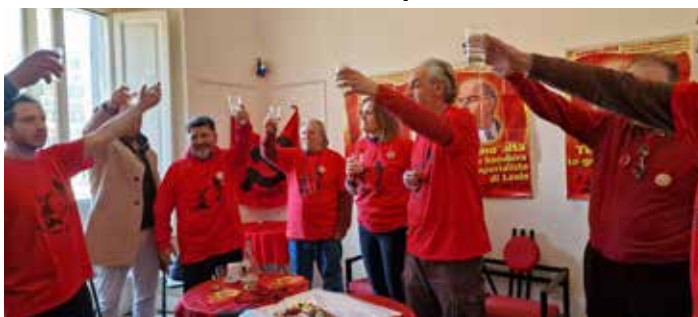
21 gennaio 2024. Il brindisi a Lenin e il canto dell'Internazionale al termine della Commemorazione tenutasi a Napoli per il Centenario della scomparsa del grande Maestro del proletariato internazionale

assistiamo ad una terza guerra mondiale "soft" (per modo di dire) punteggiata da una serie di conflitti locali dentro e fuori l'Europa, perdurante dal collasso del socialcomunismo gorbacioviano (più di trent'anni fa!) e senza che nessuno o quasi sappia cavare un ragno dal buco.