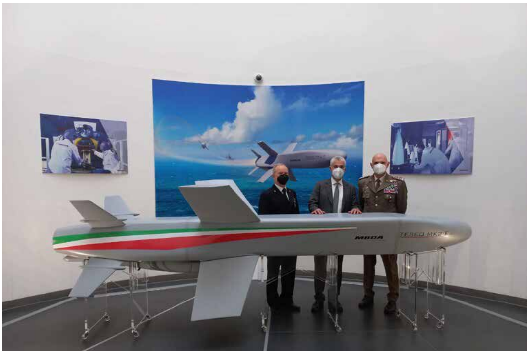
La presentazione di un nuovo missile antinave prodotto dalla MBDA, gruppo europeo leader mondiale della missilistica, a cui è interessata la Marina militare

li del mondo intero, unitevi contro tutte le guerre di aggressione messe in campo dagli imperialisti e dai socialimperialisti, specie le guerre di aggressione con la bomba atomica. Qualora dovesse verificarsi questo tipo di guerra, i popoli del mondo intero dovranno sconfiggere la guerra di aggressione con la guerra rivoluzionaria, e devono prepararsi fin da subito in qualche misura."