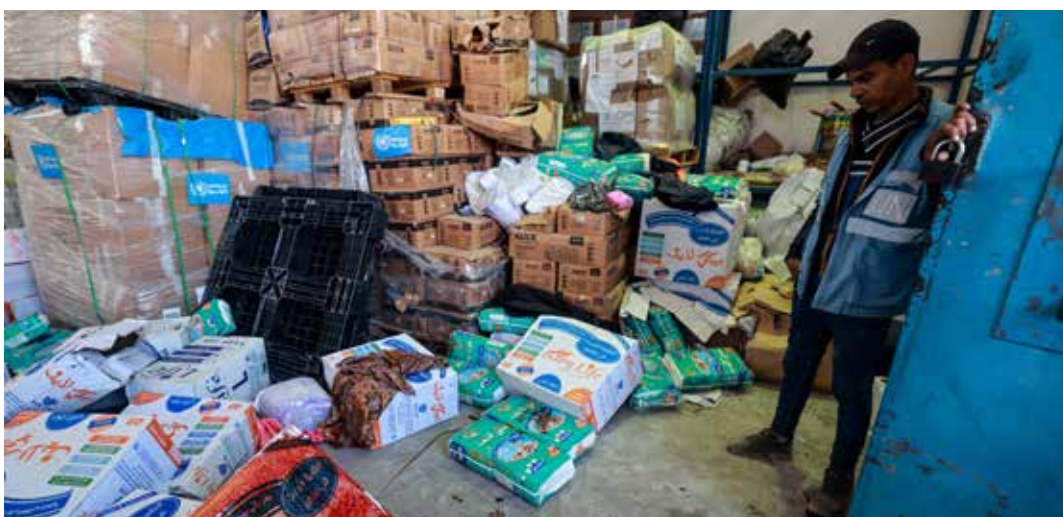
Un operatore mostra il sangue dei feriti dall'attacco israeliano che lavoravano in questo deposito delle Nazioni Unite con generi di prima necessità. Un capo del deposito dell'Onu è morto e altri quattro sono rimasti feriti

"Levante". Una moltiplicazione di attività che potrebbe fare la fine della famosa nave ospedale militare promessa dalla Farnesina ma mai arrivata nelle acque di Gaza, quando per queste cose basterebbe costringere i nazionisti a togliere il blocco alle lunghe code dei camion carichi di aiuti fuori della striscia di Gaza.