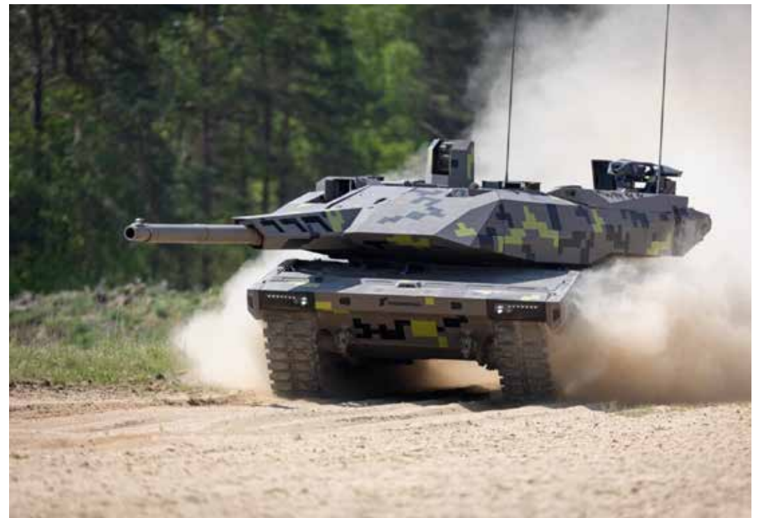
Il carro armato KF51- Panther di nuova generazione che sarà prodotto dalla tedesca Rheinmetall in associazione con l'industria bellica ungherese. Al carro è interessato anche l'esercito italiano

I progressi fatti finora nel campo della Difesa, ha ribadito la Von der Leyen "dimostrano che l'Europa ha iniziato a comprendere l'urgenza e la portata della sfida che ci aspetta. Ma c'è molto altro da fare. E dobbiamo muoverci