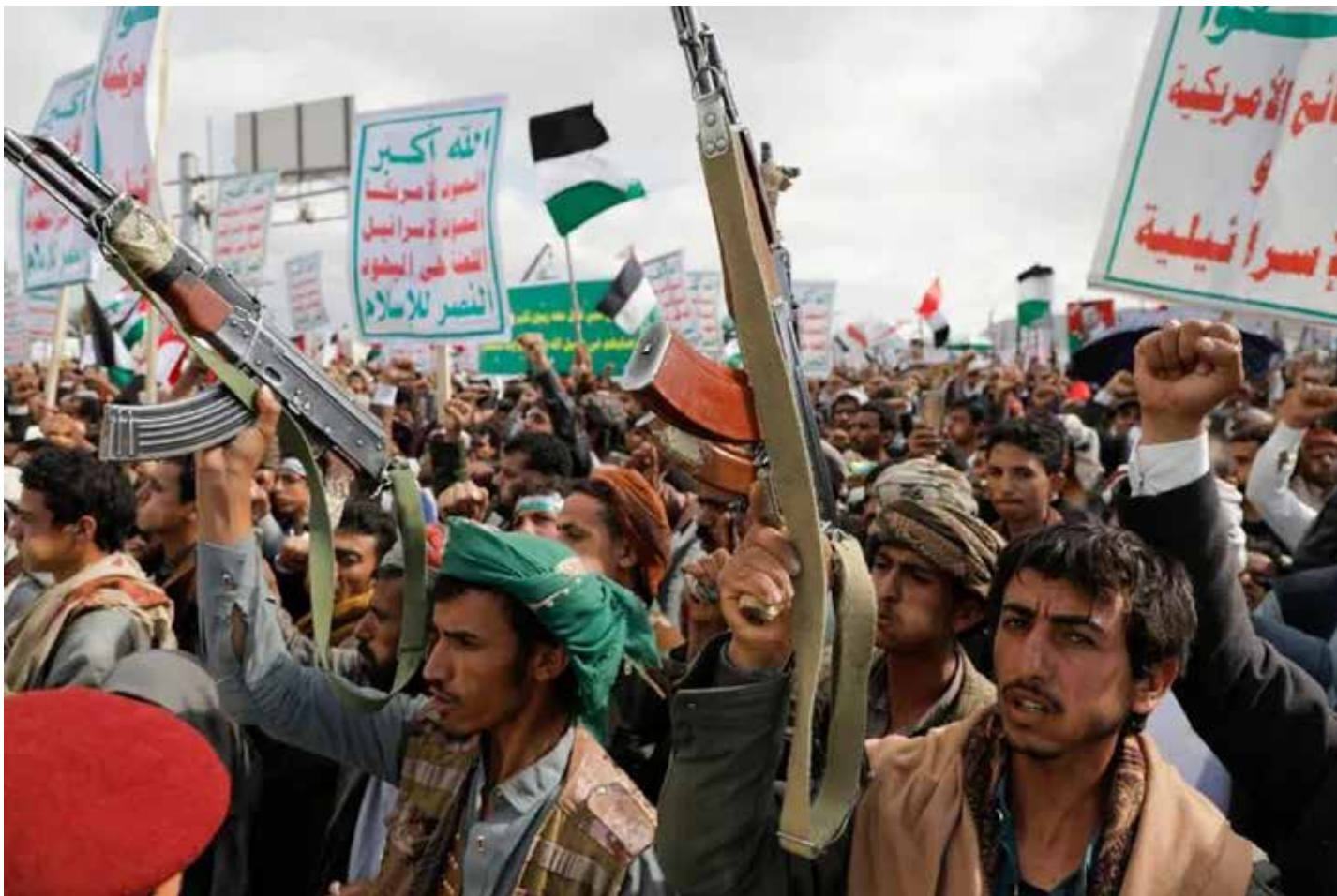
Sana'a (Yemen), 15 marzo 2024. Un aspetto della grande manifestazione Houthi a sostegno della lotta del popolo palestinese

In ogni caso, parlando di dati di fatto, uno di essi è anche l'evidenza secondo la quale il boicottaggio armato degli Houthi yemeniti - che fra l'altro escono da una guerra civile di 8 anni dove è intervenuta l'Arabia Saudita e dove hanno fatto vittime anche le bombe italiane - non c'era prima dell'invasione nazisionista di Israele a Gaza. Ciò dimostra oltre ogni ragionevole dubbio, e indotto che sia, qual è la reale cau-