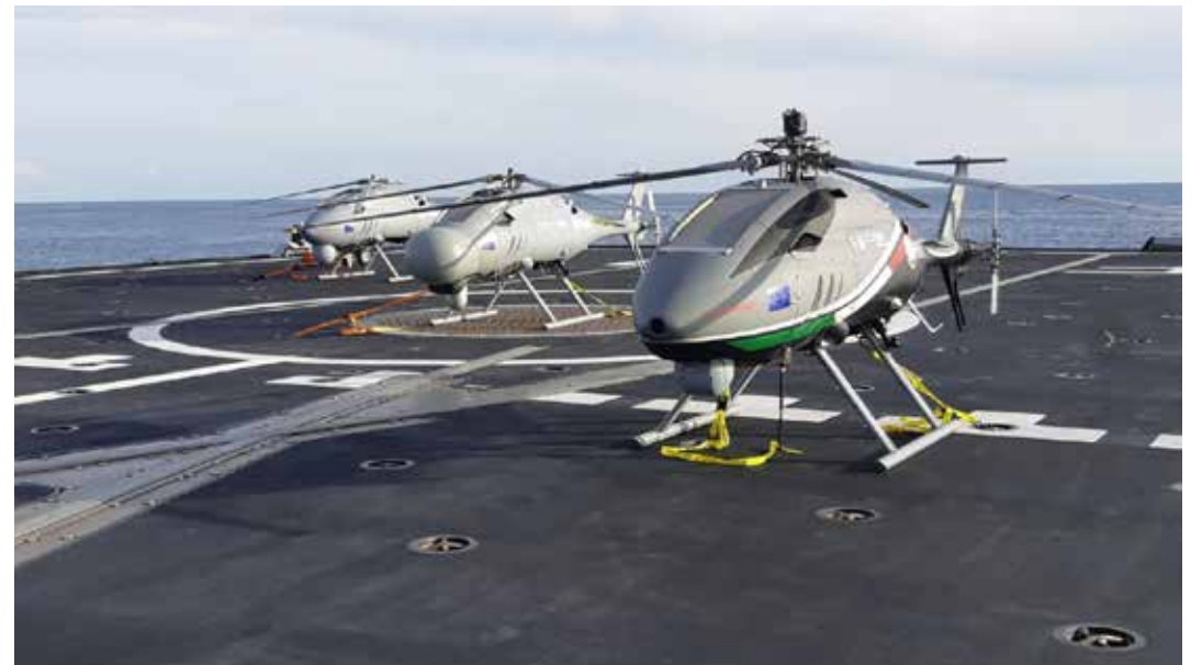
Tre droni elicotteri imbarcati su una nave della Marina militare a scopo dimostrativo. Sono prodotti dal gruppo Leonardo. Il gruppo ha ricevuto circa 41 milioni di euro (un primato a livello europeo) da investire nello sviluppo e nella produzione bellica

velocemente. La minaccia di guerra potrebbe non essere imminente, ma non è impossibile. I rischi di una guerra non dovrebbero essere esagerati, ma bisogna prepararsi. E tutto ciò inizia con l'urgente necessità di ricostruire, rifornire e modernizzare le forze armate degli Stati membri. L'Europa dovrebbe sforzarsi di sviluppare e produrre la prossima generazione di capacità operative vincenti. E di garantire che dispon-