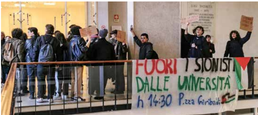
Napoli, 15 marzo 2024. La contestazione delle studentesse e degli studenti contro il dibattito organizzato dal rettore e l'intervento del direttore di Repubblica Molinari

A soccorrere Molinari è intervenuto addirittura il presidente della Repubblica Sergio Mattarella che ha telefonato al direttore sionista per esprimergli solidarietà e poi far diffondere una nota di condanna della protesta studentesca: "Quel che vi è da bandire dalle Università è l'intolleranza, perché con l'Università è incompatibile chi pretende di imporre le proprie idee impedendo che possa manifestarle chi la pensa diversamente". E pensare che l'evento filo-sionista era stato imposto dagli alti vertici baronali senza che gli universitari venissero in alcun modo in-