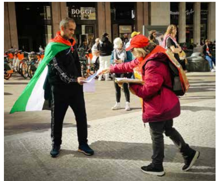
Un momento della diffusione del volantino del PMLI con gli ultimi articoli aggiornati sulla situazione a Gaza

Negli interventi dei rappresentanti delle organizzazioni studentesche (CR e OSA) è stata espressa ferma intenzione di proseguire la mobilitazione nelle università italiane per recidere ogni collaborazione di queste ultime con quelle israeliane e per promuovere una più generale protesta per fermare l'invio di armi italiane all'esercito israeliano e contro la missione di guerra Aspi-