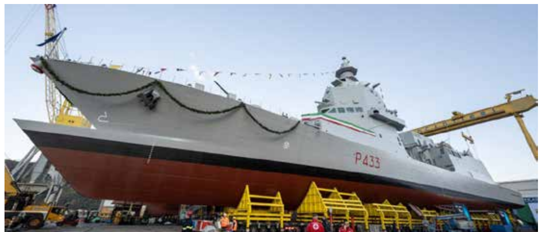
Un pattugliatore di altura per la Marina militare prodotto dal gruppo Fincantieri