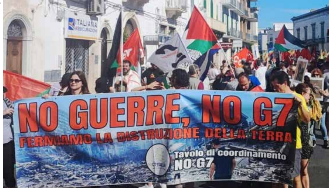
Fasano (Brindisi), 15 giugno 2024. L'apertura della manifestazione contro il G7 che si è tenuto dal 13 al 15 giugno in un resort in provincia di Brindisi

Nella lunghissima e onnicomprensiva dichiarazione finale del vertice ci sono temi importanti messi in agenda dalla presidenza italiana contro il parere in alcuni casi dei partner e che invece sembrano quasi gli unici argomenti di dibattito e spiccano per la campagna costruita sopra dalla neofascista Meloni. I cui sherpa addetti alla stesura dei documenti alla voce "Promozione delle partnership con i paesi africani" e in altri passaggi incassano la formulazione "accogliamo positivamente il piano Mattei per l'Africa lanciato dall'Italia" visto come parte del "Partenariato del G7 per le infrastrutture e gli investimenti globali (PGII) e di iniziative come l'EU Global Gateway". L'obiettivo sarebbe quello di rafforzare "le collaborazioni mutualmente benefiche