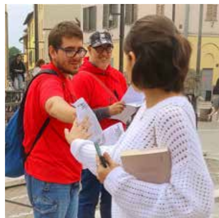
Milano, 15 giugno 2024. Un momento della diffusione organizzata in piazza Costantino dei volantini con l'articolo de "Il Bolscevico" con l'analisi del voto alle europee

Conclusasi la riunione i compagni si sono quindi spo-