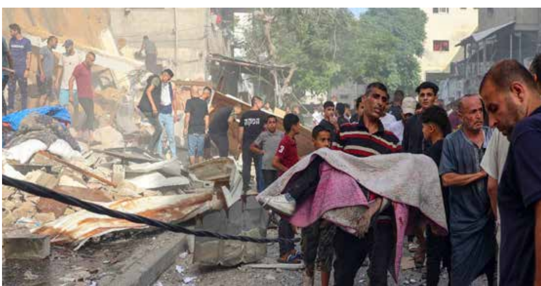
Giugno 2024. Il recupero delle vittime della strage dell'ennesimo attacco nazionista su Gaza

"Con 14 voti favorevoli e l'astensione della Federazione Russa, il Consiglio di Sicurezza ha adottato questo pomeriggio la risoluzione 2735 (2024) proposta dagli Stati Uniti e con la quale le parti in conflitto, Israele e Hamas sono invitate a seguire un percorso in tre fasi nel piano di pace che garantisce la cessazione delle ostilità, il ritorno degli ostaggi e infine la ricostruzione di Gaza, mantenendo viva la visione della soluzione a due Stati", recitava il comunicato che spiegava come "con questo testo il Consiglio accoglie con favore la nuova proposta di cessate il fuoco annunciata il 31 maggio, 'che Israele ha accettato' ma se l'aveva preparata assieme agli Usa come ha detto Biden non si capisce cosa ha accettato e tuttavia continua a negar-