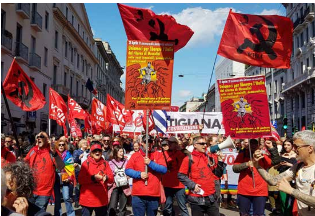
Milano, 25 Aprile 2024. Manifestazione nazionale per il 79° Anniversario della Liberazione dal nazifascismo. In primo piano i manifesti per unirsi contro il governo della duchessa Meloni portati in piazza dalla Delegazione nazionale del PMLI

Come in altri casi simili la premier neofascista non ha voluto commentare a caldo i fatti gravissimi della Camera, lasciando il compito ai suoi tirapiedi e alleati di minimizza-