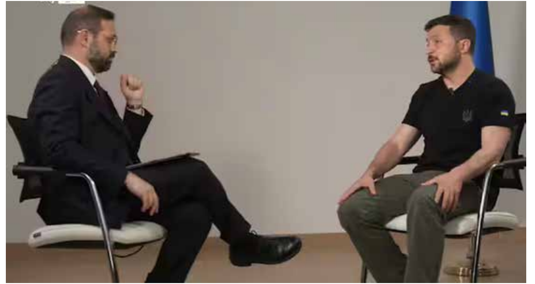
Zelensky intervistato da Sky Tg24

"I nostri militari sono bravi perché loro riescono a sostenere questi attacchi, sono fiero di loro... La Russia utilizza al mese 3.500 missili. E per noi è un grande problema perché questi li utilizzano solo sui civili, sulle infrastrutture civili. È importante che le persone capiscano che quando loro colpiscono con i droni e con i missili dicono che sono degli obiettivi militari, non è vero.