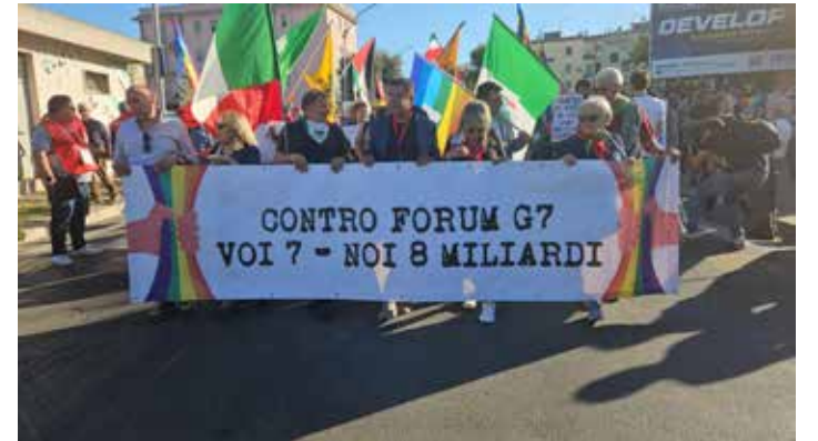
Un altro momento della manifestazione contro il G7, conclusasi a Fasano con diverse iniziative

e del Sud del mondo che ovviamente sono intoccabili. Meglio puntare a mettere in pratica, questo sì, "il diritto sovrano degli Stati a controllare i propri confini" e alzare muri come quello negli Usa verso i flussi dal Messico o come in Italia togliere di mezzo le Ong dal Mediterraneo e lasciar annegare i migranti in mare.