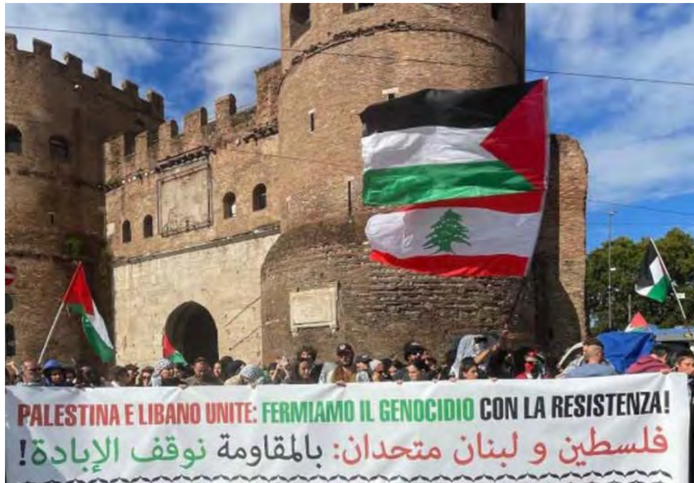
Roma 5 ottobre 2024. Il grande striscione dei palestinesi che ha aperto la manifestazione con le bandiere della Palestina e del Libano

Le nostre rivendicazioni puntano alla radice della questione: il problema non è riducibile a Netanyahu, è il sistema di occupazione coloniale ad essere sotto accusa, e per fermare questo sistema bisogna inceppare la macchina bellica, dalla progettazione delle armi alla loro commercializzazione. È per questo che sabato siamo scesi in piazza per la Palesti-