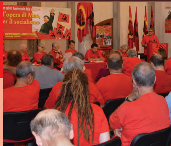
8 settembre 2024. Un momento della 48ª Commemorazione di Mao svoltasi a Firenze

Con amore eterno, i vostri compagni dalla Cina!