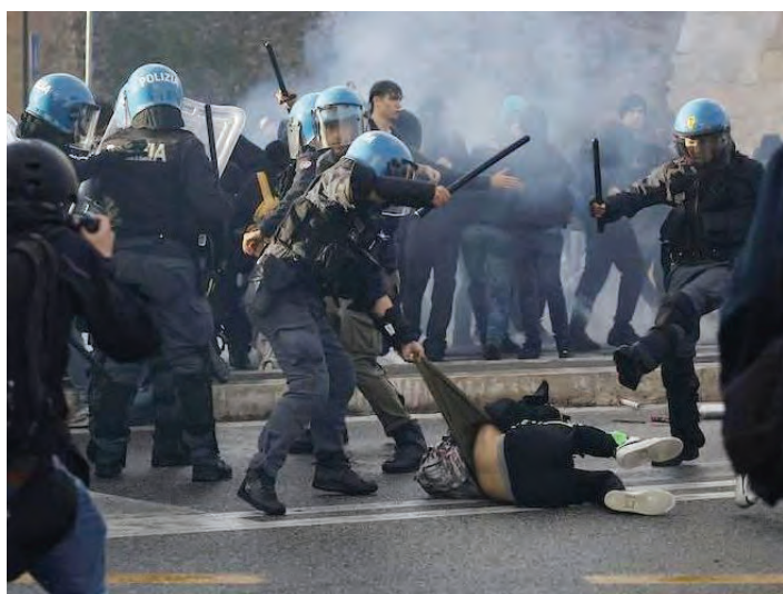
Roma, 5 ottobre 2024. Le cariche delle "forze dell'ordine" contro i manifestanti antisionisti e sostenitori del popolo palestinese

"L'idea di Herzl che per battere il nazionalismo nazista servisse un nazionalismo sionista è folle. Non a caso il sionismo nasce in Europa: non sarebbe mai venuto in mente agli ebrei del mondo arabo perché lì la convivenza era nei fatti. L'antisemitismo dilaga dalla sovrapposizione tra identità ebraica e Israele. L'unica luce oggi arriva dai giovani ebrei che, specie in America, iniziano a rifiutare quell'equivalenza".