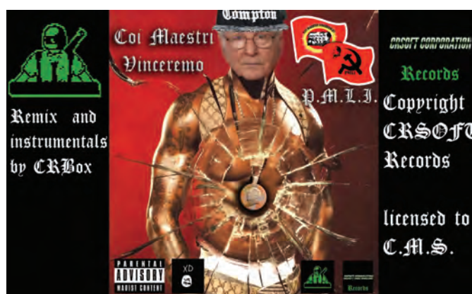
La cover del video realizzato da CRSOFT CORPORATION

Grazie mille ai compagni siciliani per questo servizio reso al PMLI.