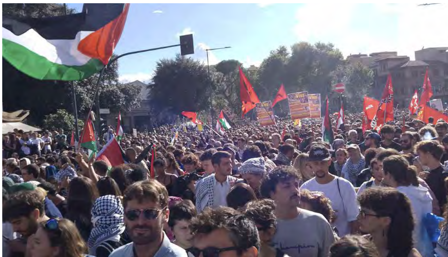
Roma, 5 ottobre 2024. Una veduta della manifestazione nazionale per la Palestina e contro l'aggressione sionista al Libano. Al centro si nota la presenza dei cartelli e delle bandiere del PMLI tenuti alti dalla delegazione nazionale del Partito

"Nonostante il divieto siamo scesi in piazza perché abbiamo una responsabilità storica. Chiediamo la fine dei bombardamenti. L'Italia deve prendere una linea chiara. C'è stata una mistificazione su questo corteo. Ci hanno detto che era una celebrazione di Hamas ma noi siamo qui per commemorare i nostri morti, i morti palestinesi. Gli unici che fanno celebrazioni qua in Italia sono gli amici di Israele e l'industria bellica italiana". Così dal megafono, uno