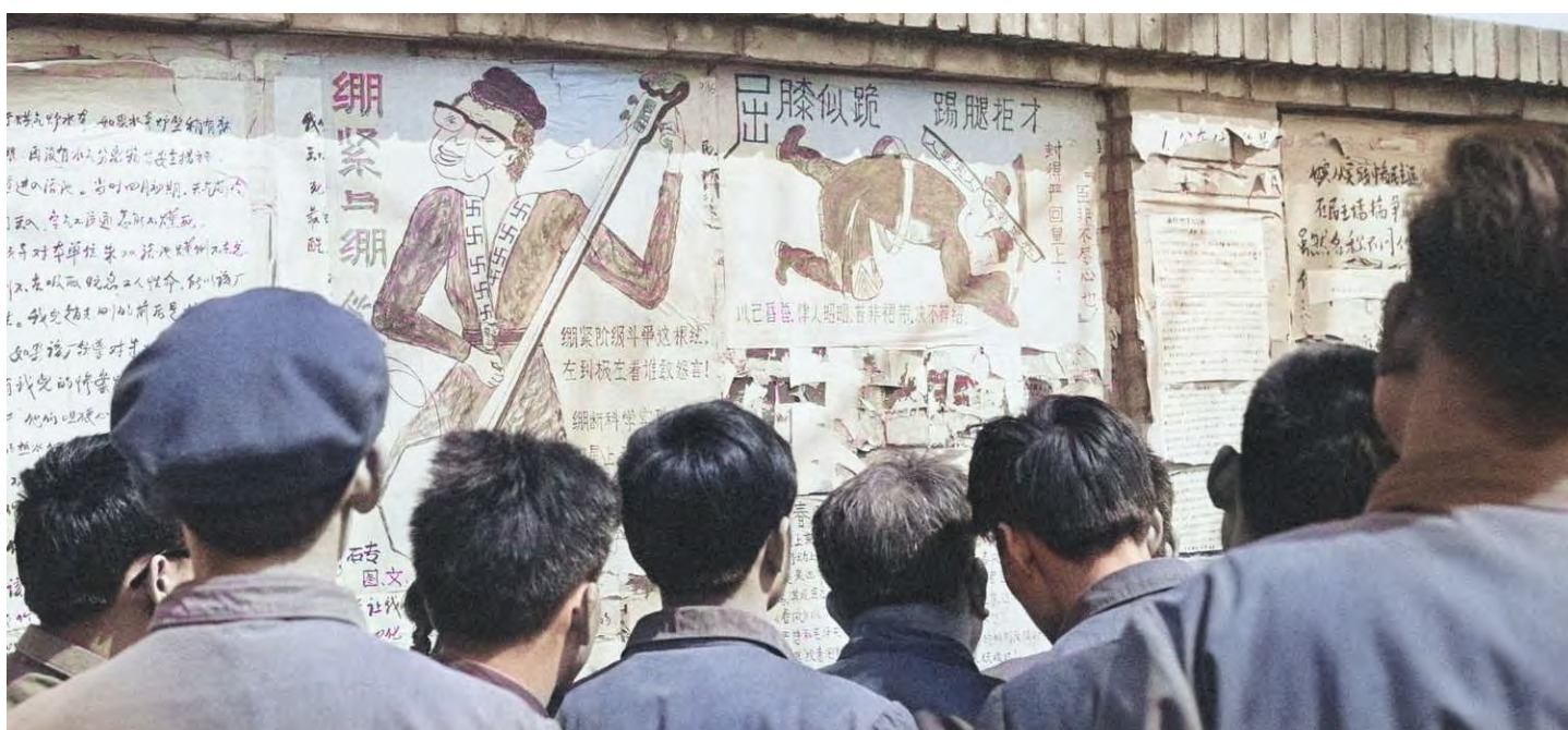
Un gruppo di operai legge dei dazebao (giornali murali a grandi caratteri) con le critiche contro la "Banda dei quattro". Si nota al centro una caricatura satirica su Jiang Qing