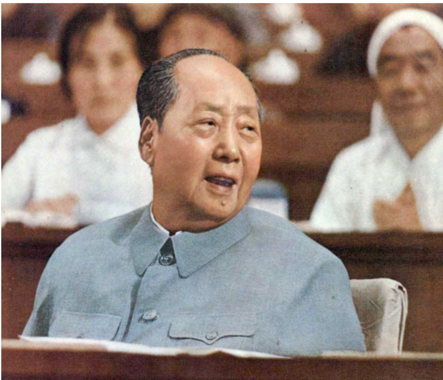
Mao durante i lavori del X Congresso nazionale del PCC tenutosi a Pechino dal 24 al 28 agosto 1973

1. La conferenza sul lavoro nella letteratura e l'arte da parte delle forze armate si tenne a Shanghai dal 2 al 20 febbraio 1966 sotto la presidenza di Jiang Qing,