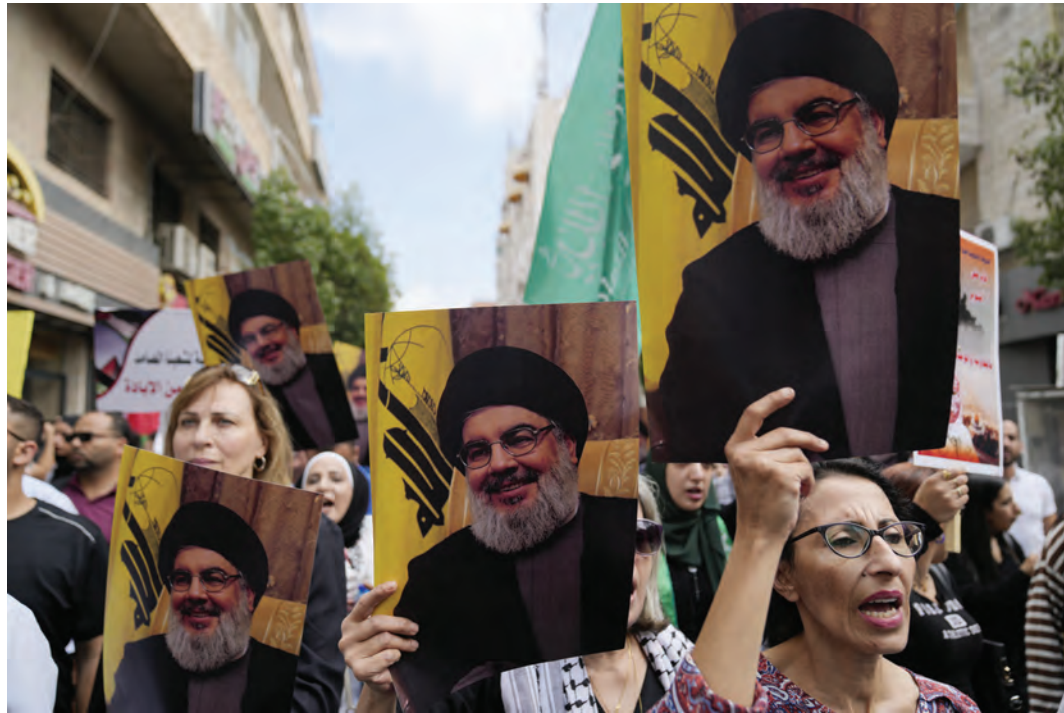
Ramallah in Cisgiordania. Manifestazione contro l'aggressione israeliana al Libano. I manifestanti tengono alto il ritratto di Hassan Nasrallah, leader di Hezbollah, ucciso a Beirut dai nazionisti il 27 settembre 2024

ni mandati avanti nelle incursioni dentro le abitazioni, alla tortura di detenuti e alla metodica distruzione financo delle case abbandonate dalla popolazione in fuga sotto le bombe. Ossia un dettagliato documento autoprodotta dei crimini di guerra e delle violazioni dei diritti umani a Gaza. Denunciato come "il primo Genocidio trasmesso in diretta web della storia" dalla scrittrice palestinese Susan Abulhawa.