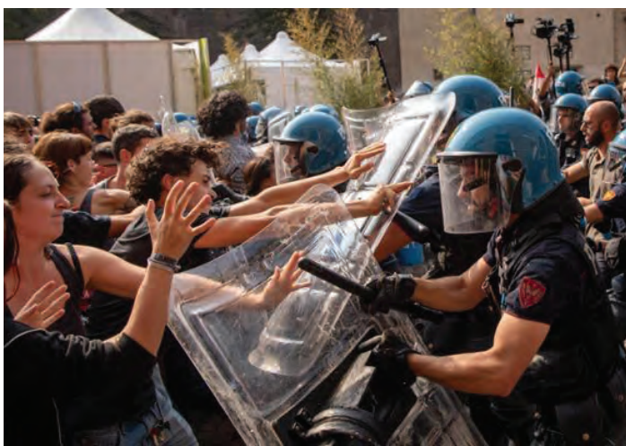
3 ottobre 2023. Le cariche della polizia contro il corteo studentesco di protesta contro la visita della duchessa Meloni a Torino

L'articolo 13 vuole ampliare i poteri dei questori nell'applicazione del Daspo urbano previsto dal decreto legge n. 14 del 20 febbraio 2017 convertito con modifiche dalla legge n. 48 del 18 aprile 2017, disponendo che essi possano disporre del divieto di accesso alle aree delle infrastrutture di trasporto e alle loro pertinenze nei confronti di coloro che risultino anche solo denunciati o condannati anche con sentenza non definitiva, nel corso dei precedenti cinque anni, non essendo più sufficiente una condanna definitiva come prevede il regime attuale. Insomma, ai capibastone polizieschi viene concesso l'arbitrio di impedire l'ingresso a stazioni della ferrovia, a stazioni delle corriere,