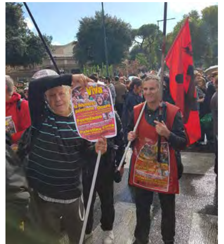
A sinistra : Un primo piano dei cartelli del PMLI con le parole d'ordine a sostegno della lotta della Palestina Sopra: Un manifestante mostra con orgoglio una locandina con la riproduzione del manifesto del PMLI Sotto: La manifestazione nazionale per la Palestina