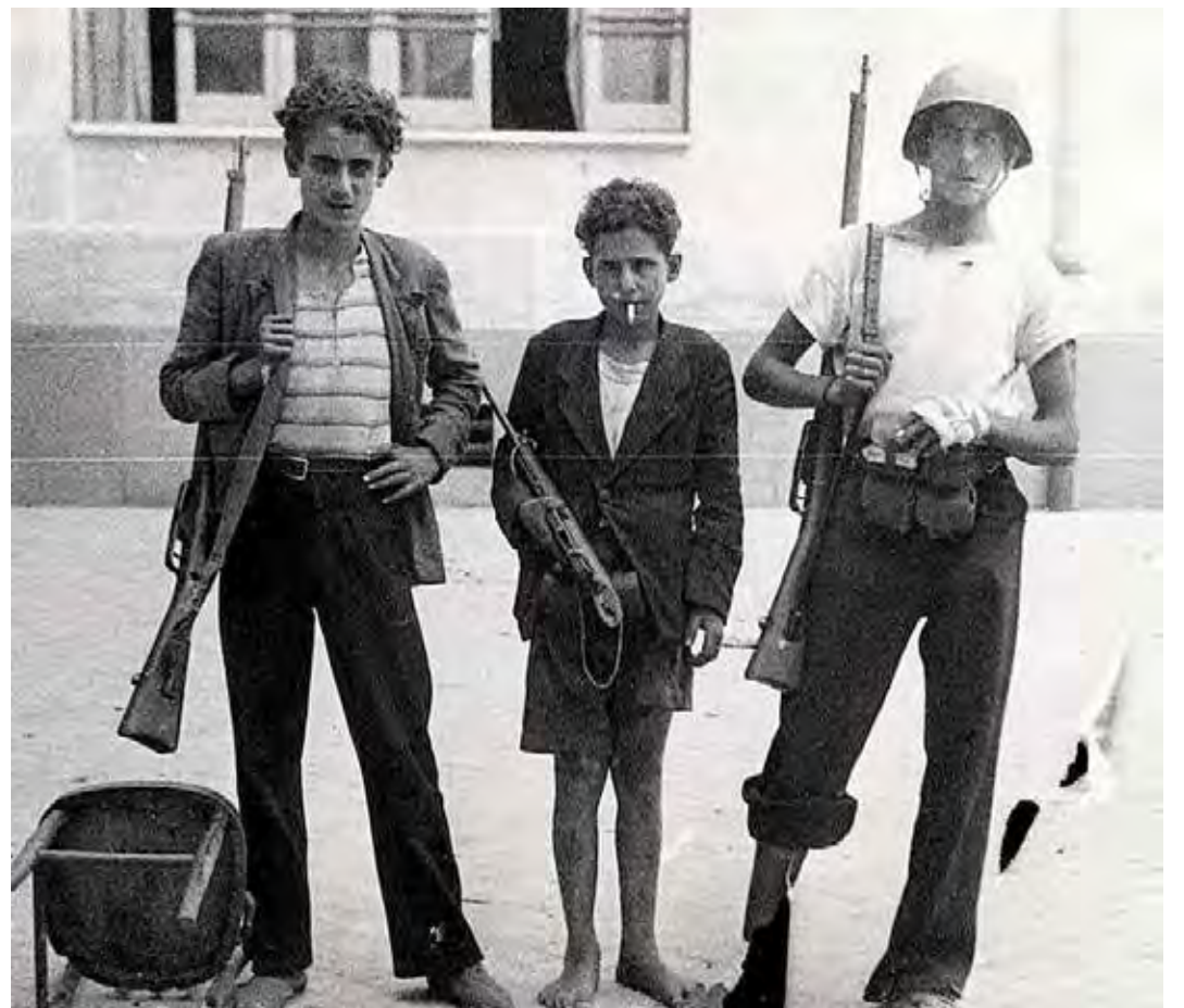
Giovani combattenti durante le gloriose 4 Giornate di Napoli

Quattro giornate, quattro giornate son bastate per scacciare chi rubava anche i sogni di libertà. Quattro giornate, che paura, che incoscienza che coraggio e follia, quanti morti e quanto sangue. Quattro giornate, e scoppiarono i pensieri e scoppiarono i sentimenti e scoppiarono bombe e paura. La paura di restare per terra, senza vita e senza voce,