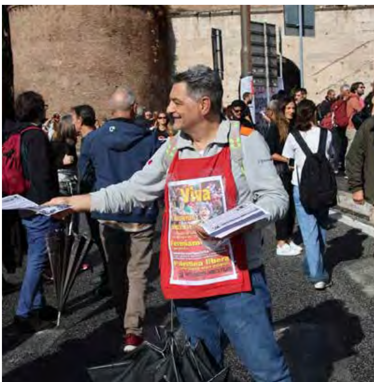
Due momenti della diffusione dei volantini del PMLI con le parole d'ordine per la manifestazione

Il forte spirito unitario antimperialista e antisionista della piazza si è espresso anche con la ripetuta condanna del governo neofascista Meloni, accompagnato dal "siamo tutti antifascisti" ritmato, fino all'emozionante canto corale di "Bella ciao".