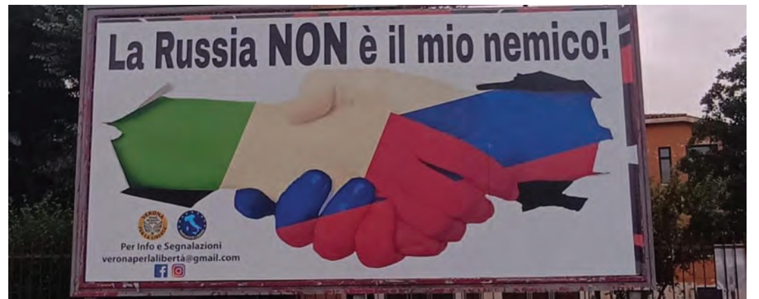
Uno dei grandi manifesti a favore della Russia di Putin apparsi in alcune città italiane. Qui siamo a Verona

Con l'articolo 28 del disegno di legge si autorizzano tutti gli agenti e ufficiali di pubblica sicurezza - ovvero gli appartenenti alla polizia di Stato, all'ar-