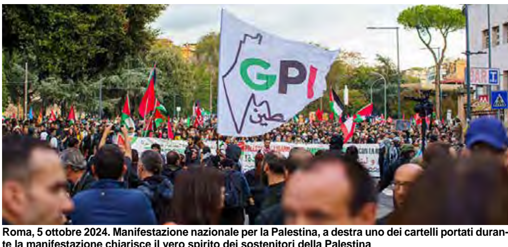
Roma, 5 ottobre 2024. Manifestazione nazionale per la Palestina, a destra uno dei cartelli portati durante la manifestazione chiarisce il vero spirito dei sostenitori della Palestina