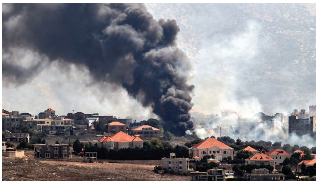
7 ottobre 2024. Il bombardamento sionista del villaggio di Khiam, Libano meridionale al confine con Israele

Ai primi di ottobre la televisione qatariota al Jazeera ha diffuso un documentario, disponibile su YouTube, costruito da un collage di video e foto pubblicati su Instagram, Facebook, TikTok e YouTube dai soldati nazionisti per esaltare le loro "gesta eroiche", dall'omicidio di civili disarmati all'uso di prigionieri come scudi uma-