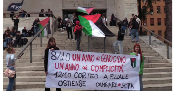
Roma, 8 ottobre 2024. Un momento del flash-mob organizzato dalle studentesse e dagli studenti per la Palestina

"Oggi importante iniziativa in Sapienza sulla Palestina - hanno scritto i promotori