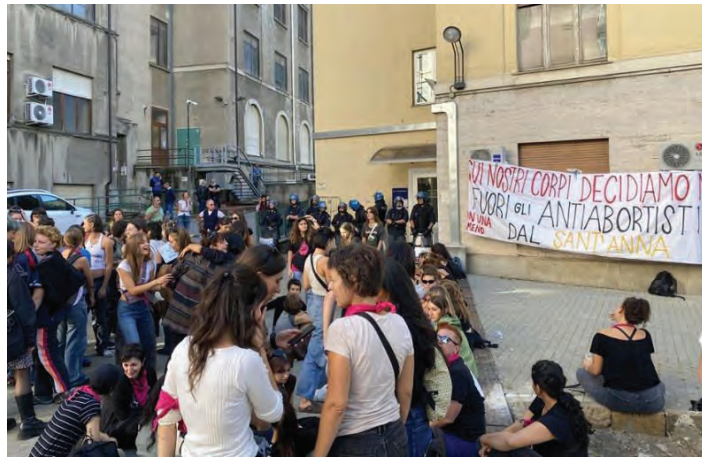
Torino, 228 settembre 2024. Manifestazione per la difesa del diritto di aborto davanti all'ospedale ostetrico ginecologico Sant'Anna