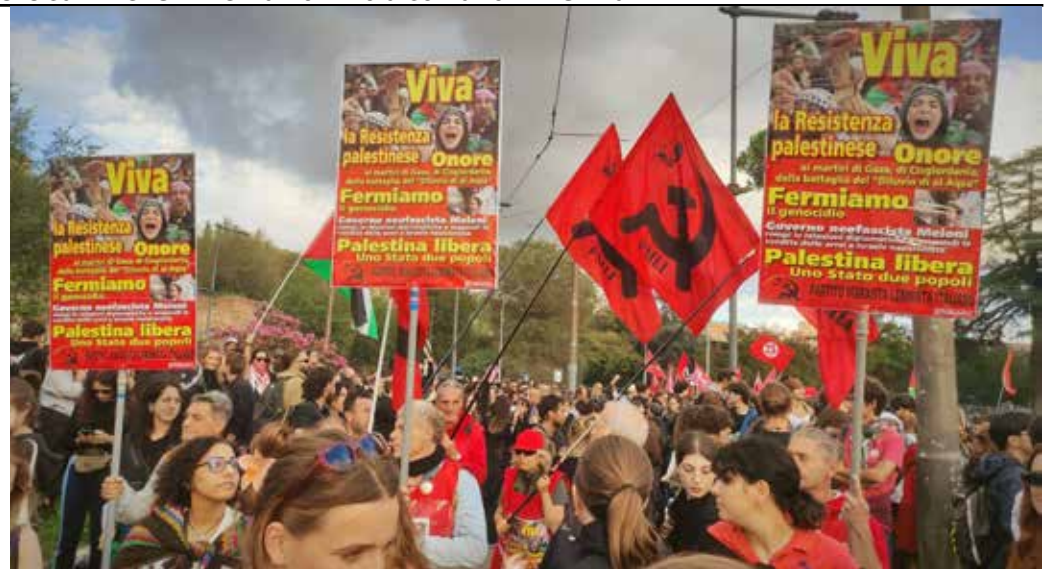
Roma, 5 ottobre 2024. Manifestazione nazionale per la Palestina e contro l'aggressione sionista al Libano. In primo piano la delegazione nazionale del PMLI

COMUNICATO DI GPI E UDAP SULLA PIAZZA NAZIONALE DEL 5 OTTOBRE A ROMA