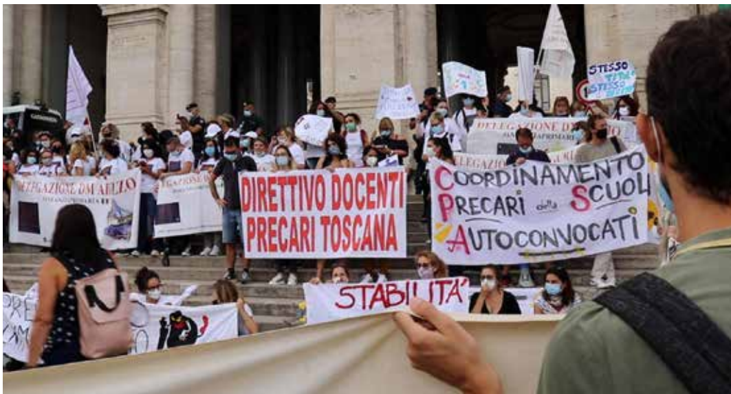
Una manifestazione nazionale dei docenti precari sotto il Ministero dell'Istruzione

Altro che "cassetta degli attrezzi a disposizione delle università". Altro che "superamento dell'attuale inferno del pre-