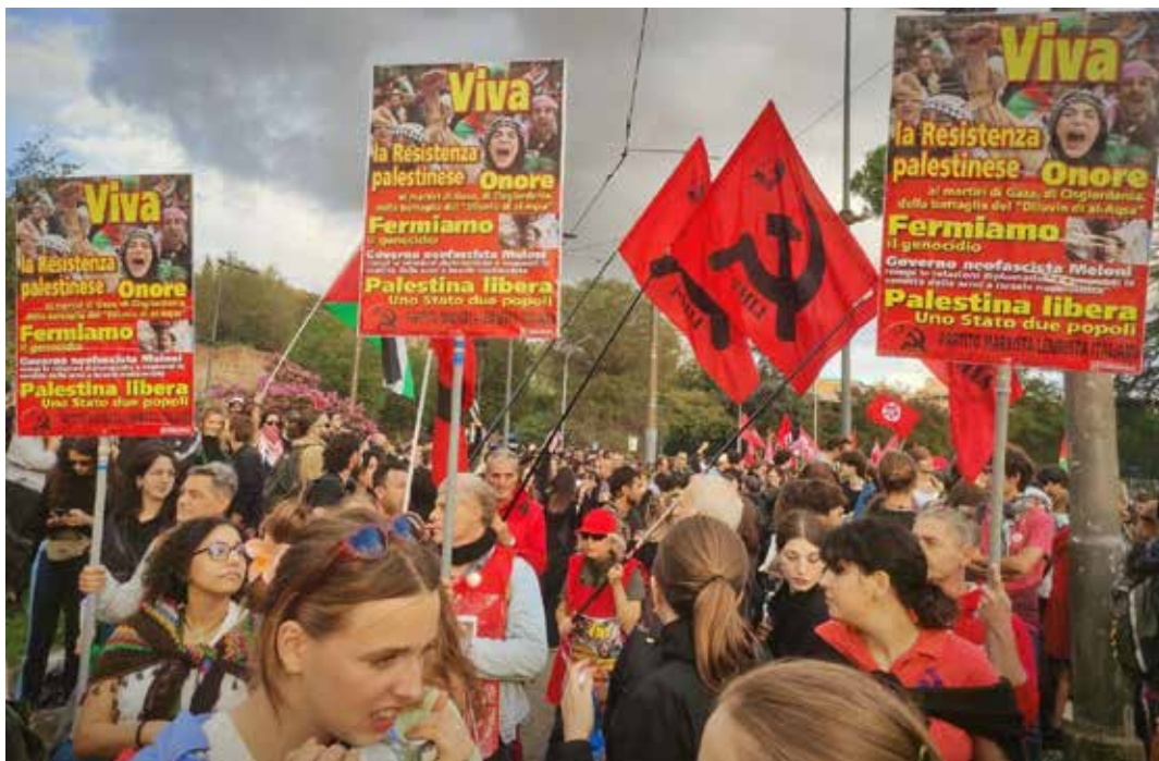
Roma, 5 ottobre 2024. Manifestazione nazionale a sostegno della Resistenza e contro il genocidio del popolo palestinese. In primo piano la delegazione nazionale del PMLI

che una pericolosa escalation in una regione già instabile. Israele ha la piena responsabilità dell'attuale ciclo di escalation ed espansione del conflitto nella regione. Chiediamo al Consiglio di Sicurezza delle Nazioni Unite di svolgere il proprio ruolo per il mantenimento della pace e della sicurezza internazionale e di adottare misure immediate per porre fine all'imprudenza israeliana nella regione e al suo comportamento criminale". La