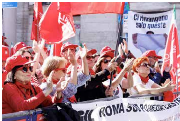
Roma, 28 ottobre 2024. Manifestazione regionale dei pensionati contro la manovra economica del governo

che si trovano al di sotto della soglia di povertà.