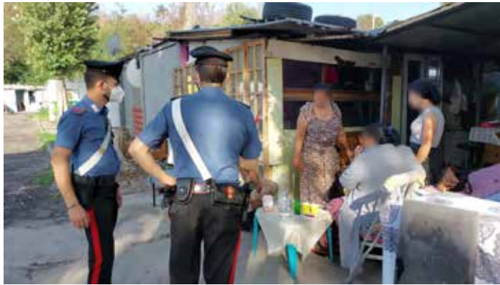
Carabinieri durante una perquisizione in un campo nomadi a Roma

Il generale, ricorda l'Ecri, "ha anche attaccato gli italiani di colore, affermando che le persone non sono nate tutte uguali e che gli immigrati saranno sempre diversi. Ha fatto l'esempio di una campionessa di pallavolo italiana di colore, Paola Egonu, affermando che "è italiana di cittadinanza, ma è chiaro che i suoi tratti somatici non rappresentano l'italianità". A seguito di queste affermazioni, "l'autore è stato rimosso dalle sue posizioni di comando e di gestione nell'Esercito".