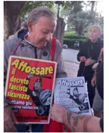
Catania 26 ottobre 2024. Il partecipato presidio contro il Ddl 1660 e la diffusione del volantino del PMLI per affossare il "decreto sicurezza"

bertà rimasta, e ha sottolineato che al sistema capitalista in crisi servono governi che ne facciano pagare il prezzo al popolo. Quindi, per sbarrare la strada a questa situazione, bisogna lottare uniti per non fare passare il Ddl