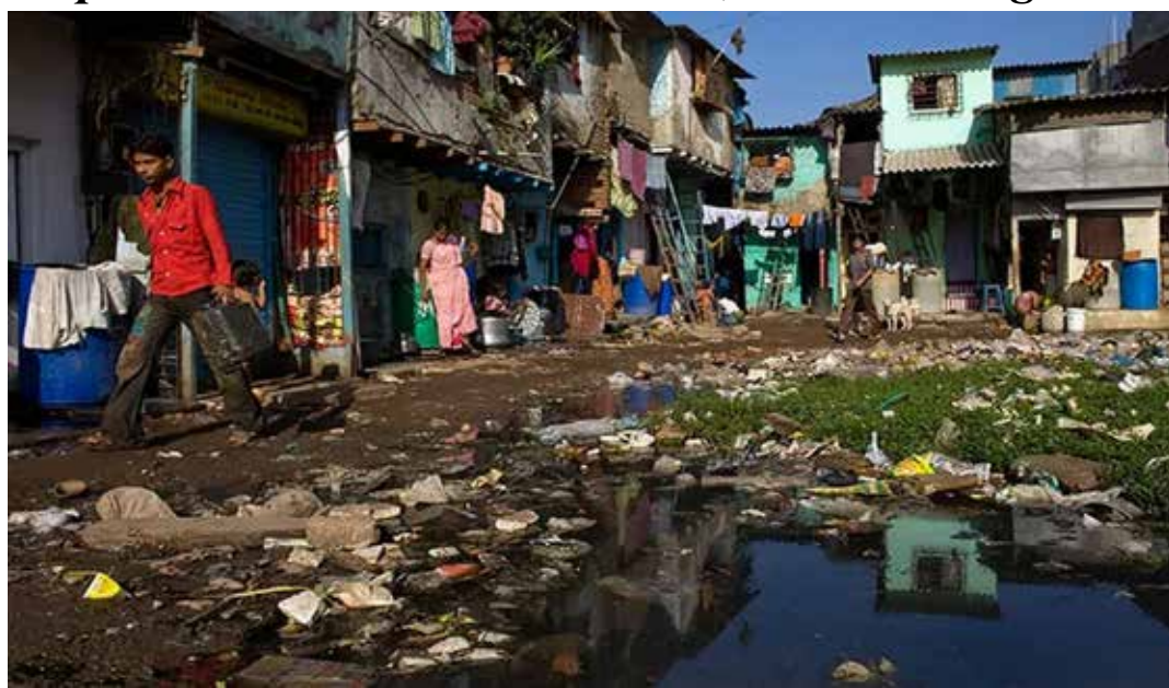
Una zona dei quartieri più poveri di una grande città indiana

nel 2023 sono stati 4,9 milioni gli italiani - l'8,4% della popolazione al di sopra dei sedici anni - che non hanno potuto permettersi un pasto completo ogni due giorni.