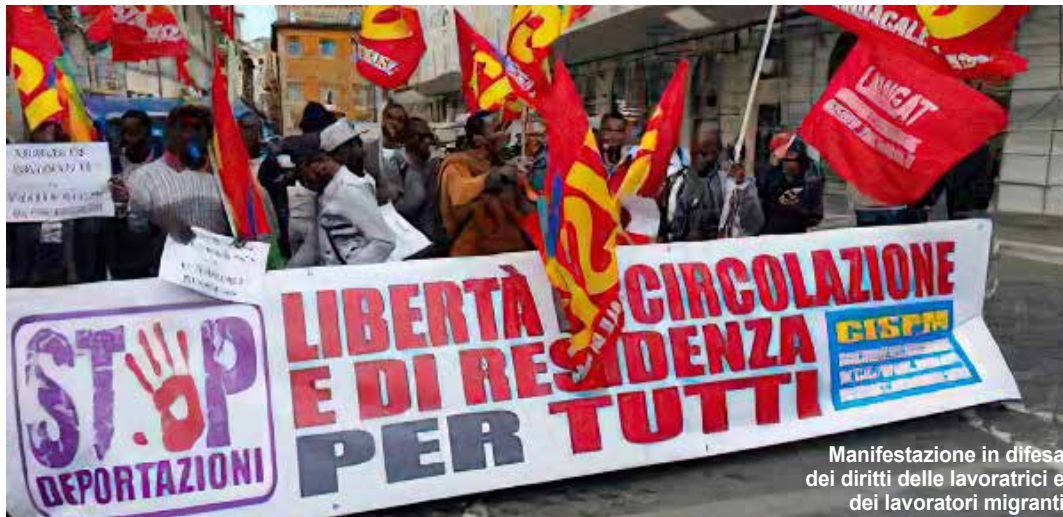
Manifestazione in difesa dei diritti delle lavoratrici e dei lavoratori migranti

Infatti secondo tale pronuncia, che proviene da una legislazione sovranazionale e perciò sovrasta quella italiana, un paese non può essere considerato "sicuro", ai fini del rimpatrio forzato, solo per alcune categorie di richiedenti asilo e altre no.