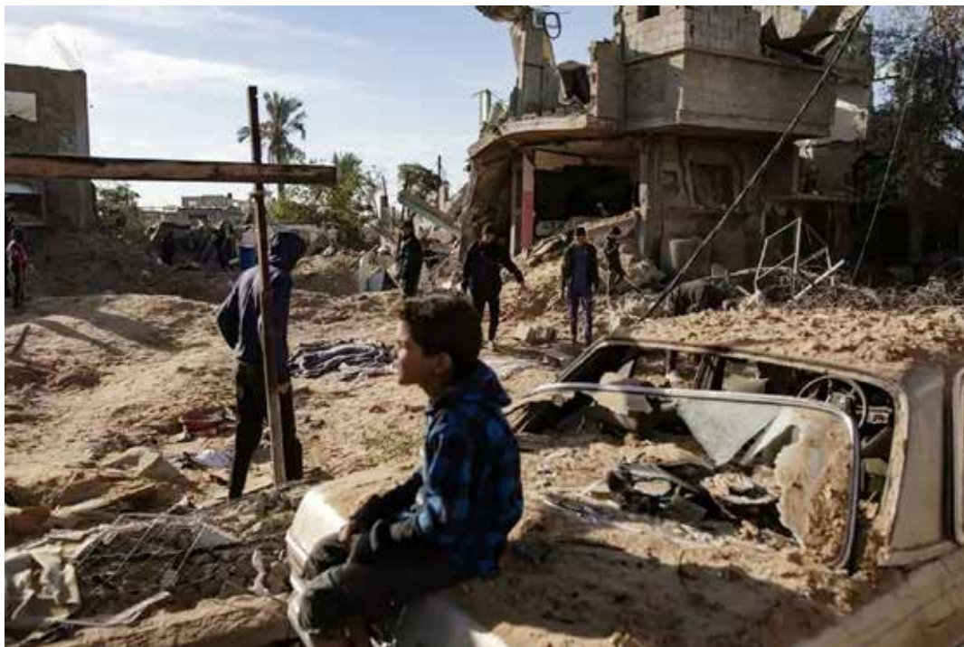
Gaza, 25 ottobre 2024. Sono almeno 38 le vittime (tra i quali 14 bambini) dell'attacco aereo nazionista su Khan Younis nel sud su strutture residenziali completamente rase al suolo

Poco dopo le una e mezza di notte l'annuncio ufficiale dei militari sionisti: "in risposta a mesi di continui attacchi dal regime iraniano contro lo Stato di Israele, sono in corso bombardamenti mirati su obiettivi