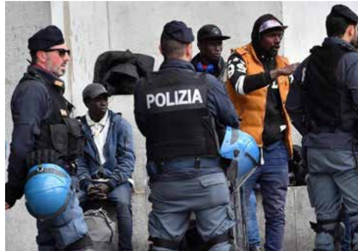
Controlli di polizia sui migranti

I massimi vertici del regime neofascista venuti a conoscenza del report hanno fat-