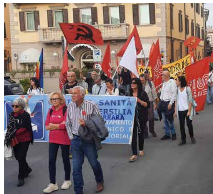
Pontedera (Pisa), 26 ottobre 2024. Un aspetto della manifestazione "NO Valdera avvelenata" a cui ha aderito il PMLI

Alla manifestazione, oltre alle organizzazioni della Valdera erano presenti anche il comitato "No Keu" dell'Empolese-Valdelsa e altri della Piana fiorentina che si oppongono agli inceneritori e all'allungamento della pista dell'aeroporto di Peretola del capoluogo toscano, l'associazione "Livorno porto pulito", il comitato che si batte contro lo smembramento dissennato delle Alpi Apuane per il prelievo del marmo, quelli per la ripubblicizzazione dell'acqua e contro l'inquinamento delle falde dal Pfas, il tutto a segnalare le numerose criticità ambientali esistenti in Toscana. Tra i tanti striscioni anche quello del Comitato di Fabbrica ex-GKN. La presenza del comitato No base è stata invece un chiaro messaggio