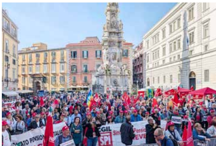
Napoli, 29 ottobre 2024. Manifestazione dei pensionati campani

E quando si parla di queste cifre non si deve pensare che esse riguardino solo un ristretto numero di pensionati. Dall'Osservatorio Inps emerge un quadro preoccupante sulle pensioni in Italia: il 53,7% degli assegni ha un importo inferiore a 750 euro al mese. Si tratta di 9,5 milioni di pensionati, di cui 4 milioni (il 44%) integrate da prestazioni legate a bassi redditi, come integrazioni al minimo, maggiorazioni sociali, pensioni e assegni sociali e pensioni di invalidità civile. In alcune regioni del sud e per quanto riguarda il genere femminile, si arriva persino a superare il 70% di assegni