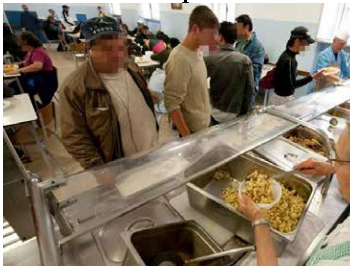
Una delle tante mense per poveri durante il servizio dei pasti

Il vero record della Meloni è che in termini assoluti, in un solo anno, anche nelle regioni settentrionali i poveri sono aumentati e sono passati da 2,298 milioni del 2022 ai 2,413 milioni del 2023.