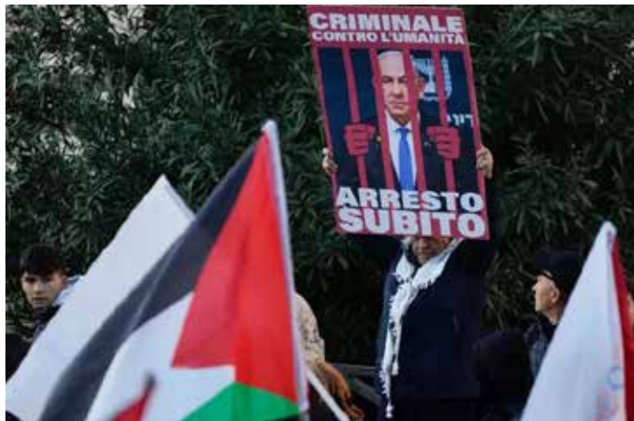
Un significativo cartello per l'arresto e la condanna del boia Netanyahu

Più in generale, noi crediamo che sia fallimentare la richiesta della creazione di due stati e due popoli. Per noi l'unica soluzione possibile per arrivare a una pace vera, giusta e duratura è la nascita di uno stato palestinese in cui possano convivere insieme i popoli arabi, palestinese e ebraico secondo la volontà e l'autodeterminazione del popolo palestinese.