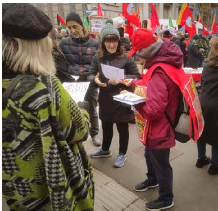
Un momento della diffusione del volantino del PMLI contro la manovra al concentramento della manifestazione