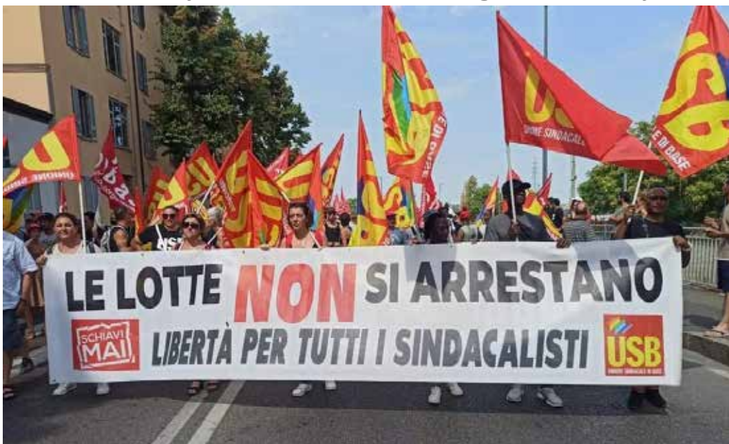
Mi sembra che la foto inserita nel contesto con l'articolo parli da sola. NODida

In ogni caso, questa dichiarata caccia al sindacalista di Meloni e Piantedosi già rilevata dai giuslavoristi, è desti-