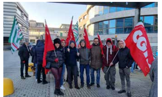
Ponte a Ema (Firenze), 2 dicembre 2024. Il presidio dei lavoratori e delle lavoratrici delle società del Perimetro Diretto di ICCREA nel polo di via Meucci

Secondo i delegati di settore della FISAC-CGIL "ciò che accade ora alle lavoratrici e ai lavoratori di BCC SI è un attacco ai dipendenti dell'intero settore, da quelli delle società di servizio di gruppo, fino agli impiegati e alle impiegate delle Banche Cooperative che quotidianamente si trovano coinvolti nelle pesanti conseguenze delle economie di scala - su tutti i pesanti carichi di lavoro - che controparte ritiene indispensabili per rimanere competitivi e sul mercato. Termini che non appartengono alla cultura cooperativa ma a quella del più gretto vocabolario delle grandi banche d'affari perennemente a caccia di profitti".