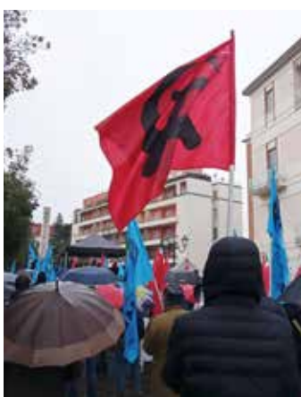
Campobasso, 29 novembre 2024. Il PMLI durante i comizi conclusivi

Ed è qui che bisogna capirsi: se questo, come è stato pur detto in alcuni passaggi "è un governo pericoloso, forse anche neofascista", bene, rilanciamo: cosa si aspetta a