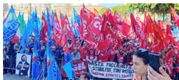
Palermo, 29 novembre 2024. Sciopero generale regionale durante i comizi conclusivi

Insomma una giornata storica di lotta, con la forza dei lavoratori, un duro colpo al governo neofascista della Meloni.