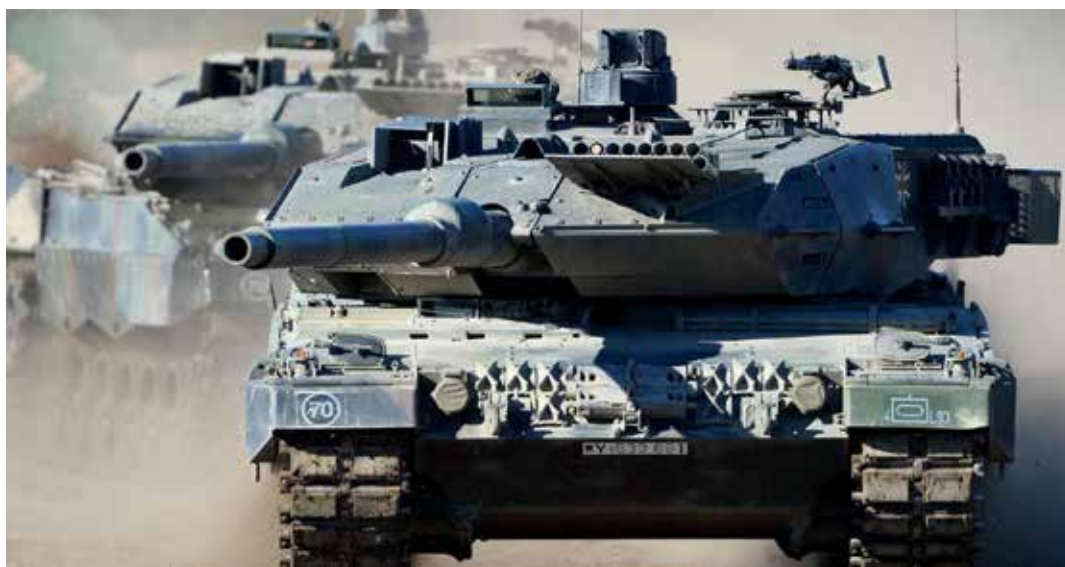
Alcuni carri Panther in azione che saranno sviluppati e costruiti dalla neonata società Leonardo-Rheinmetall

Insomma un'alleanza militare a tutto tondo, e non vorremmo che nei confronti della guerra mondiale imperialista richiamasse il famigerato Patto d'Acciaio siglato dall'Italia fascista di Mussolini e la Germania nazista di Hitler nel maggio del 1939 proprio alla vigilia dello scoppio della seconda guerra mondiale.