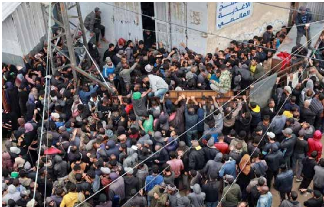
Gaza centro, Deir el-Balah, 29 novembre 2024. Il tragico assalto ad una panetteria che stava distribuendo quel poco di pane arrivato

Non sarà consentito ricostruire l'infrastruttura terroristica di Hezbollah nel Libano meridionale. E nei prossimi 60 giorni, Israele ritirerà gradualmente le sue forze e i civili di entrambe le parti potranno presto tornare in sicurezza alle loro comunità". Biden chiudeva ribadendo l'impegno degli Stati Uniti per la piena attuazione dell'accordo, "con il pieno supporto della Francia e dei nostri altri alleati", vedi l'imperialismo italiano alla guida di Unifil che per anni da complice ha assistito alle incursioni sioniste nel sud del Libano senza profferir parola. Con un riferimento al volo per quanto riguarda la Striscia di Gaza, Biden annunciava che "gli Stati Uniti faranno un altro tentativo con Turchia, Egitto, Qatar, Israele e altri per ottenere un cessate il fuoco a Gaza