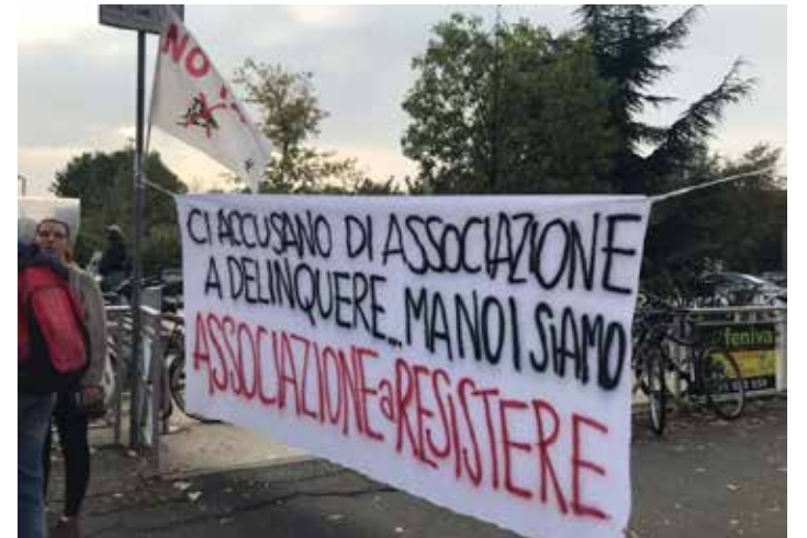
25 gennaio 2023. Presidio davanti il tribunale di Torino durante il processo agli imputati per "associazione a delinquere" del Movimento No Tav e del Centro Sociale Askatasuna