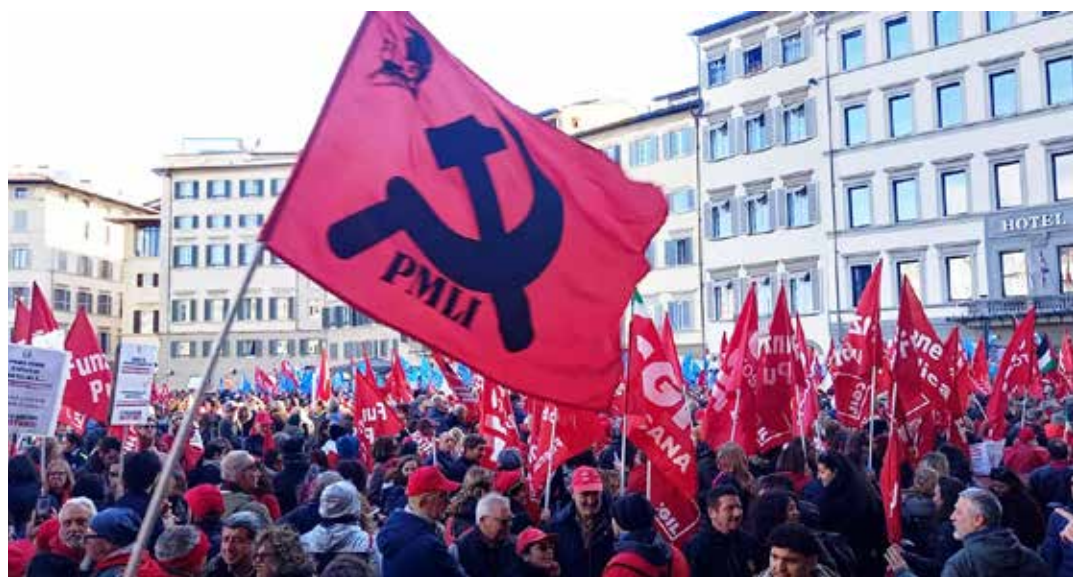
Dal Gruppo Lavoratori Cgil Alia su Whatsapp

Un secondo corteo organizzato dai sindacati di base Cobas e Cub, al quale hanno partecipato anche i Giovani Palestinesi, i ragazzi e le ragazze dei centri sociali ed in particolare del CPA Firenze Sud e alcuni collettivi studenteschi, è invece partito da piazza Puccini toccando il cantiere Esselunga di via Mariti per ricordare i morti sul lavoro, per poi giungere in piazza Dalmazia omaggiando la lapide dei senegalesi uc-