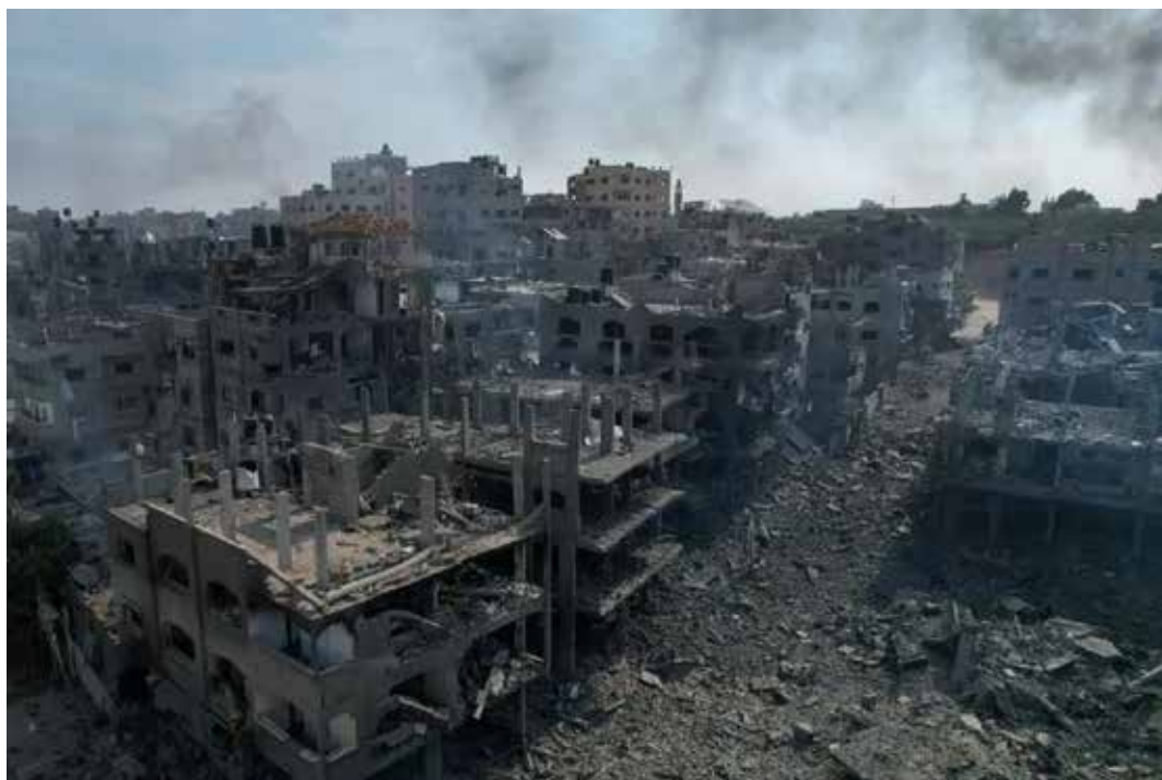
La desolante distruzione de campi di Jabalia a Gaza

con il rilascio degli ostaggi e la fine della guerra senza Hamas al potere, affinché diventi possibile", tanto per dire che il popolo palestinese manco citato non ha alcuna voce in capitolo sul proprio destino, decidono gli altri governi. Anzitutto i nazionisti che continuano il genocidio palestinese a Gaza arrivato il 2 dicembre a 44.466 morti e 105.358 feriti.