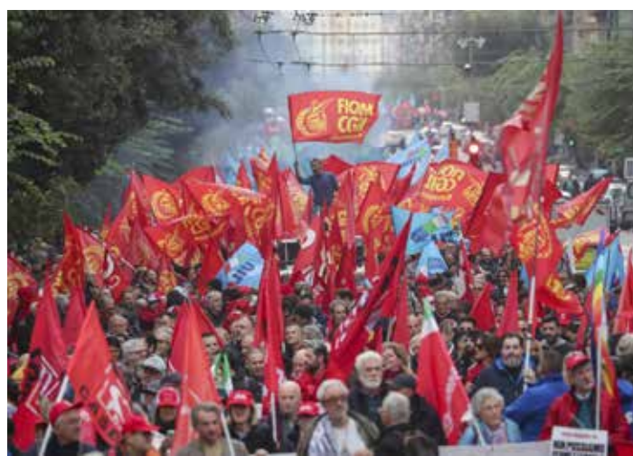
Napoli, 29 novembre 2024. Un momento del combattivo corteo per lo sciopero generale

no neofascista Meloni. Parole d'ordine apprezzate dagli operai Fiom, ma anche dai sindacati di base che addirittura applaudivano al nostro passaggio dinanzi all'Università degli studi "Federico II", presidiata dai lavoratori del settore all'altezza delle storiche scale. Due lavoratrici apprezzavano il nostro manifesto