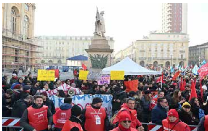
Torino, 29 novembre 2024. Sciopero generale regionale. Piazza Castello gremita per i comizi conclusivi

A loro agio come pesci rossi nell'acqua, i marxisti-leninisti milanesi sono stati ben accolti negli