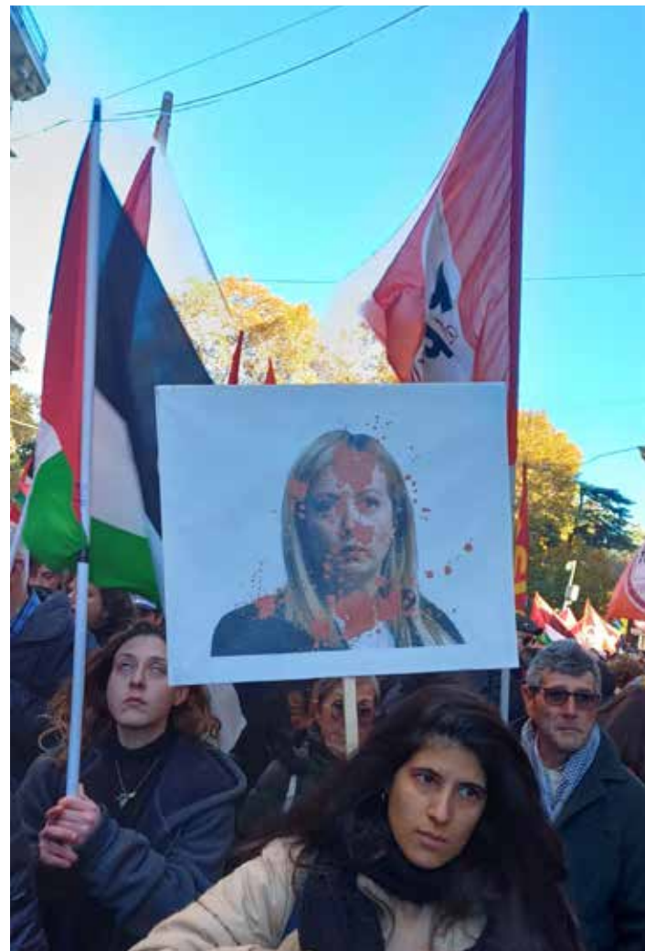
Durante la manifestazione è stata denunciata anche la complicità con Israele sionista della ducessa Meloni