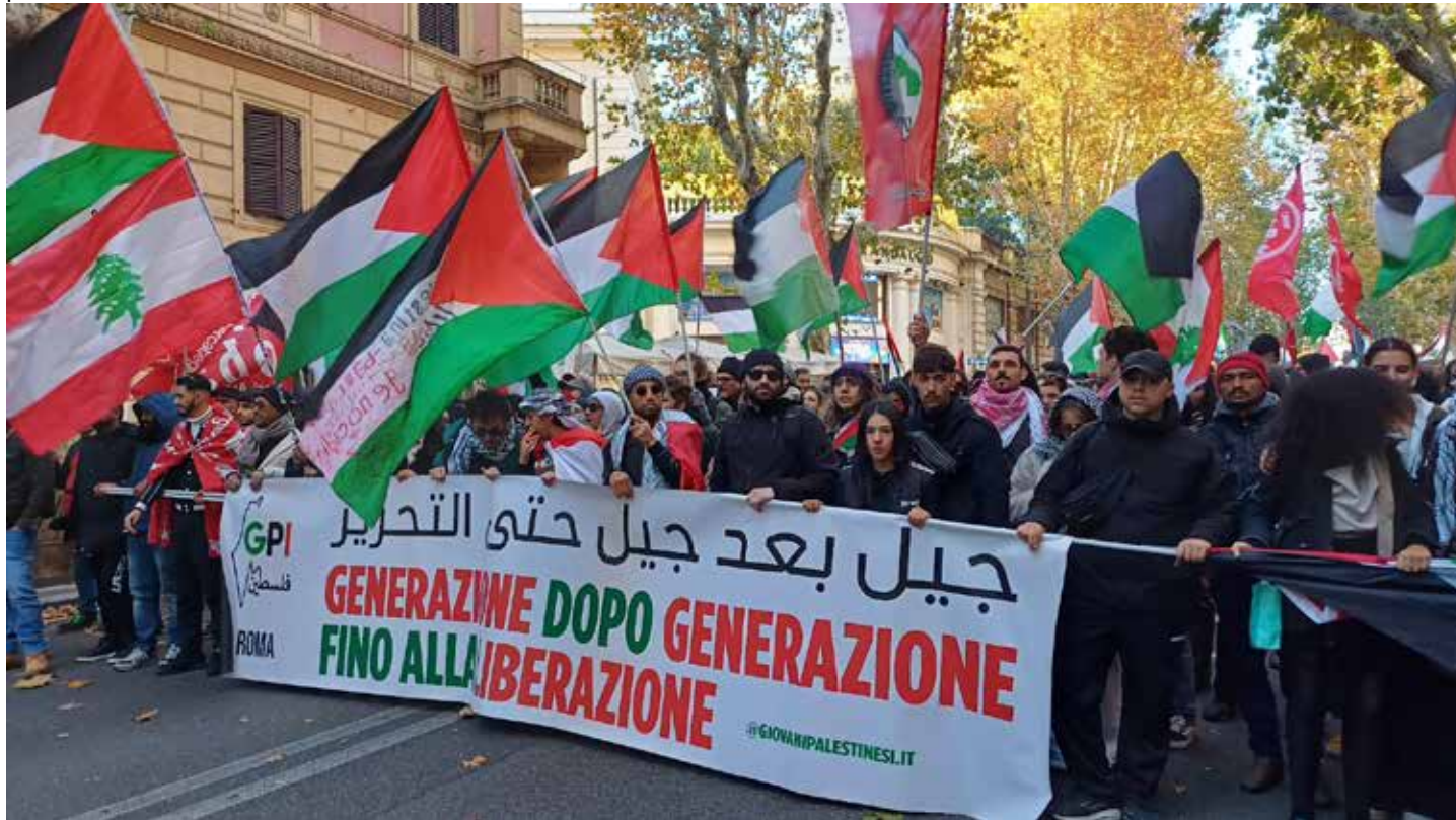
Roma, 30 novembre 2024. Lo striscione e la partecipazione dei Giovani Palestinesi d'Italia

Il PMLI invita tutte le organizzazioni politiche, movimenti, associazioni e collettivi che sostengono la causa palestinese a mettere in secondo piano i propri giudizi su chi conduce questa lotta e si uniscano in un grande fronte antimperialista in grado di far cessare immediatamente il genocidio del popolo palestinese; imporre il ritiro immediato e totale dei sionisti e neonazisti da Gaza, dalla Cisgiordania e dal Libano; pretendere che il nuovo Hitler Netanyahu venga arrestato e processato per direttissima come criminale di guerra e