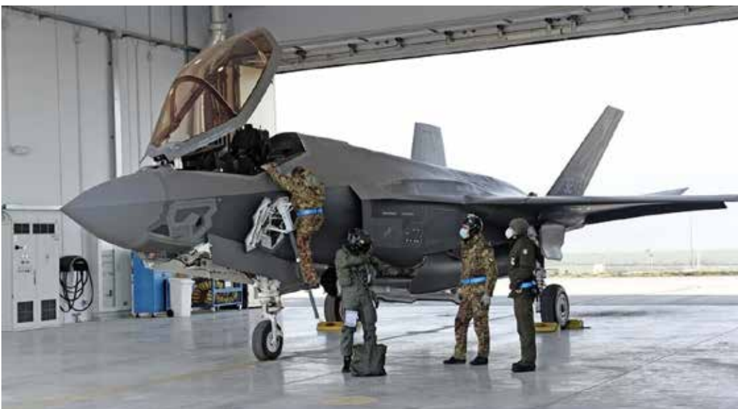
I nuovi F35 acquistati dall'Italia