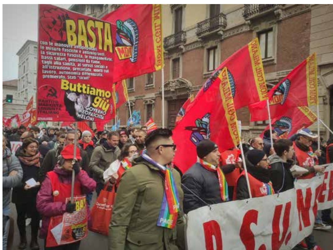
Milano, 29 novembre 2024. Un momento del corteo per lo sciopero generale

In 15 mila alla manifestazione provinciale. 2 mila al corteo dei sindacati di base a cui hanno partecipato collettivi studenteschi e comitati. I compagni della Cellula "Mao" diffondono centinaia di volantini e lanciano slogan negli spezzoni della Fiom e della Filcams