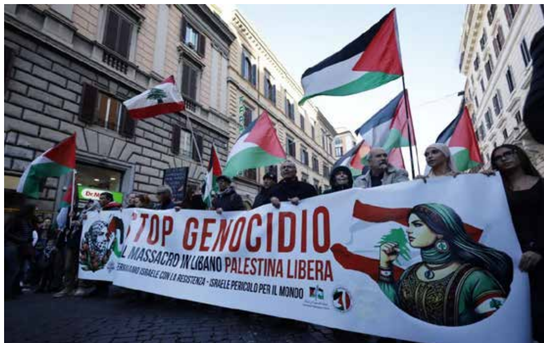
Roma, 30 novembre 2024. Manifestazione nazionale contro il genocidio dei palestinesi e i massacri in Libano. Lo striscione di apertura del combattivo corteo

emerse nel corso dell'Assemblea nazionale svoltasi il 9 novembre scorso presso La Sapienza di Roma promossa ed egemonizzata dalla Rete dei comunisti, alleata con Potere al popolo e con l'Usb da cui è nata "L'assemblea del 9 Novembre" che ha raccolto oltre 130 adesioni tra gli organismi, organizzazioni e movimenti dell'associazionismo della sinistra borghese, sinistra PD e Avs. Tra l'altro, come Gpi e Udap hanno denunciato in un comunicato diffuso via social: "L'assemblea del 9 Novembre ha tentato di imporre la propria firma come promotore della manifestazione del 30 ottobre. Questo tentativo è stato unanimemente respinto dalle realtà palestinesi".