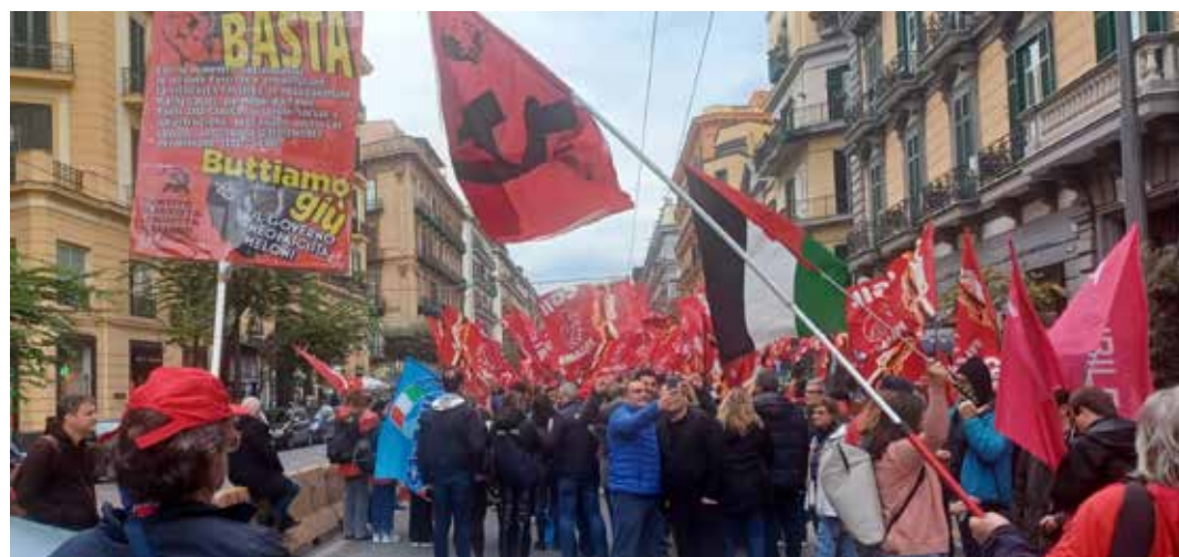
La partecipazione del PMLI durante il corteo. In primo piano il cartello contro la manovra e il governo neofascista Meloni

Vedremo quindi se i sindacati daranno fuoco alla miccia per incendiare la prateria partendo proprio da questo sciopero generale.