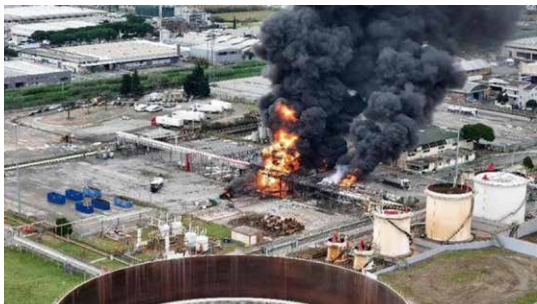
Calenzano (Firenze), 9 dicembre 2024. L'esplosione nella raffineria dell'ENI che è costata la vita a cinque lavoratori

L'esplosione ha interessato gran parte delle fabbriche e abitazioni circostanti l'impianto Eni: ingenti i danni, lavoratori e abitanti feriti dal crollo dei muri, dai vetri infranti, dai cancelli divelti. La chiusura immediata delle aziende danneggiate con l'incertezza di una loro riapertura a breve termine aggiunge nuova disperazione per tante famiglie di lavoratori occupati in queste aziende della Pia-