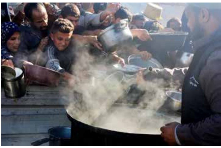
4 dicembre 2024. La distribuzione del poco cibo sfuggito alla distruzione sionista