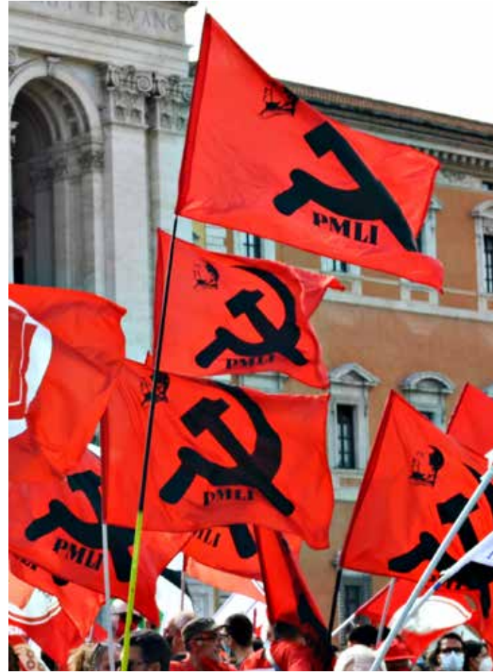
Roma, Piazza San Giovanni, 22 maggio 2021

Scuderi non si limita a citare Mao, ma lo riporta idealmente tra noi per ricordarci che il capitalismo è una bestia che si alimenta del nostro silenzio. E chi potrebbe farlo se non lui? Un Rizzo ormai completamente allineato ai nazifascisti capeggiati da Vannacci? Un Bertinotti garantito dal suo status di intellettuale in pensione? O magari un Landini che ammicca ai lavoratori e alle lavoratrici con la speranza di essere eletto per acclamazione nuovo segretario dell'attuale PD neolibera? Impensabile o, per dirla