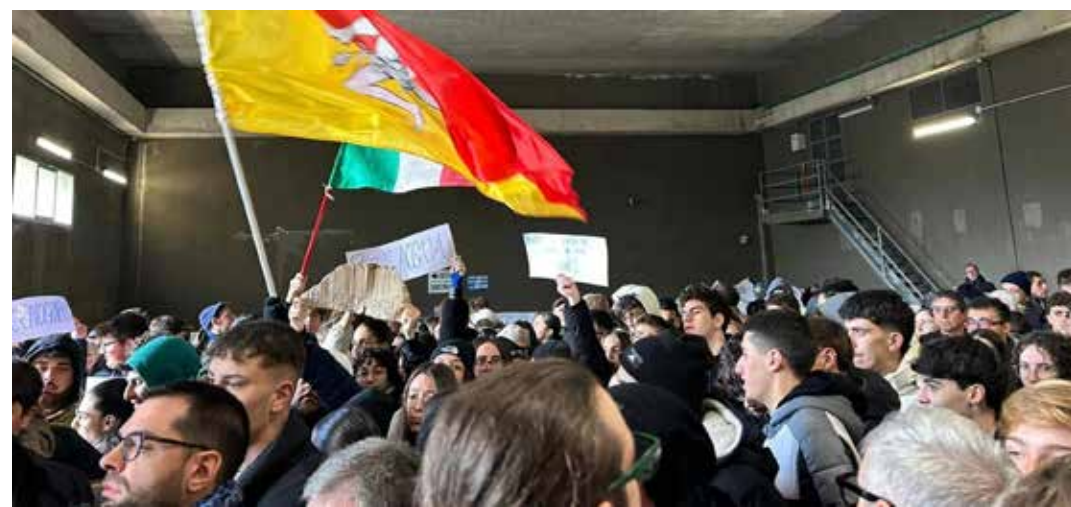
30 novembre 2024. L'occupazione di protesta del potabilizzatore della diga Ancipa. A destra una veduta della diga a pieno regime

Nel corso dell'estate sono stati in decine i siciliani arrestati in flagranza di reato per