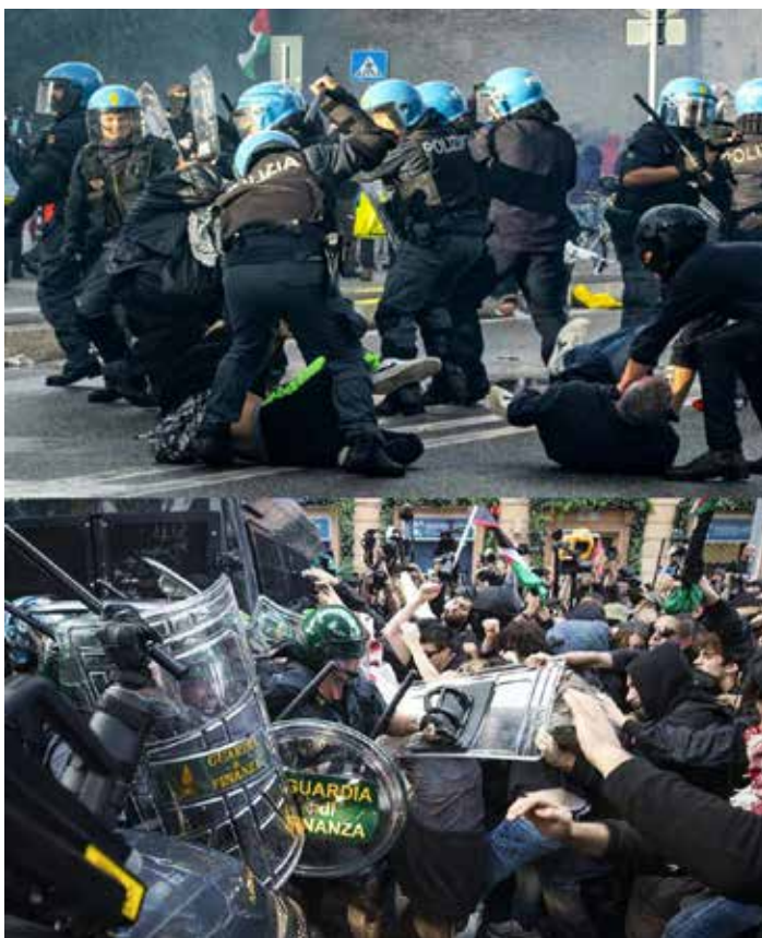
Roma, 5 ottobre 2024. Due immagini delle violente cariche repressive contro i manifestanti durante la manifestazione per la Palestina

Nel mirino della denuncia, anche i fermi di numerose persone dirette alla manifestazione del 5 ottobre, attuati coi blocchi alle uscite autostradali, alla stazione e dalle volanti della polizia che hanno rinchiodato e fermato auto e persone "sospette" in tutta Roma e in tutte le vie di accesso alla piazza. Si tratta di centinaia di antisioniste e antisionisti trattenuti in