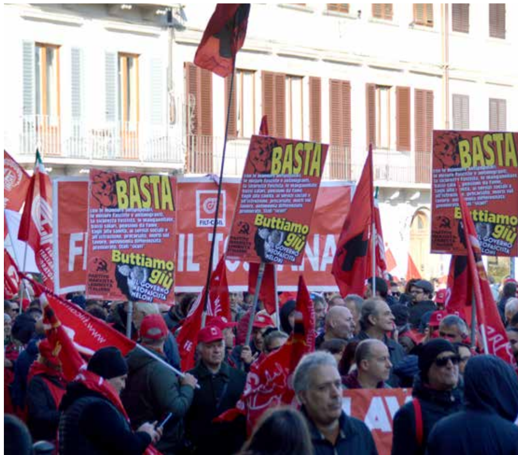
Firenze, 29 novembre 2024. Sciopero generale. Il PMLI tiene alti i manifesti con le parole d'ordine contro la manovra economica e per buttare giù il governo reofascista Meloni

Lottiamo per il socialismo con tranquillità e serenità, concentrandoci sui problemi che abbiamo di fronte