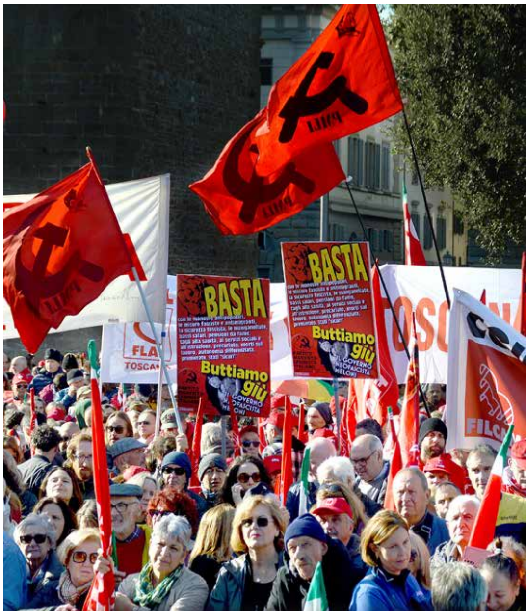
Firenze, 29 novembre 2024. I manifesti del PMLI contro la manovra finanziaria e il governo neofascista Meloni spiccano nella piazza Poggi dove si sono tenuti i comizi conclusivi della manifestazione per lo sciopero generale nazionale

Occorre comprendere, quindi, che si può rivoltare il Paese come un quanto e cambiare veramente la società a patto che si abbandonino le illusioni elettorali, parlamentari, governative, riformiste, pacifiste e costituzionali, e si metta al centro di questa rivolta la distruzione del capitalismo, la conquista del socialismo e il potere politico del proletariato. Cominciando con l'aprire una grande discussione, anche all'interno del sindacato, per creare un vasto fronte unito per buttare giù al più presto, con la lotta di piazza e lo sciopero generale, il governo neofascista Meloni, che sta infliggendo sempre più gravi danni al popolo e al Paese.