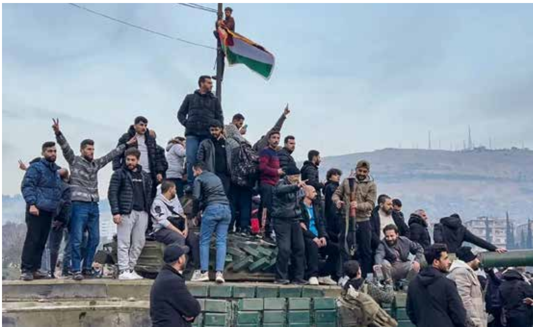
8 dicembre 2024. La popolazione di Damasco festeggia la fine del regime antipopolare siriano di Bashir Al Assad. Qui siamo nella grande e centrale Piazza Omayyade

Da parte sua il presidente siriano Bashar Assad aveva promesso di "sconfiggere i terroristi indipendentemente dalla grandezza dei loro attacchi. La Siria continua a difendere la sua stabilità e integrità territoriale contro tutti i terroristi e i loro sostenitori, ed è capace, con l'aiuto dei suoi alleati e amici, di sconfiggerli ed eliminarli, indipendentemente dall'intensità dei