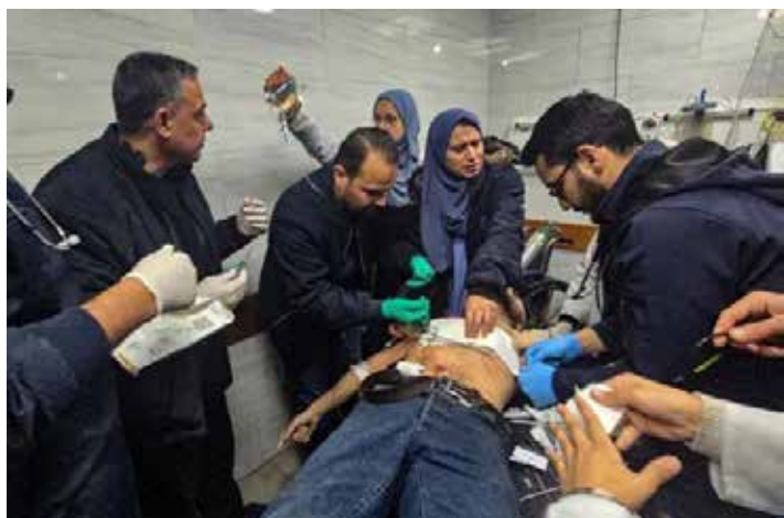
6 dicembre 2024. Le cure ai feriti nell'ospedale di Kamal Awan, uno dei pochi rimasti nel nord di Gaza