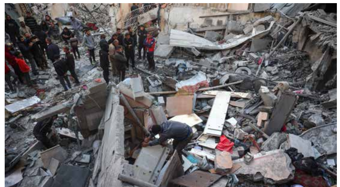
5 dicembre 2024. Alla ricerca delle poche cose da recuperare tra le rovine di alcuni edifici a Nuseirat nel centro di Gaza distrutti da un raid israeliano

gerli fisicamente", e che "le nostre ricerche mostrano che, per mesi, Israele ha continuato a commettere atti di genocidio, pienamente consapevole dei danni irreparabili che stava infliggendo alla popolazione palestinese di Gaza. Ha proseguito a farlo sfidando gli innumerevoli allarmi sulla catastrofica situazione umanitaria e le decisioni, legalmente vincolanti, della Corte Internazionale di Giustizia che aveva ordinato a Israele di prendere misure immediate per consentire la fornitura dell'assistenza umanitaria ai civili di Gaza". "Le nostre conclusioni devono servire a svegliare la comunità internazionale. Questo è un genocidio. Deve cessare ora", concludeva Callamard.