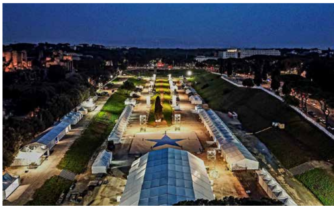
1 novembre 2024. Una veduta del "Villaggio Difesa" allestito occupando tutta l'area del Circo Massimo a Roma

Una nuova sporca operazione di propaganda, questa volta dell'esercito interventista italiano, portata avanti dal governo che rilancia il ruolo imperialista dell'Italia nelle varie zone di influenza, dimenticando di dire tra le altre cose, che, alla luce della defunta Costituzione borghese del '48, l'esercito ha solo una funzione difensiva e non può trovarsi fuori dei confini nazionali.