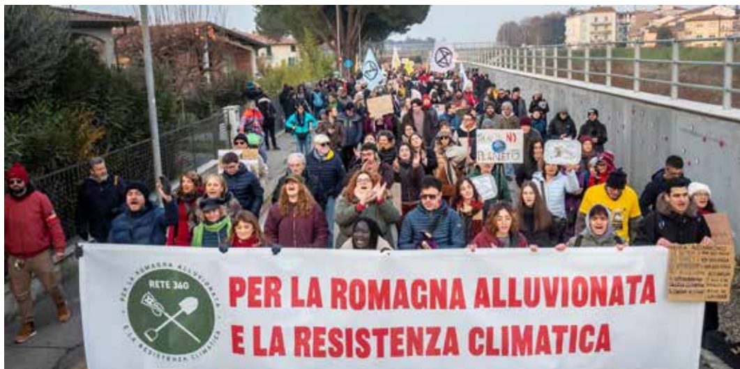
Faenza, 7 dicembre 2024. Un momento della manifestazione di protesta degli alluvionati convocata dal Comitato "Borgo alluvionato" e da Rete 360

Le stesse denunce e le stesse rivendicazioni espresse anche nella manifestazione che si è tenuta sabato 7 dicembre a Faenza, convocata dal Comitato "Borgo alluvionato", e da Rete 360 (i millimetri di pioggia caduti nell'ultimo evento alluvionale dello scorso settembre e come l'angolazione da cui ci si impegna ad affrontare le problematiche dei territori colpiti), alla quale hanno aderito 40 tra associazioni, sindacati, comi-