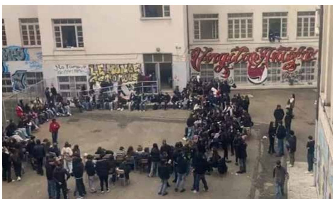
Roma, 29 novembre 2024. Una assemblea studentesca all'interno del liceo Virgilio occupato