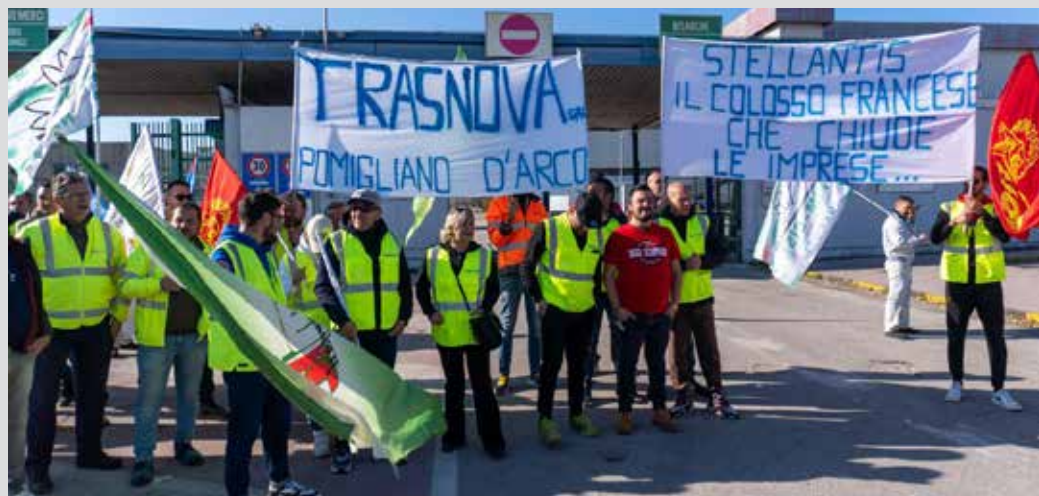
Il presidio di lotta delle operaie e degli operai della Trasnova davanti gli ingressi della Stellantis di Pomigliano d'Arco (Napoli)

PARTITO MARXISTA-LENINISTA ITALIANO Cellula "Vesuvio Rosso" di Napoli Napoli, 8 dicembre 2024