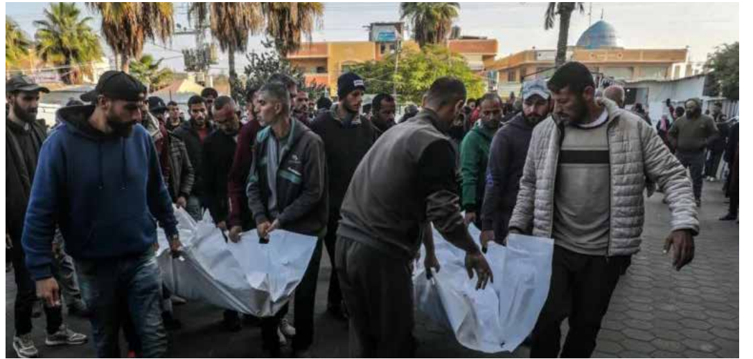
Gaza, 9 dicembre 2024. Il trasporto dei corpi all'ospedale di al Aqsa di una famiglia uccisa da un raid sionista

La segretaria generale di Amnesty International, Agnes Callamard, nel presentare il rapporto dichiarava che tale documento "mostra che Israele ha compiuto atti proibiti dalla Convenzione sul Genocidio, con l'intento specifico di distruggere la popolazione palestinese di Gaza. Questi atti comprendono uccisioni, gravi danni fisici e mentali e la deliberata inflizione di condizioni di vita calcolate per causare la loro distruzione fisica. Mese dopo mese, Israele ha trattato la popolazione palestinese di Gaza come un gruppo subumano non meritevole di diritti umani e dignità, dimostrando il suo intento di distrug-