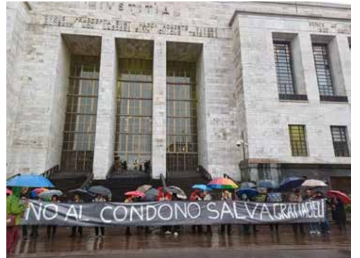
Milano, 23 maggio 2024. Presidio di protesta davanti al Palazzo di Giustizia contro il "condono salva grattacieli"

E non mancano i timori che il disegno di legge in discussione