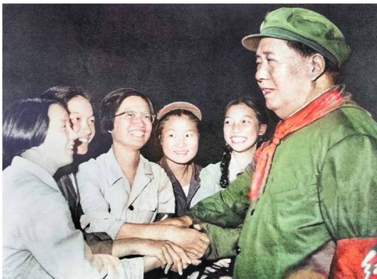
Mao incontra alcune donne durante la Grande Rivoluzione Culturale Proletaria

Nota introduttiva all'articolo: "Programma della Federazione democratica delle Donne cinesi del distretto di Singtai sull'ampliamento della portata del lavoro femminile nel movimento di cooperazione agricola", 1955, Libretto Rosso, Ristampa 1968, pag. 312