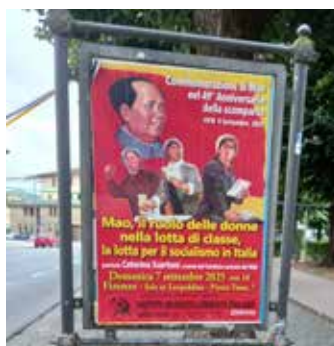
I manifesti della Commemorazione affissi nel centro di Borgo S. Lorenzo