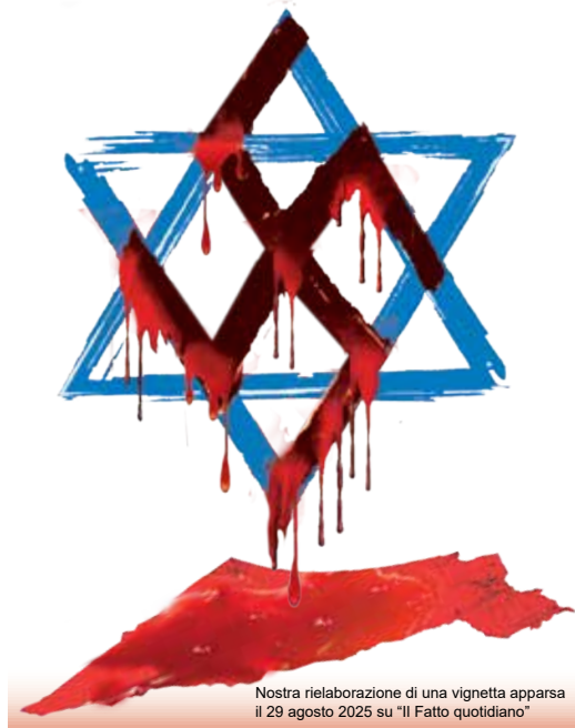
Nostra rielaborazione di una vignetta apparsa il 29 agosto 2025 su "Il Fatto quotidiano"

La dichiarazione ufficiale degli occupanti sionisti sull'attacco a Gaza era il passo che annunciava l'inizio della messa in opera del piano criminale presentato da Netanyahu l'8 agosto. L'esercito occupante già controlla direttamente circa l'80% della Striscia, restano fuori solo alcune città dove sono ammassati i due milioni di profughi palestinesi come Gaza City di cui il piano prevede l'invasione e la deportazione dei suoi abitanti; all'operazione militare su Gaza si affianca la separazione territoriale di Gerusalemme est dal resto della Cisgiordania che viene tagliata in due con l'interpo-