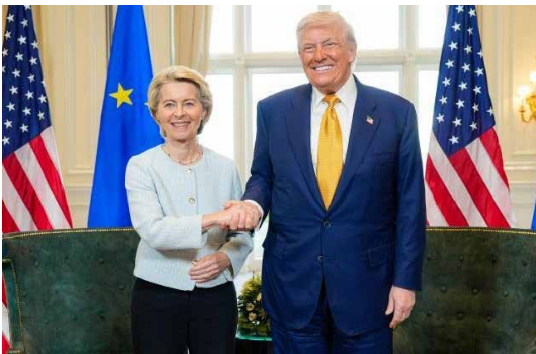
La stretta di mano tra Donald Trump e Ursula von der Leyen al termine delle trattative sui dazi

Davanti alla prepotenza di Trump, tra i 27 stati dell'Unio-