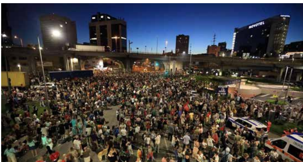
Genova, 30 agosto 2025. Una veduta della grande, combattiva e partecipata manifestazione che al porto di Genova ha salutato la partenza della Flotilla

Questa operazione è stata la risposta che gli antifascisti, gli antimperialisti della città di Genova, hanno voluto dare alla chiamata di Freedom flottiglia di unirsi nel