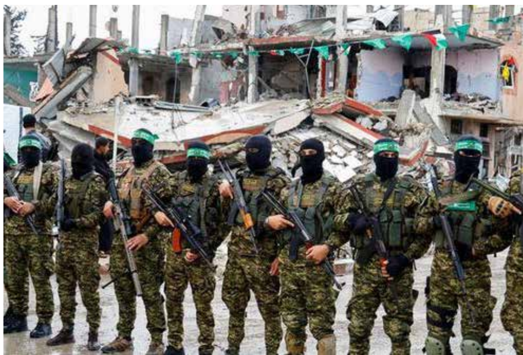
Una immagine dei combattenti della resistenza palestinese schierati tra le macerie di Gaza

Ciò a cui è sottoposta la Striscia è considerato un crimine di guerra secondo le leggi e i