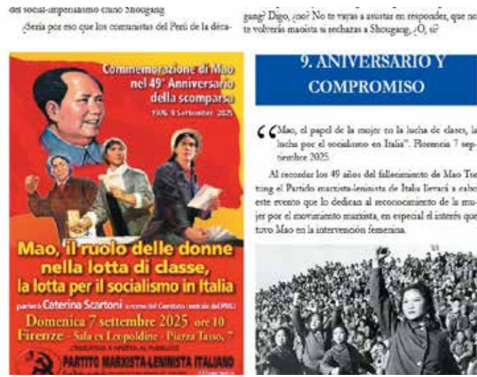
L'annuncio della Commemorazione di Mao 2025 pubblicato su Creacion Heroica n.40

In precedenza, il 27 luglio, era stata la volta di due gruppi Facebook, annoveranti più di 70mila membri cadauno, a postare l'annuncio della prossima Commemorazione di Mao e il relativo manifesto: il russo "Josif Vissiaronovich Stalin" e quello internazionale "USSR Pictures".