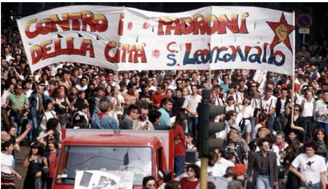
Milano, 10 settembre 1994, manifestazione di protesta del Leoncavallo dopo lo sgombero con l'intervento massiccio delle "forze dell'ordine" e la distruzione della sede che poi si spostò nell'attuale via Watteau

Lo sgombero non è la fine: è l'inizio di una nuova stagione di resistenza. E il 6 settembre, Milano sarà chiamata a scegliere da che parte stare.