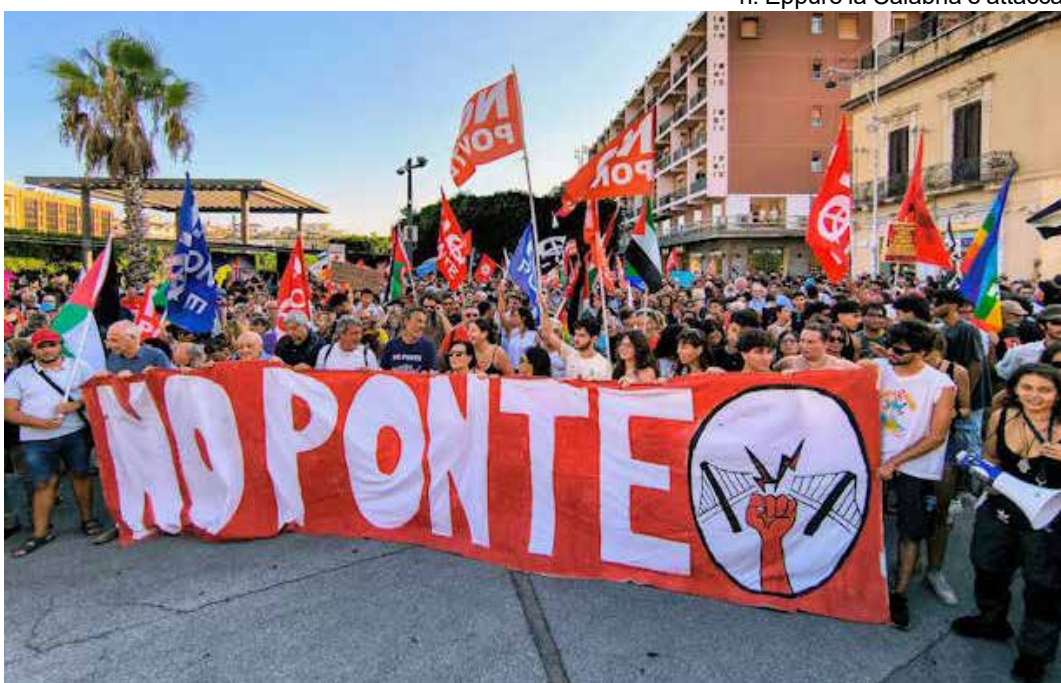
Messina, 9 agosto 2025. La manifestazione nazionale contro il ponte di Messina alla quale ha partecipato il PMLI. Nella foto lo striscione di apertura

tivo solo per i primi lavori, poi un altro progetto esecutivo per il secondo pezzo, e così via. Le sperimentazioni verranno fatte successivamente, anziché preventivamente. E che succede se qualcosa va storto e l'opera si incaglia? In questo caso scatta una pesante penale che lo Stato dovrà pagare al costruttore.