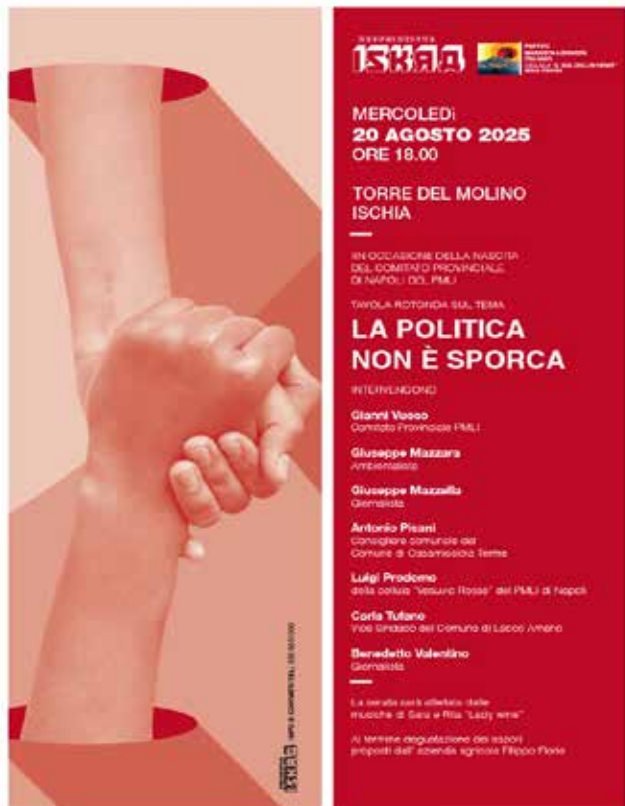
La locandina che annunciava il dibattito "La politica non è sporca"