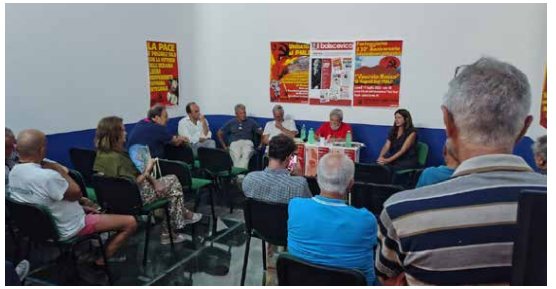
Ischia, 20 agosto 2025. Una veduta sala del dibattito "La politica non è sporca" durante il quale è stato varato il Comitato provinciale di Napoli del PMLI

pria spina nel fianco delle giun- te locali antipopolari inademp- pienti, inefficienti, dormienti, un avamposto che ha più volte denunciato lo scempio che si sta verificando nell'Isola ver- de, come il caso del parcheg- gio Siena, che ha prodotto una parziale crisi della giunta e la cacciata dell'assessore, la po- sizione netta e contraria dei familiari degli 11 morti a Ca- samiccioia rispetto all'archivia- zione espressa dalla Procura napoletana, respinta, appun- to, al mittente con l'opposizio- ne proposta dagli avvocati del- le famiglie, l'inquinamento del piccolo fiume denominato Rio Corbore, anche questo sotto la spada di Damocle dell'archi-