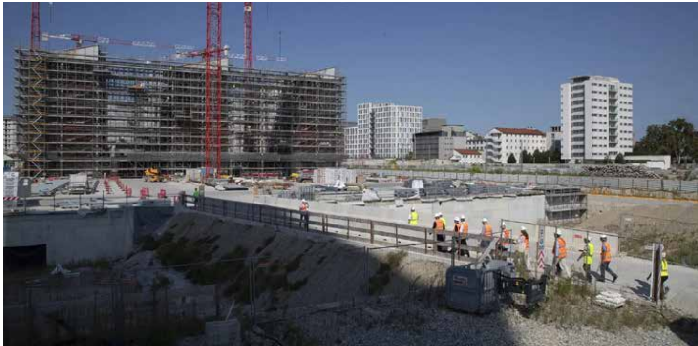
L'area di costruzione del villaggio olimpico per le olimpiadi invernali. Nuova occasione per ulteriori speculazioni

Un gioco delle parti che probabilmente sarà utile a Sala e alla banda di "mariuoli" della Commissione per il paesaggio ad alleviare le conseguenze penali, ma le responsabilità politiche sono lampanti e Sala, se gli è rimasto ancora un briciolo di vergogna, dovrebbe dimettersi immediatamente.