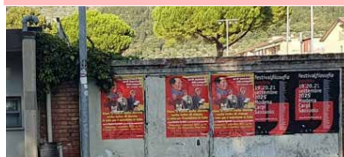
Allo Stadio Lungobisenzio a Prato