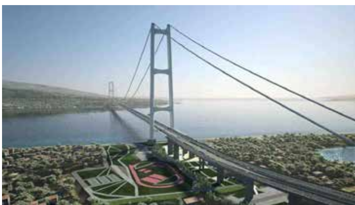
L'immagine di come potrebbe essere l'inutile Ponte di Messina

Com'è possibile, allora, che in queste condizioni il governo possa procedere lo stesso con la cantierizzazione? Perché lo scorso aprile ha fatto, col solito sistema decreto urgente-voto di fiducia, un'apposita legge che gli consente di procedere subito alla costruzione del ponte "per fasi": un progetto esecu-