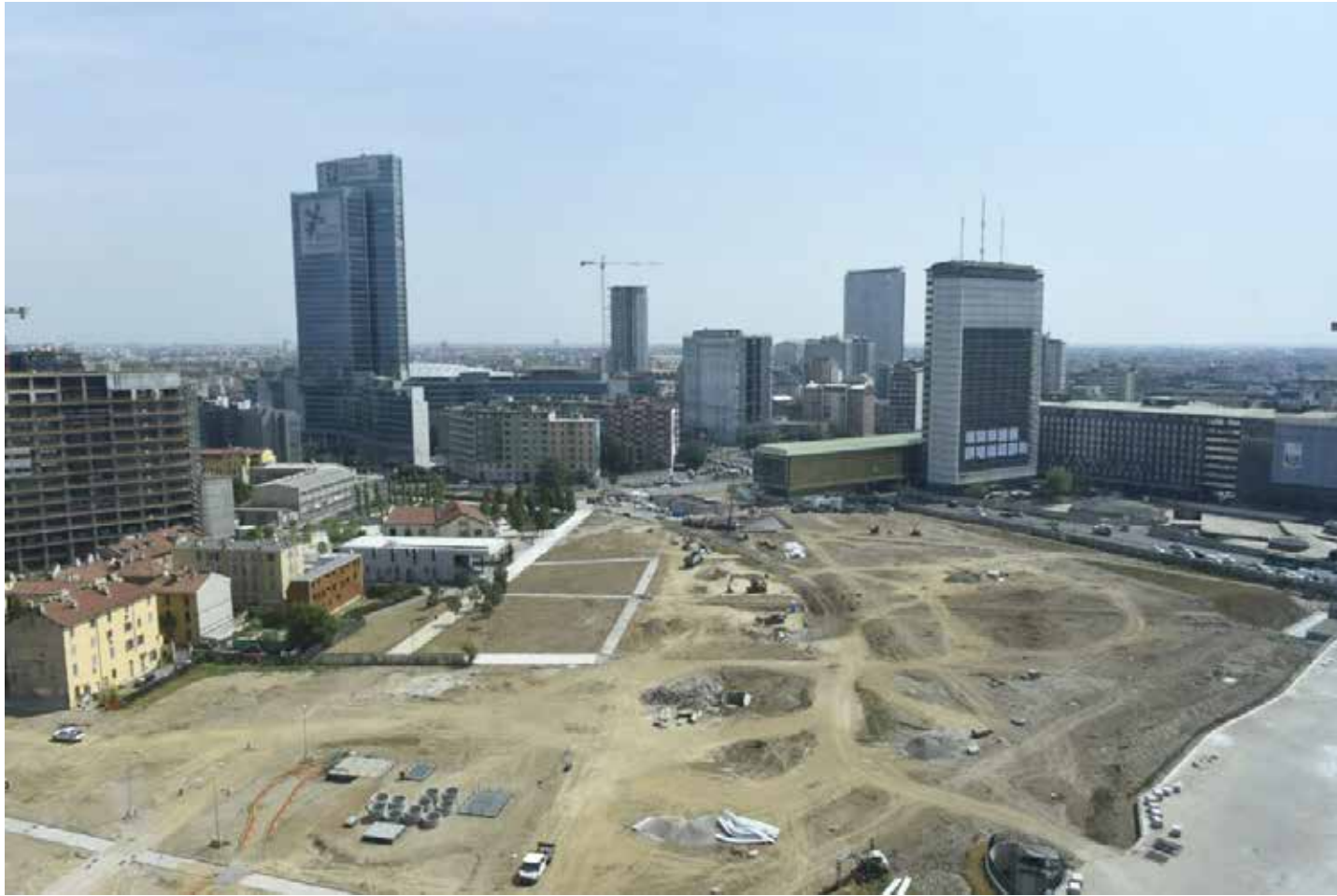
Milano, una delle vaste aree interessate dalla speculazione edilizia

Il tanto sbandierato "modello Milano" targato Pd e spacciato per "rigenerazione urbana" ha trasformato questa metropoli in una città privatizzata, accessibile ai soli ricchi, a esclusivo uso e consumo dei pescecani della finanza e dei grandi gruppi bancari, dei padroni dell'alta moda e del lusso sfrenato, ostentato senza vergogna e sbattuto in faccia ai milioni di poveri che in-