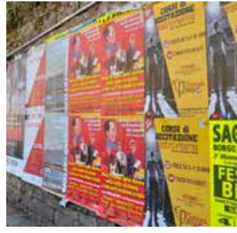
I manifesti della Commemorazione affissi a Firenze