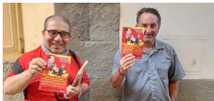
Borgo S. Lorenzo (Firenze). Diffusione del volantino per la Commemorazione di Mao

Sui tabelloni nel centro di Borgo San Lorenzo campeggiano i bellissimi manifesti della Commemorazione.