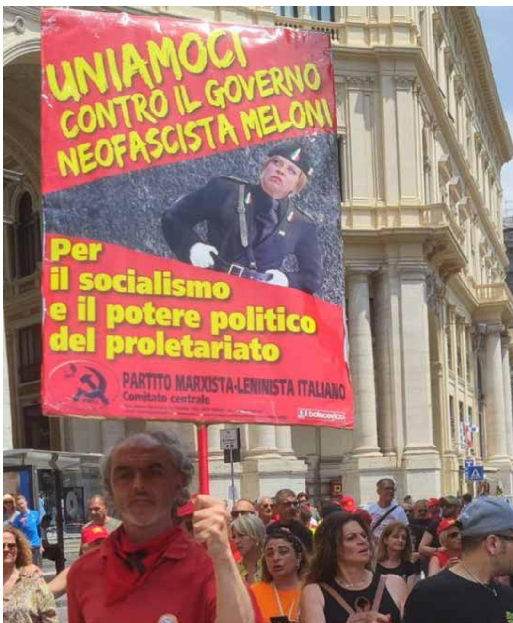
Napoli, 26 maggio 2023. Sciopero organizzato dalla USB per il lavoro

Il vero motivo è che con questa "riforma" si vuol creare un corpo di pm separato dagli altri magistrati, pronti per essere messi sotto il controllo del ministro della Giustizia, esattamente come scritto nero su bianco nel piano della P2. Con un esempio assai efficace, riferendosi al recente attacco di Nordio alla decisione della procura di Palermo di ricorrere in cassazione