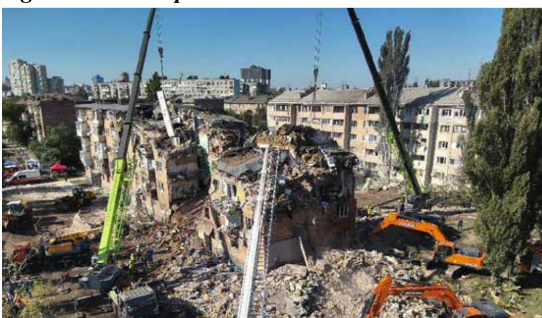
Le macerie dei criminali bombardamenti russi su Kiev con 20 morti di cui 4 bambini

Risposta che non ha dato il presidente USA Trump nell'incontro con il nuovo zar del Cremlino Putin il 15 agosto a Anchorage in Alaska, artefice addirittura di una vergognosa accoglienza amichevole. Non è stato un summit, ma un funerale. Quello della credibilità politica e morale degli Stati Uniti. Putin è stato accolto da un tappeto rosso sistemato con cura ossessiva fin sotto la scaletta del suo aereo, e con tutti gli onori di Stato, come se fosse un leader rispettabile, anziché un criminale di guerra con un mandato di cattura