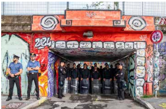
Milano, 21 agosto 2025. Lo sgombero del Leoncavallo. Un folto schieramento di carabinieri blocca l'accesso al Centro Sociale. All'esterno la pronta mobilitazione popolare di protesta

La ducessa Meloni ha parlato di "fine delle zone franche" e Piantedosi ha celebrato la "linea dura contro le occupazioni abusive". Il duce aggiunto Salvini, fedele alla sua propaganda securitaria fascioleghista, ha esultato gridando "afuera!". Ma mentre i palazzi del potere neo-