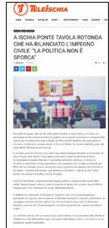
L'articolo sulla tavola rotonda pubblicato sul sito di Teleischia

La serata si concludeva attorno alle 21 in un clima fraterno e da compagni, alzando i calici di vino bianco in onore del Comitato provinciale partenopeo del PMLI, la nuova stella rossa che brilla sul cielo di Napoli e provincia.