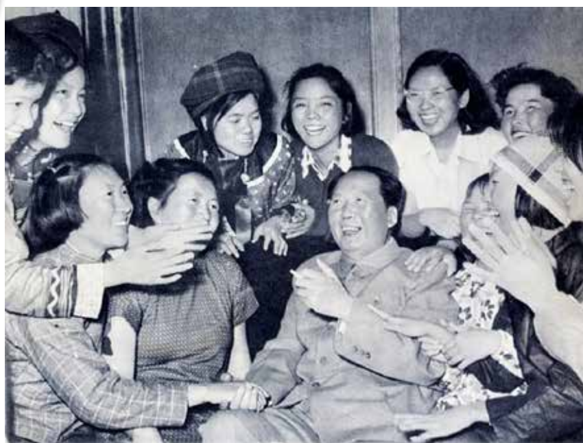
Mao con un gruppo di lavoratrici nel 1957 poco prima del lancio del Grande balzo in avanti

■ Proteggere gli interessi dei giovani, delle donne e dei bambini, fornire as-