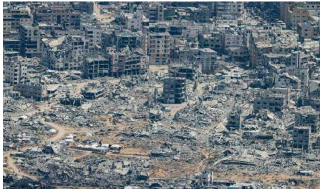
Gaza rasa al suolo dai raid nazisionisti e l'esodo dei palestinesi

Il piano in cinque punti su Gaza e i nuovi insediamenti dei coloni sono azioni propedeutiche al controllo militare diretto almeno di una parte della striscia di Gaza, se non di tutta, una volta cacciati i palestinesi, e dell'annessione ufficiale di buona parte della Cisgiordania, in previsione di prenderla tutta, salvo forse la residenza del collaborazionista presidente dell'Anp Abu Mazen. Ma il progetto sionista del criminale Netanyahu non si ferma a costruire la "Grande Israele" tra il fiume e il mare, tra il Giordano e il Mediterraneo, inglobando Gaza, Cisgiordania e Gerusalemme est, magari senza palestinesi ma punta a un obiettivo ancora più grande che illustrava in un'intervista del 12 agosto all'emittente israeliana i24News: uno Stato già immaginato da una corrente storica sionista che si estende dal Nilo all'Eufrate, comprendente quindi anche intere nazioni o parti di esse, Giordania, Libano, Siria, Egitto, Turchia, Iraq e Arabia Saudita. Le proteste dei governi di Giordania, Egitto e Arabia Saudita sono durate il tempo di un sospiro. Il criminale Netanyahu quindi non pensa solo a "finire l'opera" contro Hamas, come lo ha incitato di nuovo Trump l'1 settembre.