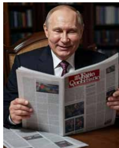
Vignetta realizzata dall'autore

L'anno successivo la Russia interviene anche nel conflitto in Siria, per supportare direttamente il regime di Assad che i ribelli stavano tentando di rovesciare. I combattimenti ed il numero di morti, anche per via dell'impiego di gruppi di mercenari, è da quel momento salito a dismisura. Circa la metà dei 600.000 morti fatti registrare dalla guerra civile che era esplosa nel 2011, sono da attribuire ai bombardamenti e agli attacchi coordinati via terra delle forze lealiste oltre che delle truppe e dell'aviazione di Mosca. Le atrocità com-