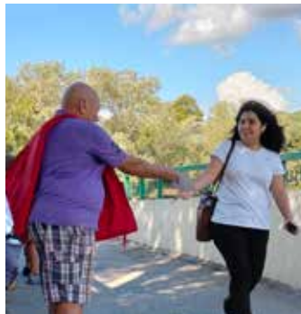
Firenze. Due momenti della diffusione del volantino della Commemorazione di Mao alla passerella di piazza Isolotto

Nei prossimi giorni verranno affisse le locandine di grande formato presso sedi universitarie, casa dello studente e altri punti strategici. Effettuata anche una diffusione del volantino al Ponticino sull'Arno che collega il quartiere 4 al parco delle Cascine e al resto della città.