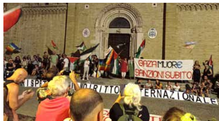
Fano (Pesaro Urbino) 27 luglio 2025. Un aspetto della manifestazione indetta dal "Gruppo per la pace e il disarmo" per rivendicare chiedere un immediato cessate il fuoco a Gaza e contro il genocidio dei palestinesi

Numerosi gli interventi e le dichiarazioni compiute da esponenti delle associazioni che costituiscono il gruppo organizzatore