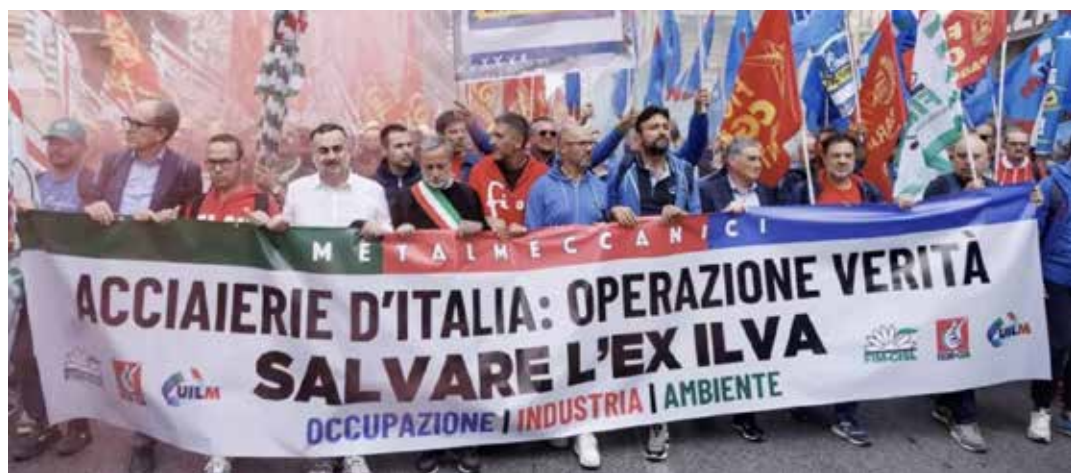
Taranto, 29 gennaio 2024. Manifestazione sindacale per la difesa del posto di lavoro, dell'ex-Ilva e per l'ambiente

Si tratta per noi di un accordo inaccettabile, che non garantisce l'occupazione e rimanda la decarbonizzazione a termini troppo lunghi rispetto all'emergenza ambientale che sta vivendo la città di Taranto, come hanno ribadito i sindacati Cgil, Cisl, Uil e Uil convocati da Urso il primo, il 6, il 15 e 21 agosto. Ben diversa la reazione del governatore della Puglia Emiliano che ha usato toni entusiastici: "oggi è un giorno che resterà nella storia della Puglia e dell'Italia intera. Con la firma odierna si dà il via alla piena decarbonizzazione degli impianti