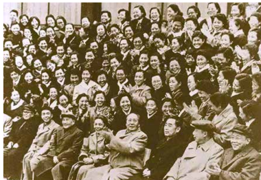
Mao e altri dirigenti al 3° Congresso nazionale delle Donne Cinesi tenutosi a Pechino dal 9 al 20 settembre 1957

■ Per la costruzione di una grande società socialista, mobilitare le larghe