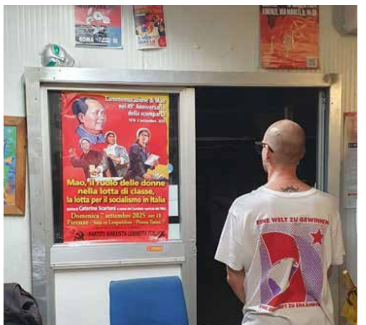
Il manifesto per la Commemorazione di Mao nel presidio della ex GKN di Campi Bisenzio (Firenze)