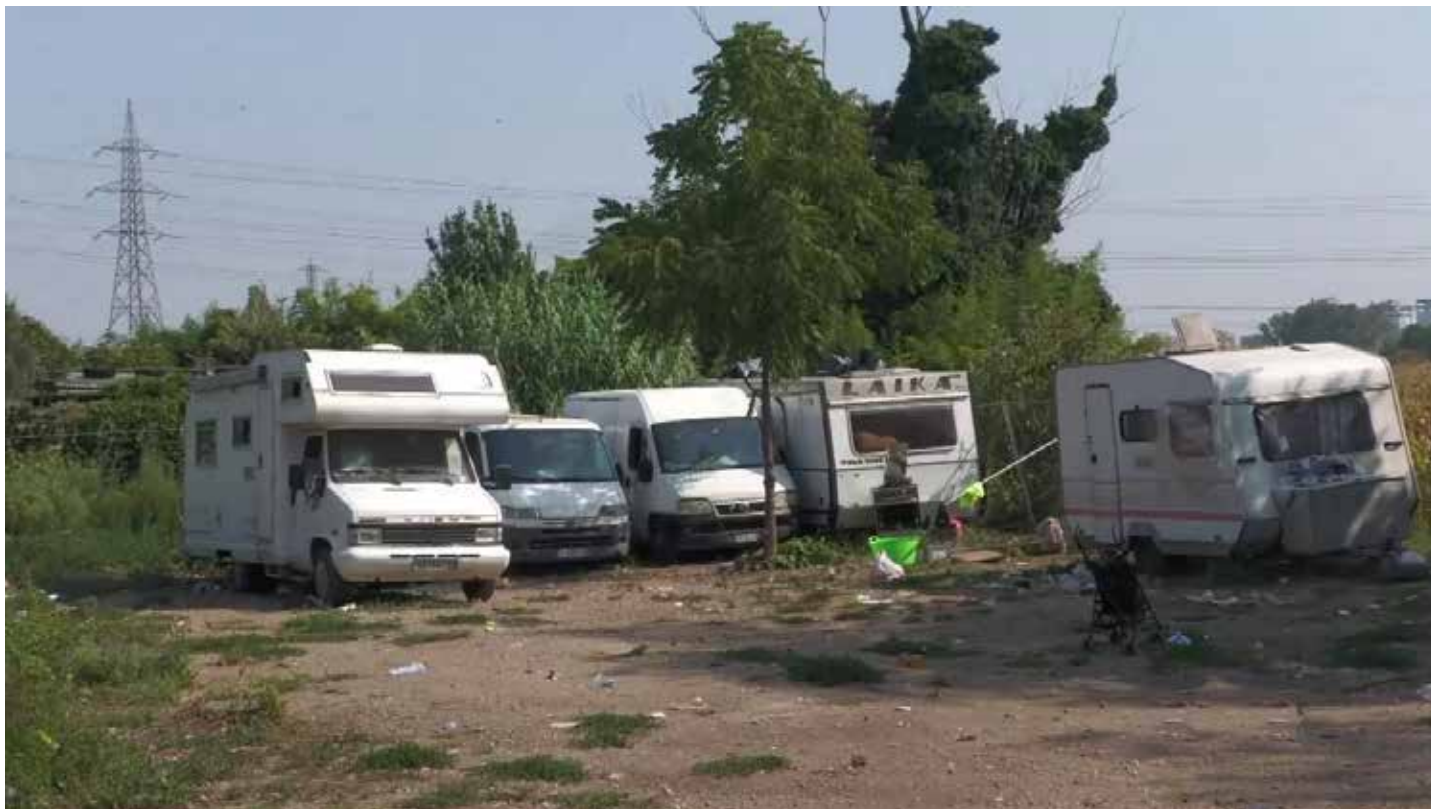
Un aspetto della estrema periferia di Milano. Un campo di mezzi abbandonati utilizzato come campo per i rom

Ma è altrettanto vero che le sue responsabilità politiche per aver completamente asservito la sua giunta a una cricca di amministratori-funzionari-progettisti-costruttori senza scrupoli sono grandi e mostruosi come quella selva di grattacieli che hanno violentato Milano. Ecco perché deve dimettersi subito.