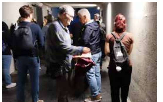
Rufina (Firenze), 1 settembre 2025. Due momenti della diffusione dei volantini per la Commemorazione di Mao 2025

Dal corrispondente della Cellula "F. Engels" della Valdiesive