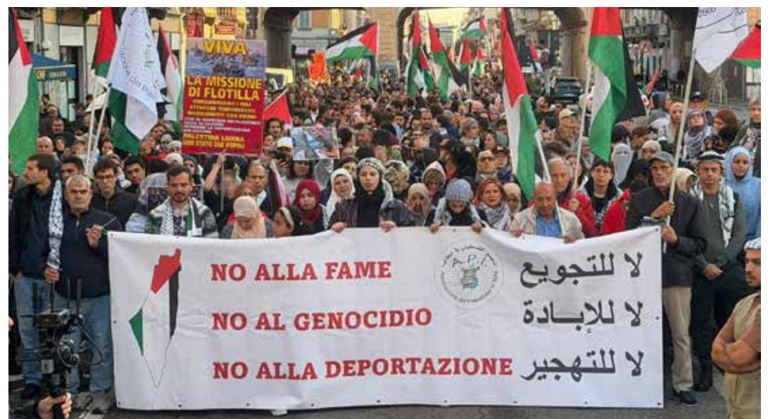
Milano, 27 settembre 2025. Sciopero e manifestazione contro il genocidio nazisionista, per la Palestina libera e a sostegno della Global Sumud Flotilla.

Dai numerosi filmati effettuati e pubblicati anche in rete risulta evidente che i manifestanti che si trovavano nella Galleria delle Carrozze si sono semplicemente difesi dalle cariche della polizia, e comunque la mobilitazione di quei giorni costituiva un dovere sociale imprescindibile di ogni cittadino democratico, in quanto era diretta a contestare un genocidio che allora si stava perpetrando, e che si sarebbe poi effettivamente perpetrato, a Gaza: le centinaia di migliaia di manifestanti che in tutta l'Italia si sono mobilitati contro il genocidio di Gaza sfidando la polizia, e tra essi certamente quelli della Galleria delle Carrozze, non hanno fatto altro che contrastare quella stessa, identica indifferenza di cui si legge al Binario 21 della stessa stazione di Milano Centrale, a meno di