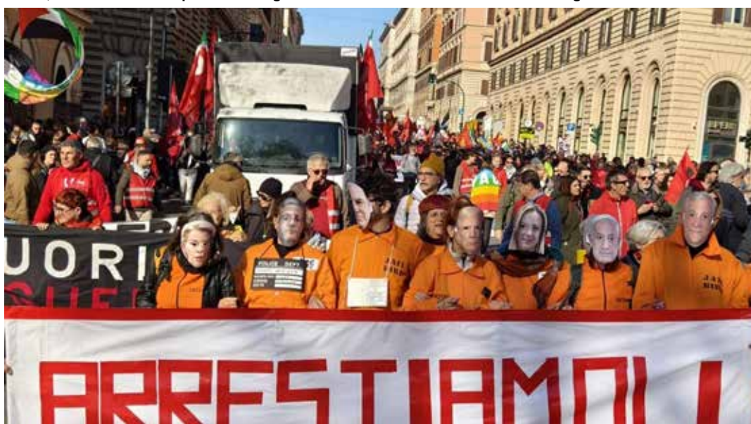
Roma, 28 marzo 2026. Durante in corteo dei manifestanti hanno sfilato travestiti da alcuni caporioni e da sostenitori dell'imperialismo dietro lo striscione Arrestiamoli. Da sinistra: Ursula von der Leyen presidente UE, Ben Gvir ministro sionista della sicurezza del governo Netanyahu, Crosetto, Trump, Meloni Mussolini in gonnella, Netanyahu, Tajani