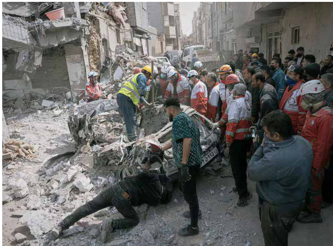
24 marzo 2026. Tabriz, città nell'Iran nord occidentale, colpita da un attacco americano

I Guardiani della rivoluzione annunciavano di avere colpito diversi obiettivi militari americani e una nave israeliana nell'88esima ondata di attacchi scatenata la mattina del 31 marzo. "In questo raid fulmineo, una nave portacontainer appartenente al regime sionista, denominata Express Halfong, è stata colpita da missili balistici delle forze navali dell'Irgc nelle acque centrali del Golfo Persico", si sosteneva in una nota diffusa alla televisione di Stato, "nella seconda operazione combinata, è stato colpito con precisione da droni kamikaze il punto di raccolta sulla costa degli Emirati Arabi Uniti dei marines americani, che si nascondevano in un luogo segreto fuori da una base militare"; Droni hanno "distrutto il sistema anti-drone (Hawk) della Quinta Flotta dei terroristi americani, schierato fuori dalla base e intorno all'aeroporto di Manama in Bah-