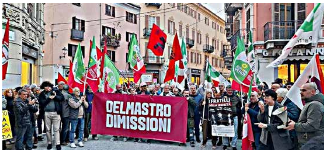
Biella, 24 marzo 2026. Manifestazione per richiedere le dimissioni di Delmastro, sottosegretario alla giustizia del governo neofascista Meloni, inquisito per i suoi legami con ambienti mafiosi. Tra i partecipanti si nota la presenza dell'Organizzazione di Biella del PMLI

Al termine degli interventi sono state intonate le canzoni della Resistenza e della tradizione di lotta del movimento operaio, "Bella ciao" e "Fischia il vento", a testimonianza del legame storico tra antifascismo militante