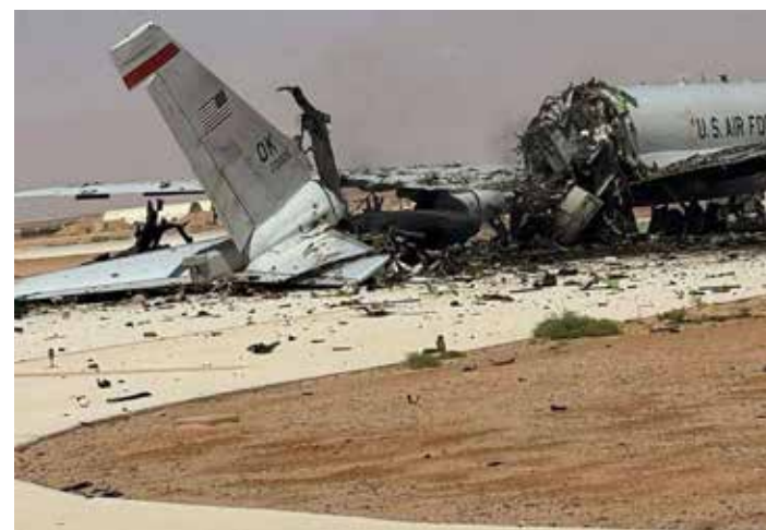
Il costoso aereo americano per il controllo e lo spionaggio distrutto da un missile iraniano il 29 marzo 2026 nella base USA in Arabia Saudita

Ha respinto la definizione della guerra in corso come una guerra per procura sul suolo libanese, "questa non è una guerra per conto di altri sul suolo libanese, ma una guerra condotta da Israele e dagli Stati Uniti contro il Libano, a cui hanno risposto la Resistenza, il popolo, l'esercito e tutti coloro che si sono precipitati in sua difesa. Siamo impegnati in una battaglia difensiva per il Libano e il suo popolo"