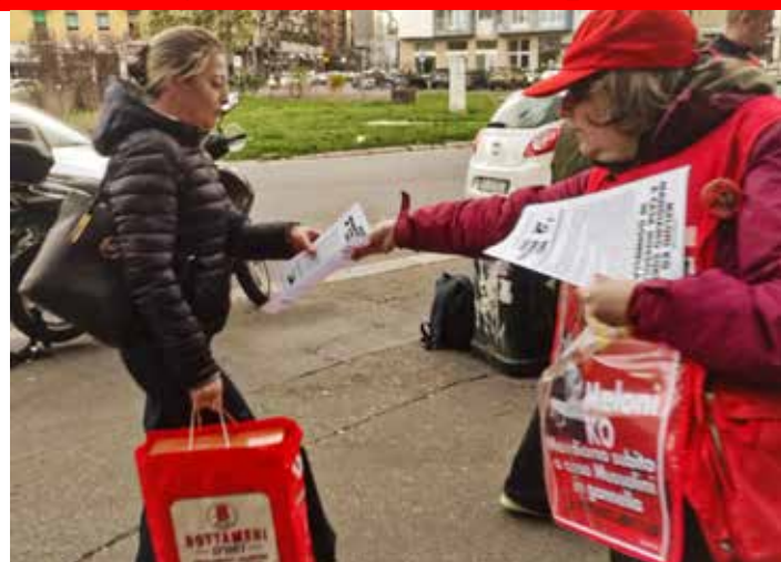
Milano, 28 marzo 2026. Diffusione sui risultati del referendum in Piazza Costantino

La Squadra milanese di propaganda referendaria marxista-leninista, con spirito ed entusiasmo antifascisti, ha partecipato con tutte le sue forze a questa importante battaglia politica per la vittoria del NO e si è quindi sciolta con un bilancio positivo e incoraggiante del suo operato, consegnando al Partito un importante esempio di prepa-