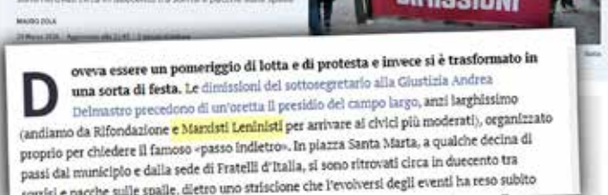
Un ritaglio tratto da "la Stampa" online sulla manifestazione contro Delmastro. Evidenziata in giallo la presenza del PMLI

In piazza Santa Marta, vicino alla sede di Fratelli d'Italia, si sono ritrovati circa in duecento tra sintoni e pacchi sulle spalle