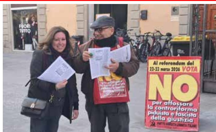
Borgo San Lorenzo, 28 febbraio 2026. Durante la diffusione congiunta dell'Organizzazione di Vicchio del Mugello del PMLI e della Cellula "F. Engels" della Valdisieve per il NO al referendum sulla controriforma giustizia nella centrale piazza Cavour

il nostro militante contributo al fronte del NO sia con le diffusioni del Partito che con quelle unitarie del Comitato del NO al