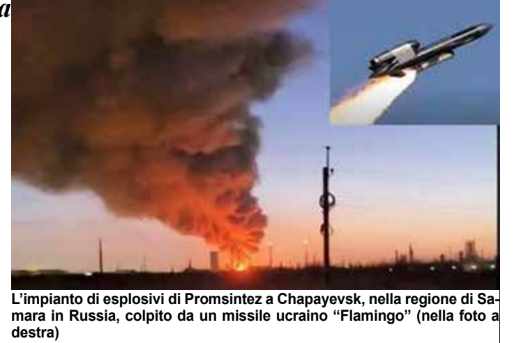
L'impianto di esplosivi di Promsintez a Chapayevsk, nella regione di Samara in Russia, colpito da un missile ucraino "Flamingo" (nella foto a destra)

Come riportato sempre dal Guardian , lo scorso anno la spesa per la difesa russa è aumentata del 42% raggiungendo i 13.100 miliardi di rubli (circa 139 miliardi di euro), mentre il Cremlino ha cercato di stabilizzare l'economia con la tassazione. Lo scorso gennaio, per esempio, la Russia ha aumentato l'Iva al 22% nel tentativo di raccogliere ulteriori 600 miliardi di rubli in tre anni dalle piccole e medie imprese. Ma il deficit di bilancio del Paese a gennaio e febbraio è cresciuto di oltre il 90% della cifra prevista per l'intero anno, a seguito delle sanzioni statunitensi che hanno costretto Mosca a