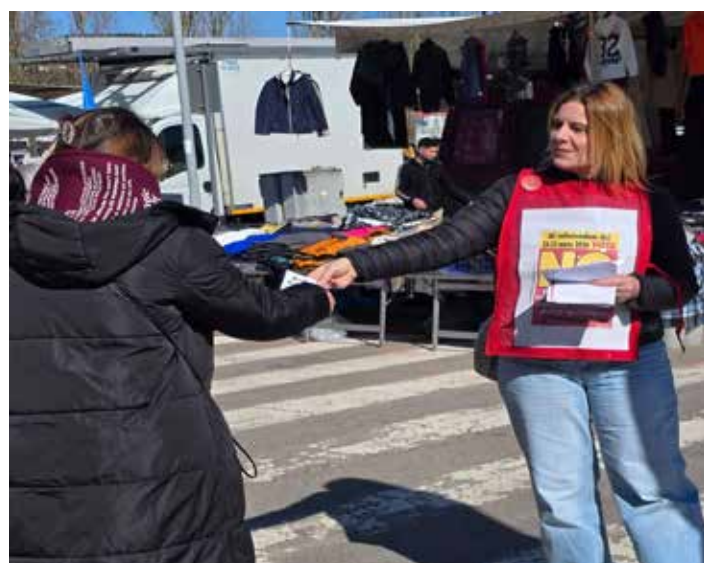
Perugia, mercato cittadino di Pian di Massiano, 21 febbraio 2026. Diffusione del volantino del PMLI per il NO al referendum sulla giustizia

Adesso si tratta di buttare giù Mussolini in gonnella con la lotta di piazza non facendo ingabbiare la protesta nella trappola riformista dell'opposizione parlamentare che si sta già fregando le mani per andare al governo con le prossime delle elezioni politiche.